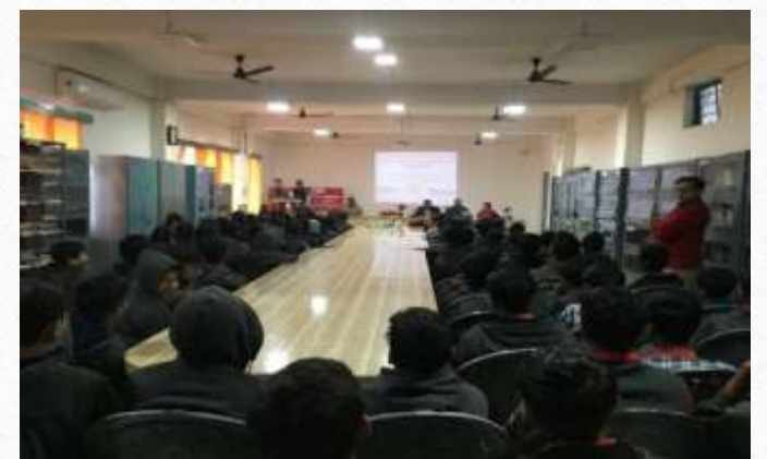
Seminar on millets