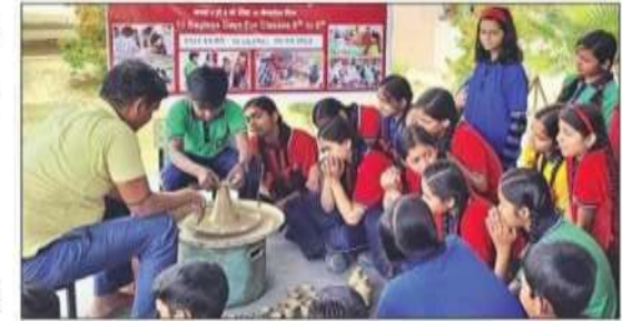
केंद्रीय विद्यालय-दो में पॉट मेकिंग का प्रशिक्षण लेते छात्र-छात्राएं। • अमृत विचार