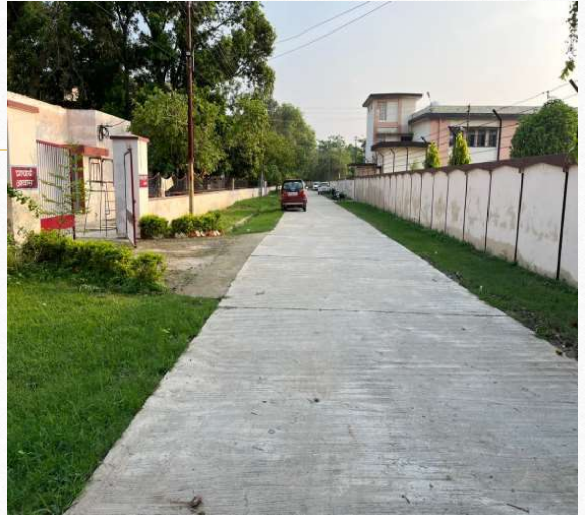
Renovation of Roads