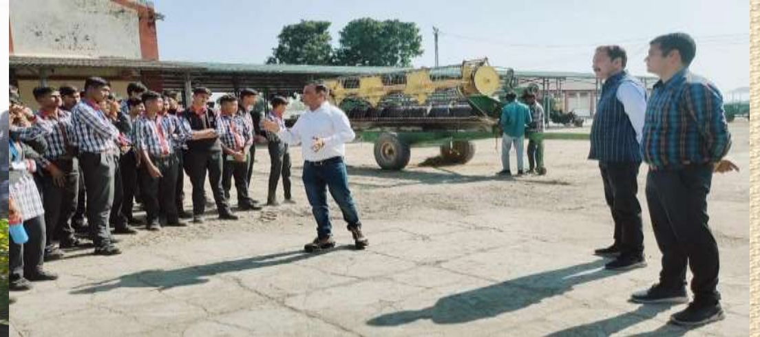
Field Visit of GB Pant University of Agriculture and Technology Pantnagar