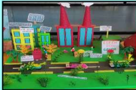
CLEAN INDIA GREEN INDIA