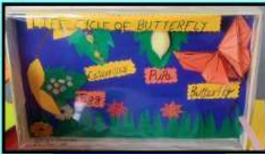
LIFE CYCLE BUTTERFLY