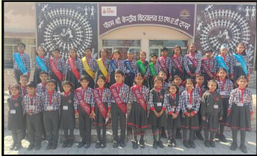
Student's Council of Primary Section