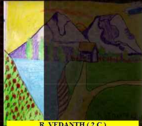
R. VEDANTH (2 C)