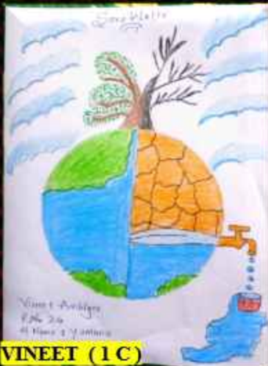
VINEET (1 C)