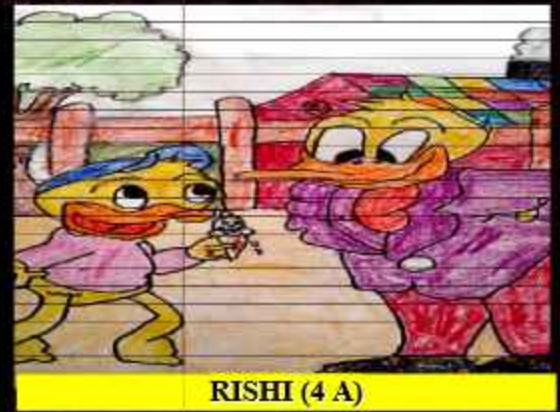
RISHI (4 A)