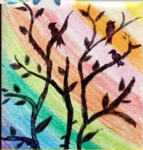
AAKANKSHA (1 B)