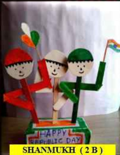
SHANMUKH (2 B)