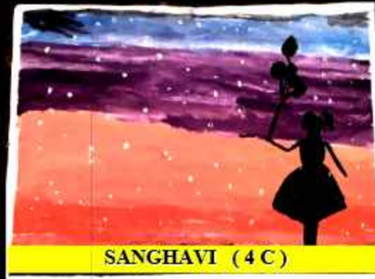
SANGHAVI (4 C)