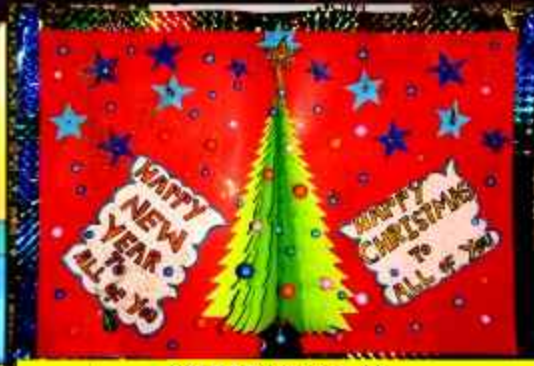
SHRITAN (1 A)