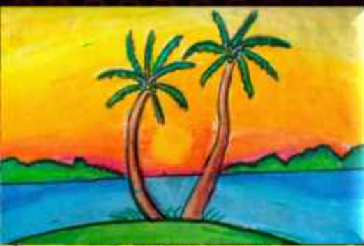
VANDANA (4 B)