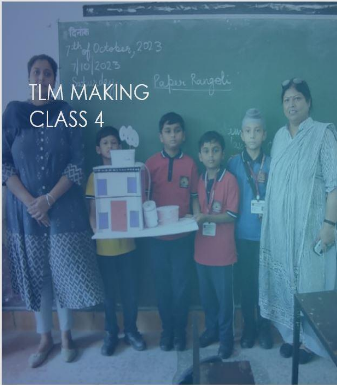
TLM MAKING CLASS 4