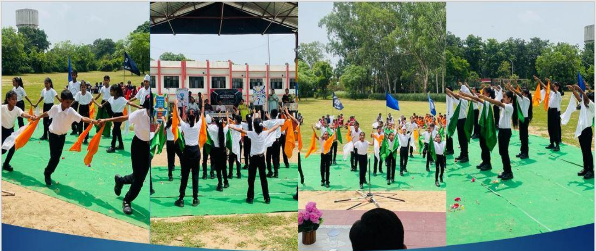
GROUP DANCE BY STUDENTS ON REGIONAL SPORTS MEET ON 10.08.2023