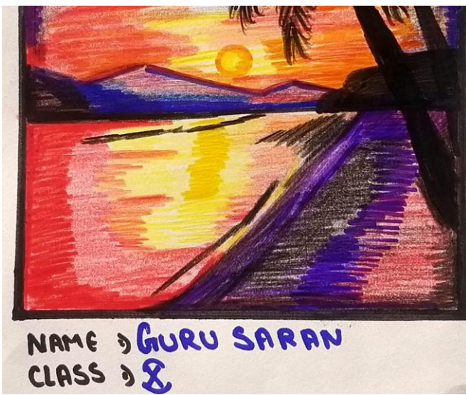
NAME : GURU SARAN CLASS : 8