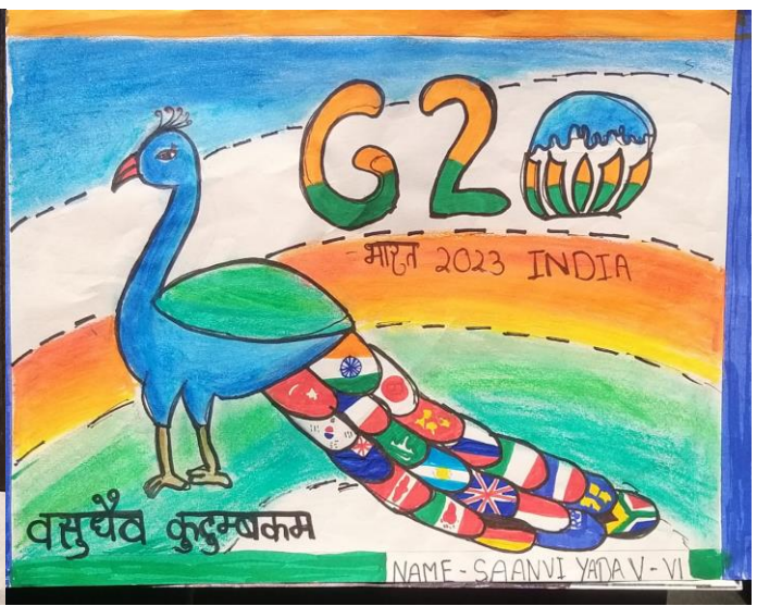
वसुधैव कुटुम्बकम् NAME - SAANVI YADAV - VI