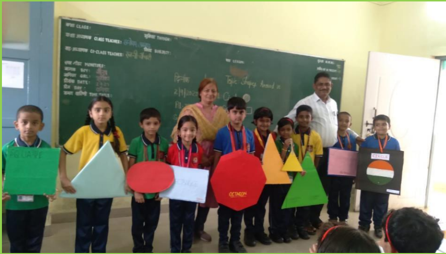
Class 2 Sub.Maths.FLN Activity...Shapes Around Us ( RolePlay)KV

Children participated in activity based teaching-learning process with great zeal