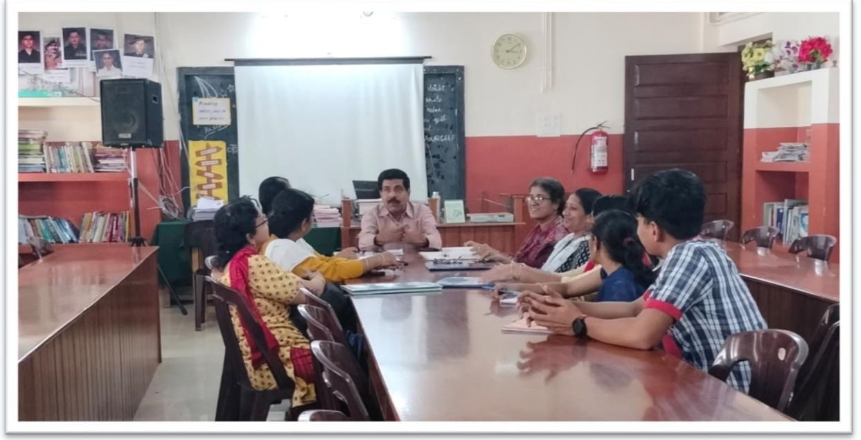
पुस्तकालय समिति की बैठक