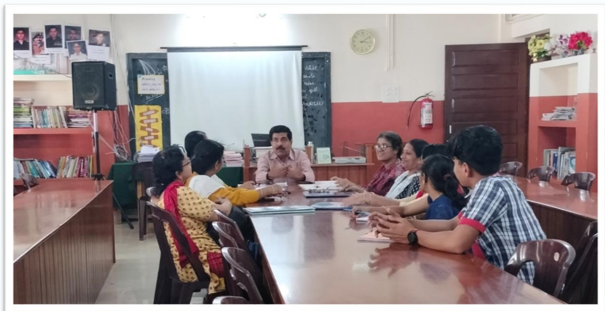
LIBRARY COMMITTEE MEETING