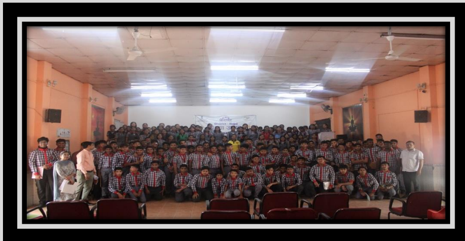
ALL THE PARTICIPANTS

In the beginning of the session we have organized the Prerana Utsav school level and blessed our students for their better future.