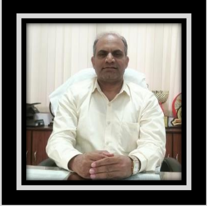
Shri Chandrashekhar Azad