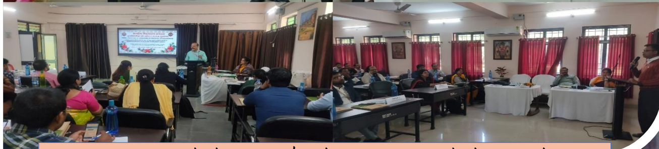
05-Day Workshop on 'Enhancing English Teaching through Competency based Learning Approach'