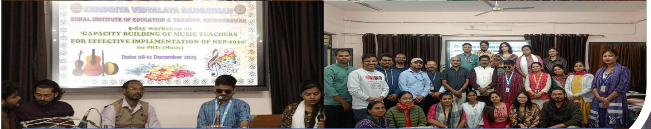
05-Day Workshop on 'Capacity Building of Music Teachers for effective implementation of NEP-2020'