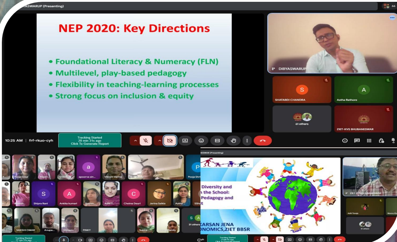
02-Day Online Workshop on 'Inclusive Education'