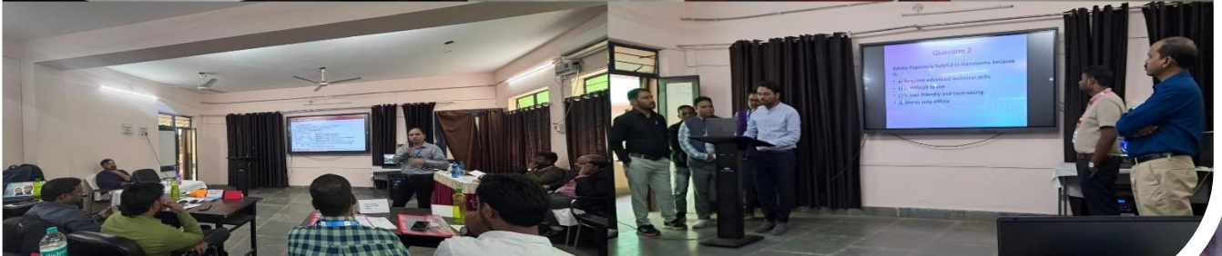
05-Day Workshop on 'Transforming Classroom Transactions with Application of Artificial Intelligence'