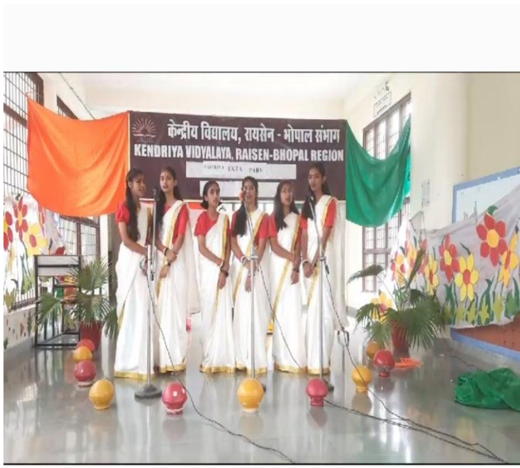
Figure 2 - Group song on national integration