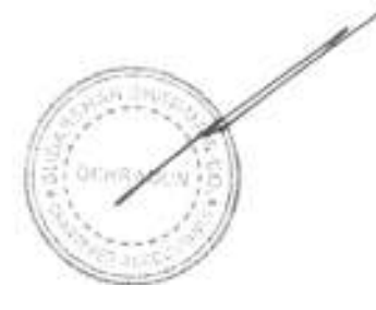
Member-Secretary Uttarakhand Biodiversity Board Dehradun.

TRANSFERRED TO EARMARKED/ENDOWMENT FUNDS