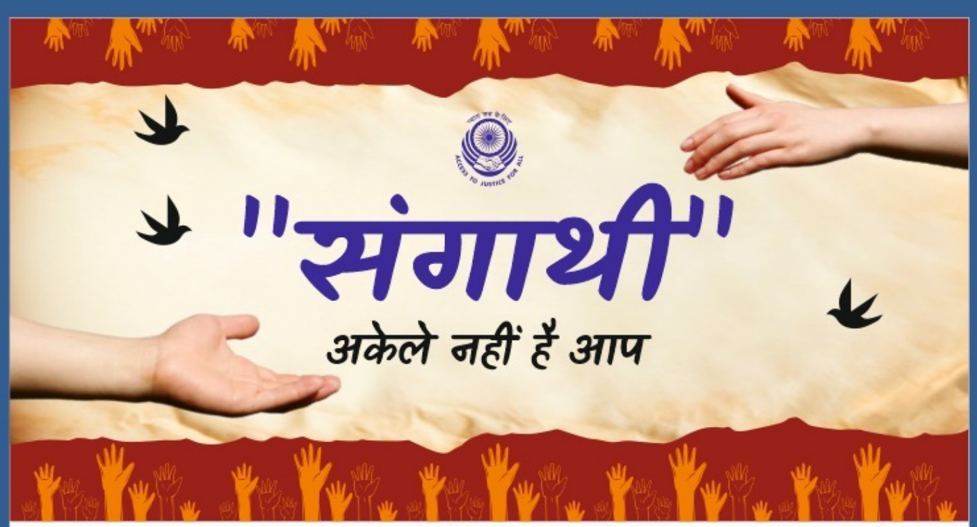
વિક્ટીમોલોજી કેન્દ્ર (ગુજરાત રાજય કાનૂની સેવા સત્તા મંડળની અનોખી પહેલ)