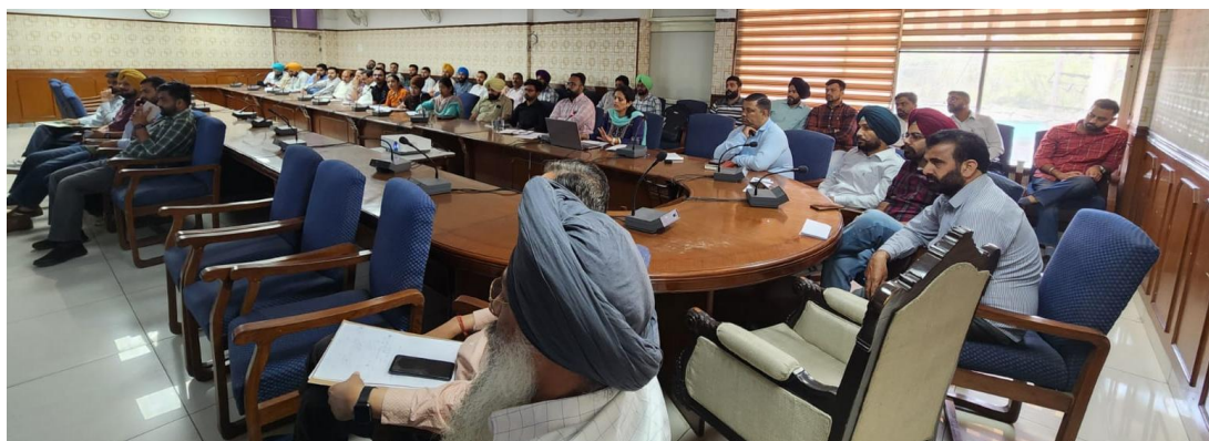
NIC Team providing training to the officials of Municipal Corporation Patiala