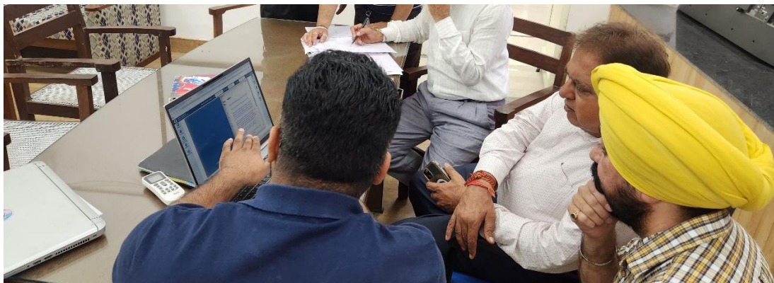
Sh. Kundan Gogia, Mayor Municipal Corporation Patiala taking training on House Agenda e-Book

It is a role-enabled work-flow based web application for automation, standardization and uniformity of the working methodology of MC House. It removes redundant processes which otherwise delay flow of information among various stakeholders. This induces the transparency and accountability in operations. It significantly minimizes paper usage with online communication and consequently saves huge money for government and trees from cutting.