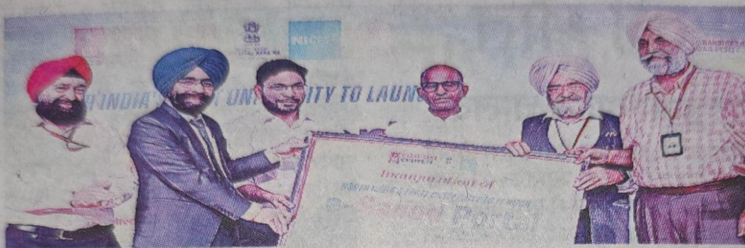
ਯੂਨਿਵਰਸਿਟੀ ਕੈਂਪਸ ਮੈਂ ਈ-ਸਨਦ ਪੋਰਟਲ ਕਾ ਸ਼ੁਭਾਰੰਭ ਕਰਦੇ ਮੁਖ਼ਯ ਅਤਿਥਿ ਸੀਯੂ

ਸੰਸਦ ਮੈਂਬਰ ਤੇ ਚਾਂਸਲਰ ਸਤਨਾਮ ਸਿੰਘ ਸੰਧੂ ਨੇ ਕਿਹਾ ਕਿ ਪੋਰਟਲ ਯੂਨੀਵਰਸਿਟੀ ਦੇ ਵਿਦਿਆਰਥੀਆਂ ਲਈ ਲਾਹੇਵੰਦ ਸਾਬਤ ਹੋਵੇਗਾ, ਜਿਨ੍ਹਾਂ ਨੂੰ ਵਿਦੇਸ਼ੀ ਸੰਸਥਾਵਾਂ ਦੁਆਰਾ ਆਪਣੇ ਅਕਾਦਮਿਕ ਸਰਟੀਫਿਕੇਟਾਂ ਦੀ ਪ੍ਰਮਾਣਿਕਤਾ ਦੀ ਲੋੜ ਹੁੰਦੀ ਹੈ। ਉਨ੍ਹਾਂ ਕਿਹਾ ਕਿ ਯੂਨੀਵਰਸਿਟੀ ਵਿਸ਼ਵ ਪੱਧਰ ਦੀ ਸਿੱਖਿਆ ਪ੍ਰਦਾਨ ਕਰਨ ਦੇ ਉਦੇਸ਼ ਨਾਲ ਕੰਮ ਕਰ ਰਹੀ ਹੈ।