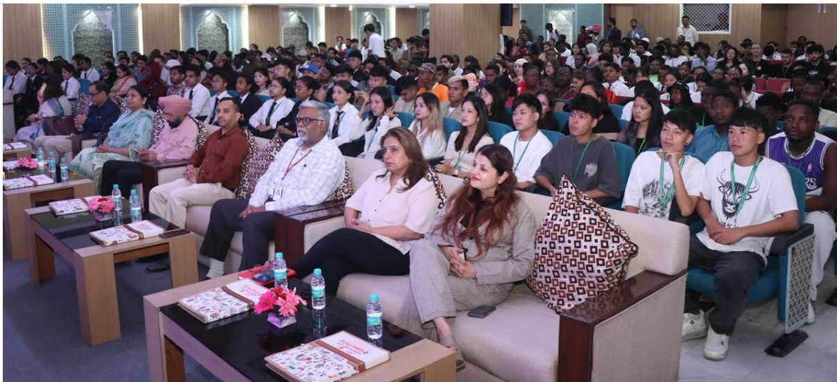
Faculty and students of Chandigarh University