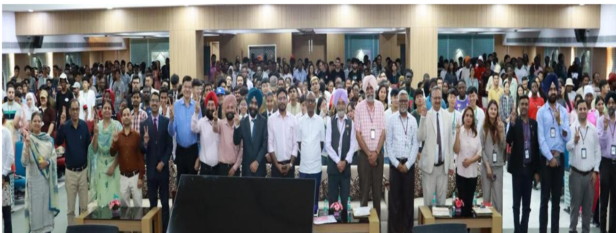
Group Photo of the event