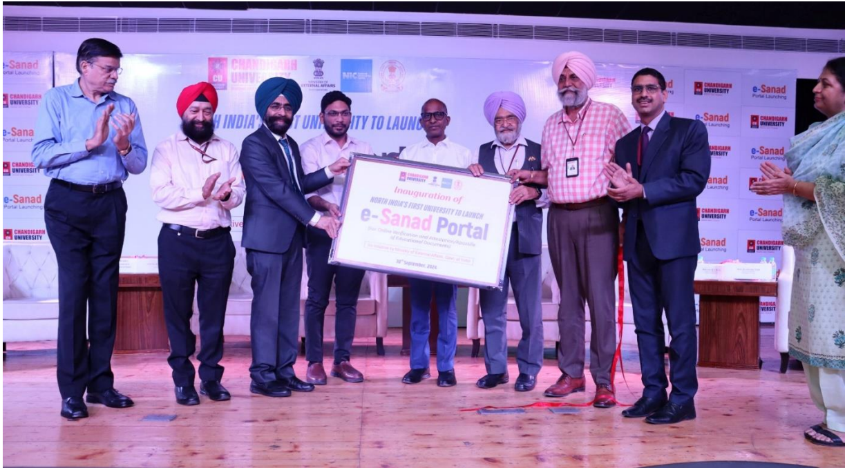
Launch of e-Sanad Portal by Chief Guest and esteemed dignitaries on dias