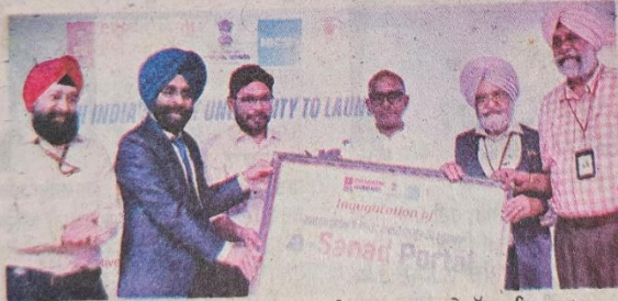
ਯੂਨੀਵਰਸਿਟੀ ਕੈਂਪਸ 'ਚ ਈ-ਸਨਦ ਪੋਰਟਲ ਦੀ ਸ਼ੁਰੂਆਤ ਕਰਦੇ ਮੁੱਖ ਮਹਿਮਾਨ।