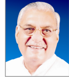
Sh. Bhupinder Singh Hooda Hon'ble Chief Minister, Haryana