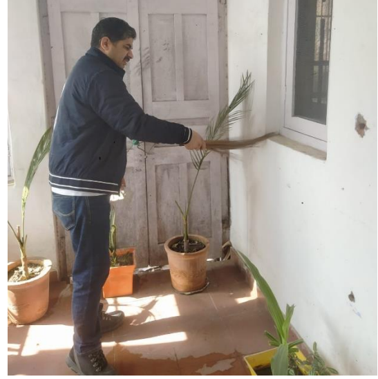
एनआईसी हिमाचल प्रदेश राज्य केंद्र एवं जिला केंद्रों के समस्त अधिकारी कार्यालय में सफाई करते हुए