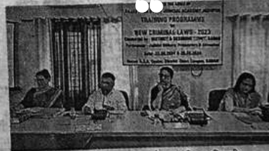
बारां, प्रशिक्षण कार्यक्रम के समापन पर मौजूद न्यायिक अधिकारी।