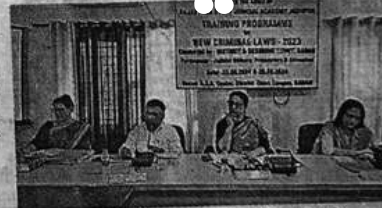
बारा, प्रशिक्षण कार्यक्रम के समापन पर मौजूद न्यायिक अधिकारी।