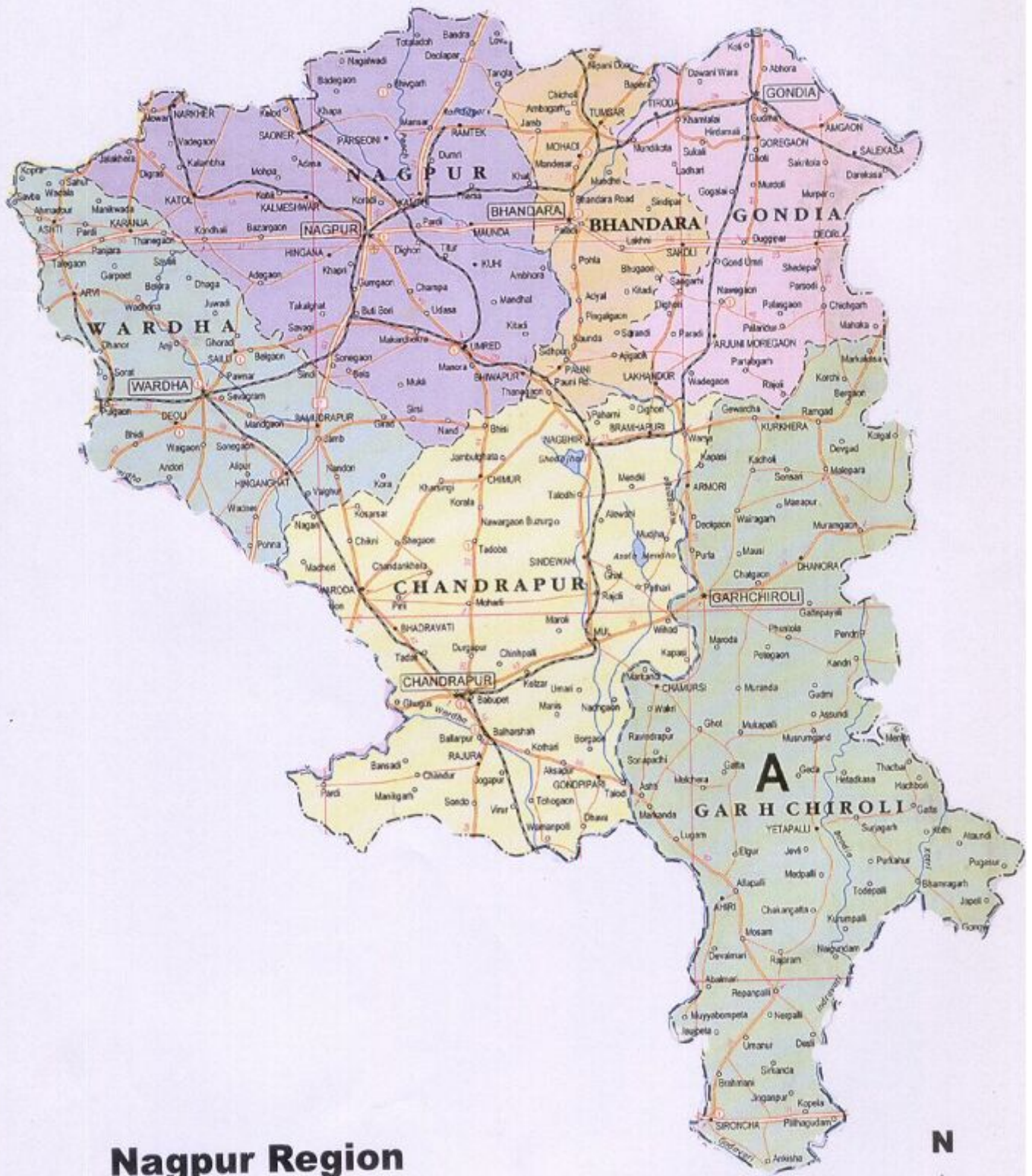
Nagpur Region Nagpur