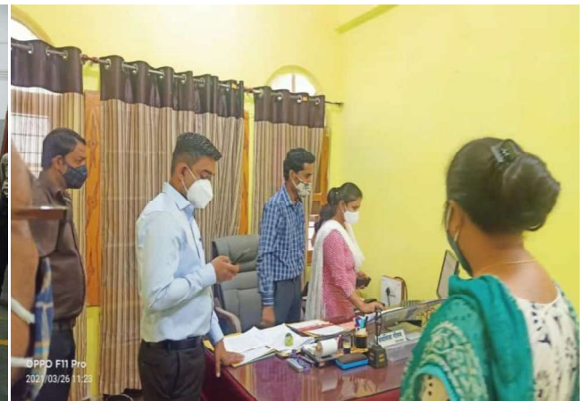
DM in Deputy Collector (OIC) Chamber

Collector Katni from his chamber logged into the eFile system and seen the file and entered his comments and approved the received draft and eSigned the letter with