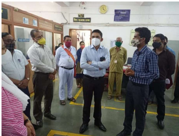
DM explaining importance of eoffice to Revenue staff