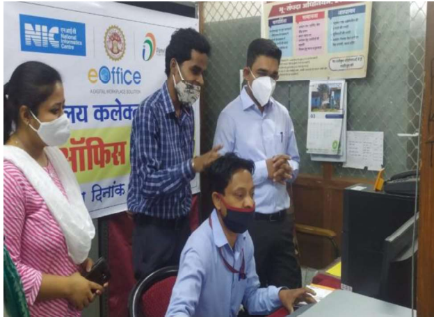
DM seeing the Diarization at Clerk Level

who received file from Office Superintendent and then Deputy Collector as an OIC moved the file with her comment to District Collector Katni.