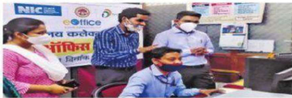
सॉफ्टवेयर की जानकारी देते अधिकारी।

» कलेक्ट्रेट में ई-ऑफिस साफ्टवेयर पर कार्य शुरू