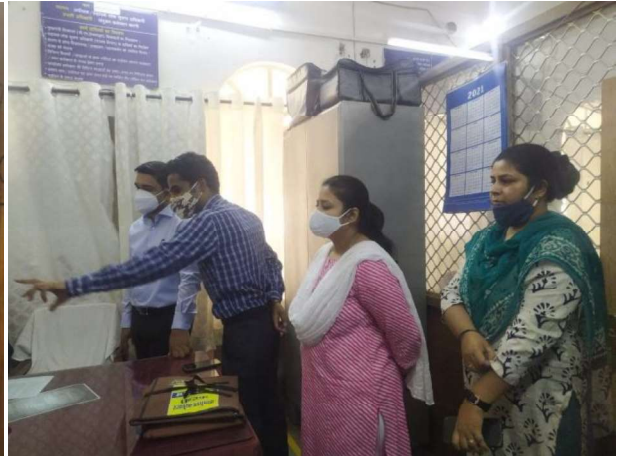
DM in Office Superintendent Chamber