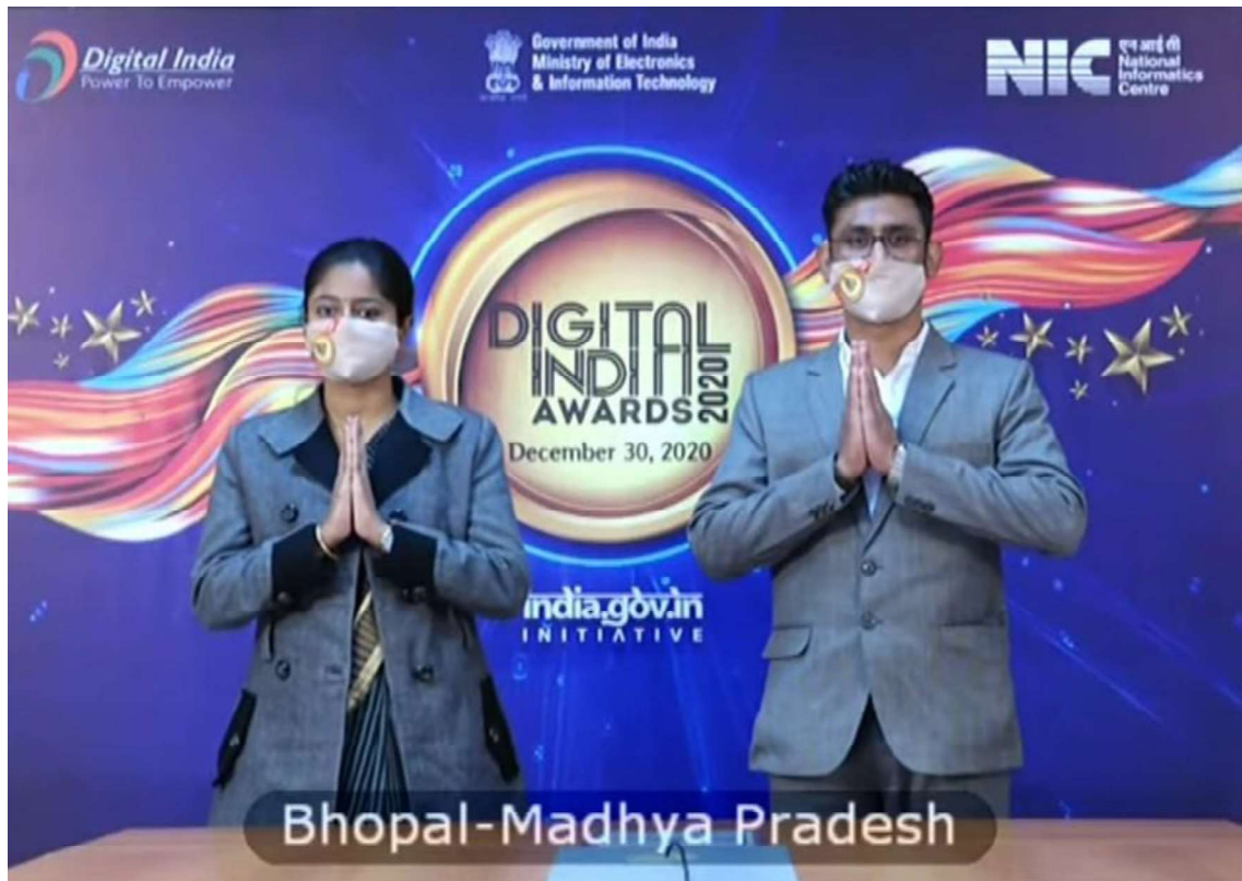
@Madhya Pradesh State Centre, Bhopal, VC Studio virtually receiving the award