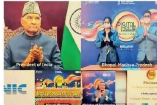
राष्ट्रपति व सूचना मंत्री ने सराहा... कलेक्टर और सूचना अधिकारी भोपाल से ऑनलाइन कार्यक्रम में शामिल हुए।

बुधवार को राष्ट्रपति भवन नई दिल्ली में कार्यक्रम हुआ। इसमें देशभर की राजधानियों में डिजिटली शामिल हुए। भोपाल के विध्याचल भवन में कलेक्टर व जिला सूचना अधिकारी ने यह अवार्ड डिजिटली प्राप्त किया। इलेक्ट्रॉनिक्स व सूचना प्रौद्योगिकी मंत्री रवि शंकर प्रसाद भी शामिल हुए। खरगोन जिला प्रशासन की वेबसाइट की खासियत यह है कि इसमें शासन की 90 योजनाओं की पूरी जानकारी उपलब्ध है, जो हितग्राही जानना चाहता है। तकनीकी क्षेत्र में ऐसे ही 7 कैटेगरी में 24 अवार्ड दिए गए।