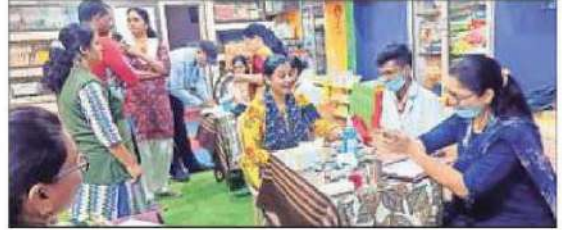
Doctors examining the staff of Vivek Mandir School, Gondia.