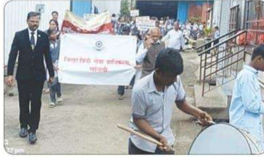
सांगली : कायदेविषयक जागृतीसाठी शहरात रॅली काढण्यात आली.