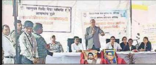
A guest addressing the gathering at the camp in Salekasa.