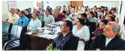
The consultation concluded with unanimous agreement on conducting a detailed study to understand the scale of the issue.

"Out of the 58 women surveyed, 13 were from