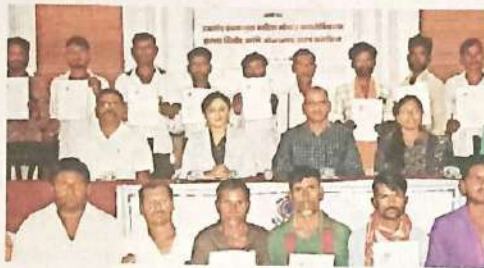
DLSA held a ceremony on April 23 where 55 sugarcane cutters were given their identity cards.

Meanwhile, over five thousand sugarcane cutters in Pune itself are yet to get their identity cards. It was in 2021 that the Maharashtra government initiated