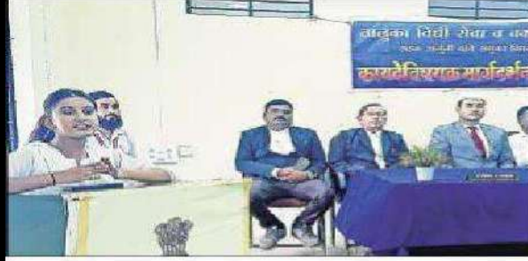
One of the law students speaking at the programme.

■ Our Correspondent SADAK ARJUNI, Sept 21