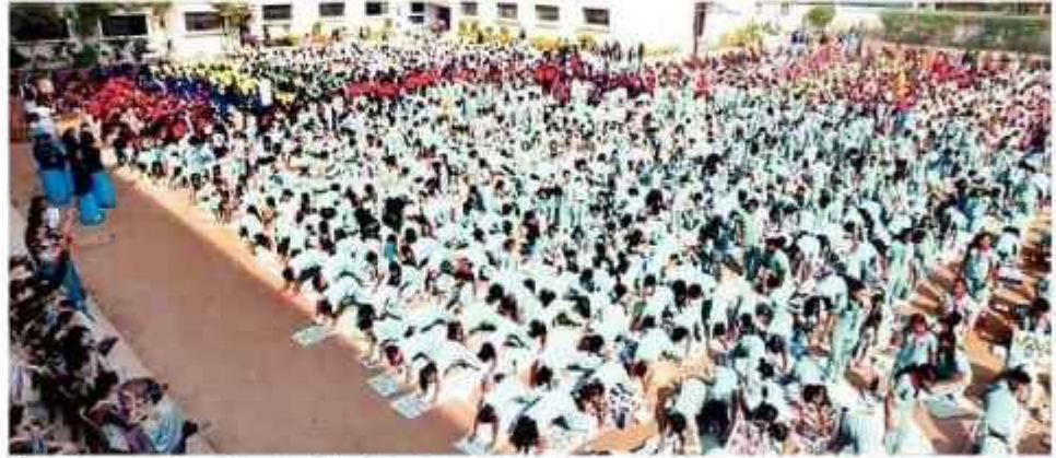
गीता परिवाराच्या वतीने आयोजित 'शक्ती-भक्ती महाकुंभ' सूर्यनमस्कार घालताना विद्यार्थी.