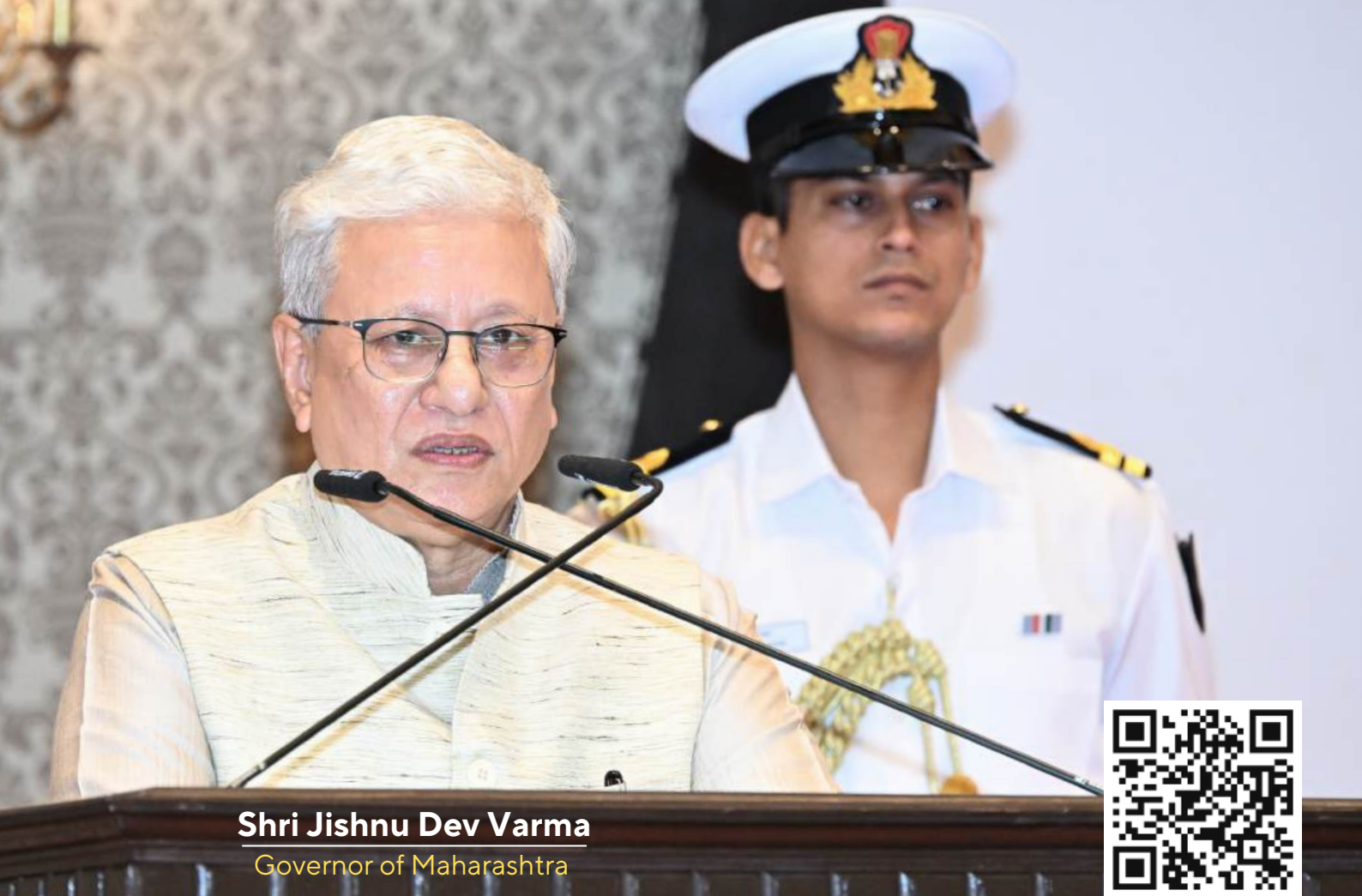
Shri Jishnu Dev Varma Governor of Maharashtra