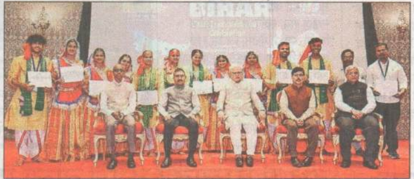
'एक भारत, श्रेष्ठ भारत' पहल के अंतर्गत कार्यक्रम का आयोजन किया गया।

'एक भारत, श्रेष्ठ भारत' पहल के अंतर्गत महाराष्ट्र लोक भवन द्वारा कार्यक्रम का आयोजन किया गया। यह कार्यक्रम मुंबई विश्वविद्यालय के सहयोग से संपन्न हुआ। इस अवसर पर मुंबई विश्वविद्यालय के विद्यार्थियों ने बिहार के लोक नृत्य और भोजपुरी गीतों पर