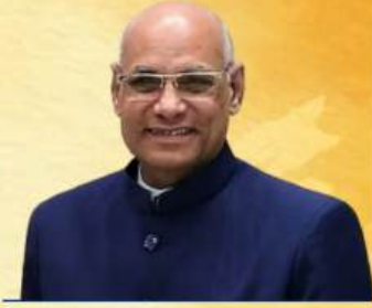
Shri Ramesh Bais