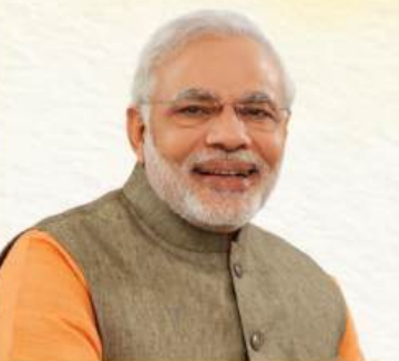
श्री नरेंद्र मोदी