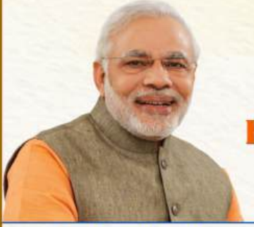
Shri Narendra Modi