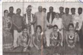
राजभवनतल गुरुवारी विविध राज्यांतील कलावंत सहभागी झाले होते.