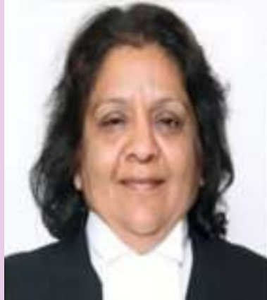
Hon'ble Ms. Justice Ritu Bahri Hon'ble Patron-in-Chief, Uttarakhand SLSA, Nainital