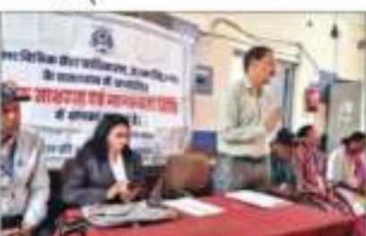
खटीमा में एचआईवी और एड्स में अंतर बताया