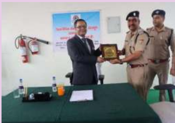
Legal awareness camp for labourers of unorganized sector by PLV Dehradun on 16.12.2023