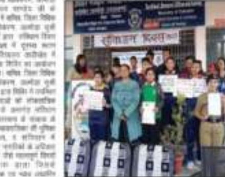
खटीमा में डीएलएसए के संयोजन में आपदा को लेकर प्रशिक्षण संपन्न

खटीमा: डीएलएसए के संयोजन में आपदा को लेकर प्रशिक्षण संपन्न। जिला सिविल सेवा प्राधिकरण के निर्देशानुसार जिला सिविल सेवा प्राधिकरण सदस्यों और रजिस्टार जी सिविल न्यायालय परिसर में सफाई अभियान चलाई गई।