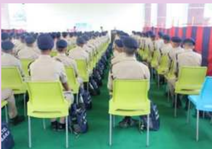
Awareness camp by PLV, DLSA Dehradun about Child Labour & Child Trafficking on 19.12.2023