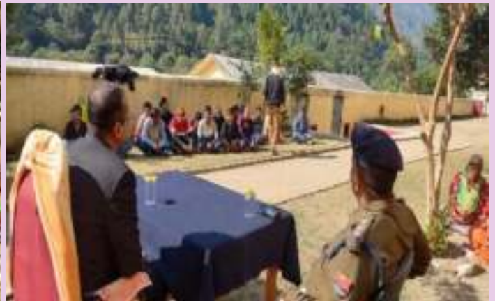
UDHAM SINGH NAGAR