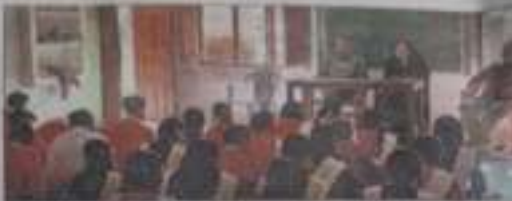
खटीमा में सिविल सेवा प्राधिकरण के माध्यम से एड्स की जानकारी देना सफाई अभियान

खटीमा: लघु फिल्मों के माध्यम से एड्स के बारे में जानकारी देना एक अच्छा तरीका है। जिला सिविल सेवा प्राधिकरण के निर्देशानुसार जिला सिविल सेवा प्राधिकरण सदस्यों और रजिस्टार जी सिविल न्यायालय परिसर में सफाई अभियान चलाई गई।