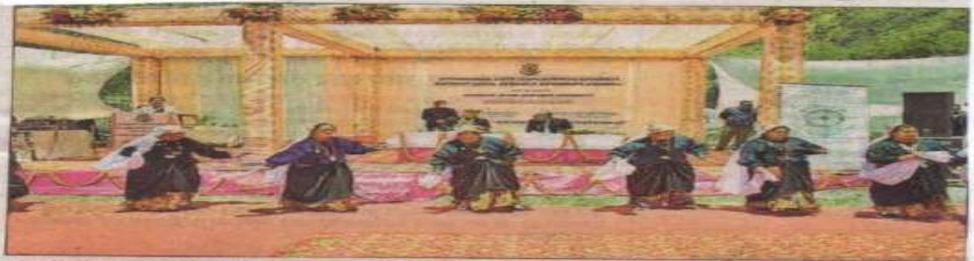
माणा में सुषतार की आयोजित शिविर के उद्घाटन अवसर पर धीमा नृत्य की प्रस्तुति देती स्थानीय महिलाएं।

खुशाल स्वागत ने वोट को स्मृति धुंध के साथ बहुदेरीय विधिक को पत्र रूप दिया। स्थानीय विद्यालय को छात्रों ने वास्तविक जानकारी को अक्षराय प्रस्तुति दी। जिला विधिक सेवा प्राधिकरण को सचिव व विधिक जल (सीमांत विधिक) निगरानी और के साक्षरता में हुए कार्यक्रम में जिलाधीशरी काल सीमा, पुलिस अधीक्षक श्वेत दीपे, एमटीएम कुमकुम जेरी, अधिकार, परीक्षक कार्यवाहक तथा विधिक विभागों के अधिकारियों और स्थानीय लोग मौजूद रहे।