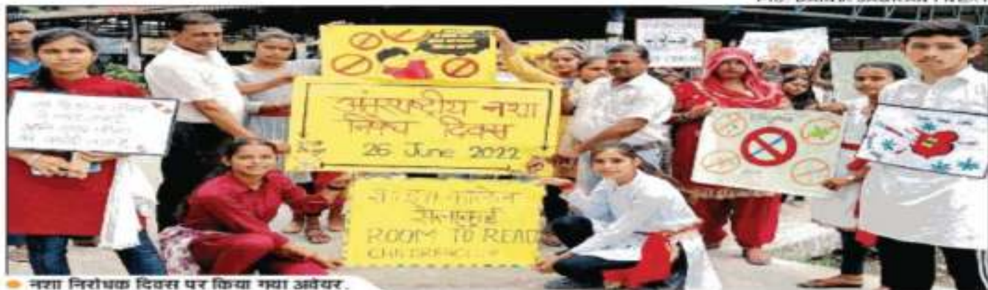
● नशा निरोधक दिवस पर किया गया अवसर.

DEHRADUN (26 June): विभिन्न सामाजिक संगठनों ने अंतरराष्ट्रीय नशा निरोधक दिवस के तहत बच्चों को जागरूक किया. साथ ही राज्य को नशामुक्त करने का संकल्प दिलाया. रविवार को चंदन नगर स्थित खुला बाल अग्रज गुह में जिला विधिक सेवा प्राधिकरण, सम्पूर्ण संस्था, मैक संस्था और से संकल्प नशा मुक्त