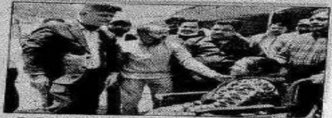
शिविर में एक दिव्यांग महिला से चर्चा करते न्यायमूर्ति उदय उमेश ललित।

बहुउद्देशीय शिविर में शामिल हुए हाईकोर्ट के वरिष्ठ न्यायमूर्ति