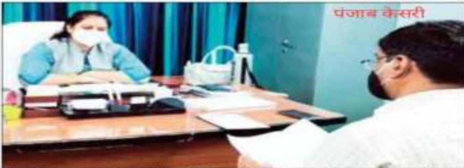
सोपेस्टार में खास सुरक्षा एवं अतिरिक्त विभाग के अधिकारियों की बैठक में ही जिला विधिक सेवा प्राधिकरण की अगुआई में बैठक का आयोजन किया गया।

पांच खाद्य कारोबारियों के विरुद्ध अपर जिला अधिकारी के न्यायालय में याद दायर किए गए हैं। नकली दवाओं व नशीले खाद्य पदार्थों के विरुद्ध और तेजी से अभियान चलाया जाएगा। (संक्षेप)