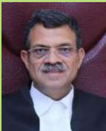
Hon'ble Mr. Justice Vipin Sanghi Hon'ble Patron-in-Chief, UKSLA, Nainital