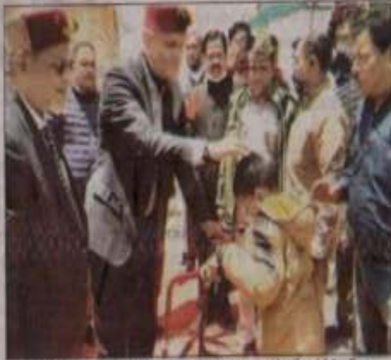
समकार : सीमांत गांव गांध में विधिक सेवा प्राधिकरण द्वारा प्रदान किये गये सुविधा को वरिष्ठ न्यायमूर्ति उदय उमेश ललित तथा उत्तराखंड राज्य न्यायाधीश एकत्रे किया।

राष्ट्रीय विधिक सेवा प्राधिकरण (वासी) एवं उत्तराखंड राज्य विधिक सेवा प्राधिकरण केरोहात के संयुक्त आयोजन में कटौतियाद धुंध के निकट सीमांत गांव गांध के गुरुकुल स्काउट्स मैडन में बहुदेरीय विधिक साक्षरता शिविर को समर्पण करने हुए वरिष्ठ मुख्य अतिथि न्यायमूर्ति उदय उमेश ललित ने कहा कि विधिक सेवा प्राधिकरण का उद्देश्य हर अक्रूरतर्मंद लोगों तक सुगमता से न्याय पहुंचाना है। इसी उद्देश्य से राष्ट्रीय स्तर पर कालसा, राज्ज स्तर पर अक्षराय तथा जिला स्तर पर विधिक सेवा प्राधिकरण का पटन किया गया है। हर जलनिक को सुगमता से न्याय दिलाने के लिए ही इस तरह की व्यवस्था को रूढ़ है। उन्होंने कहा कि सभी नागरिकों को सार्वजनिक अधिकार और न्याय मिलना