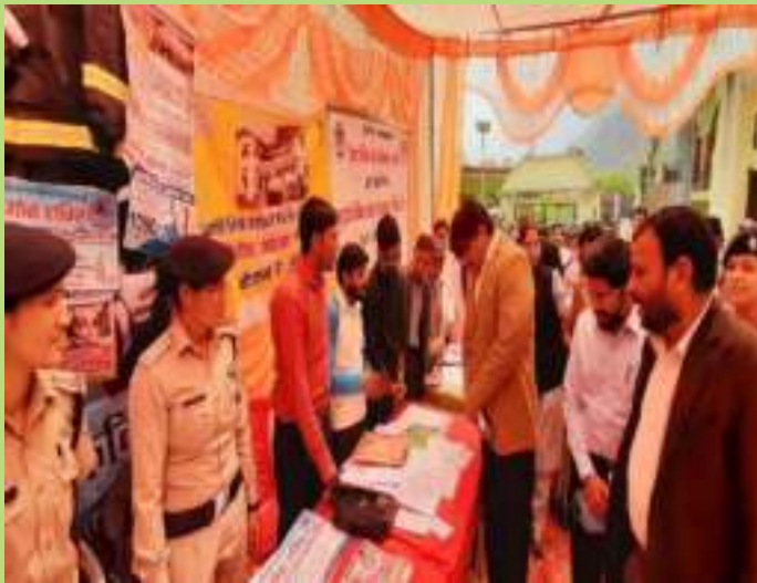
A Legal Awareness-cum-Medical Camp was organized on 11.06.2022 at Malari Gwan Dharmani, Tehsil Joshimath, Chamoli.