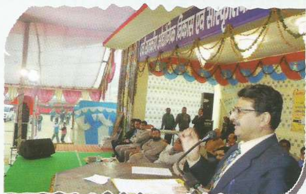
Chairperson, DLSA, Chamoli spreading awareness about legal aid programmes