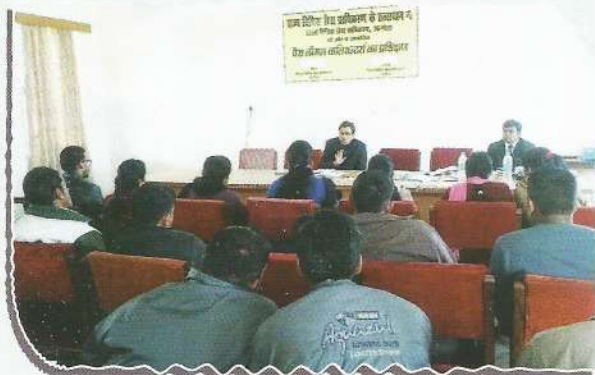
Chairperson, DLSA, Almora interacting with PLVs