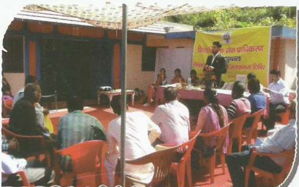
Secretary, DLSA, Pauri during Mental Health Day