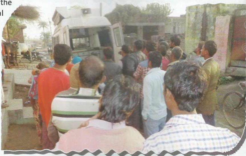
People watching documentary film

In the said camps documentary films on the subjects of mediation, lok adalat and legal aid prepared by National Legal Services Authority and State Legal Services Authority were displayed. The queries raised by the villagers were also resolved on the spot. The applications were also received for legal aid which were either disposed of at the level of State Authority or were sent to the authorities concerned for appropriate and necessary action.