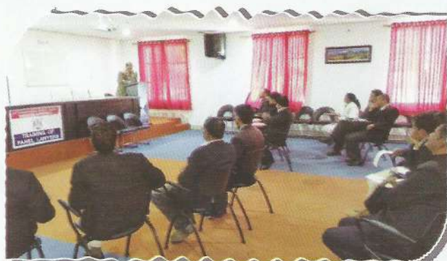
Member Secretary, UKSLSA imparting training to the Panel Lawyers

To enhance the working skills and for ensuring accountability of panel lawyers towards the works assigned to them, the Uttarakhand State Legal Services Authority had conducted training programmes as per the second training module approved by NALSA, in different phases for the districts of Kumaon Region at Nainital. In the said training programmes, total 113 panel lawyers engaged by 06 DLSAs of Kumaon Region have been imparted training by the Member Secretary, Uttarakhand State Legal Services Authority and two Master Trainers (Advocates) who had undergone training at Delhi.