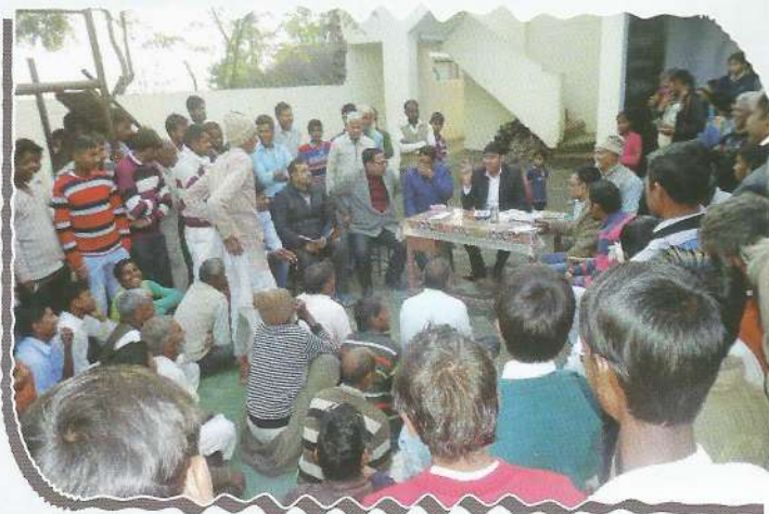
People getting aware about their legal rights