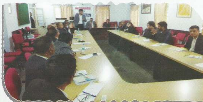
Master Trainer delivering lecture