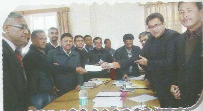
Chairperson, DLSA, Almora during NLA