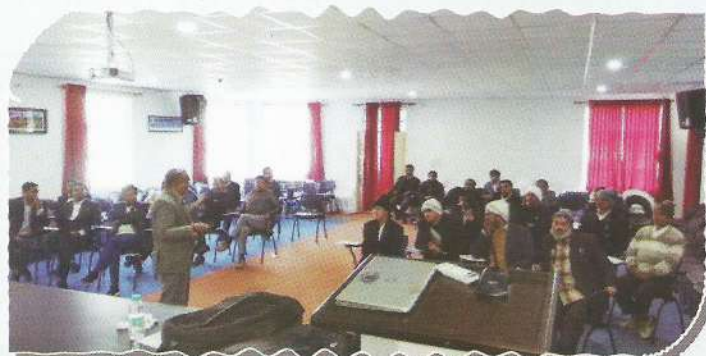
Master Trainer unveiling provisions of Training Module