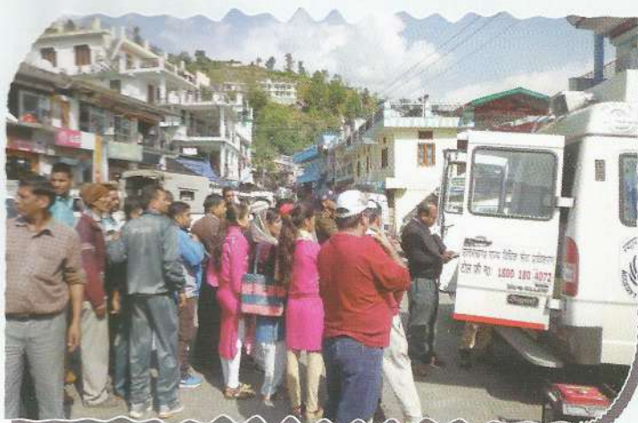
Distribution of legal informative booklets