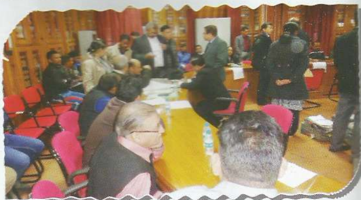
Litigants and Advocates during NLA