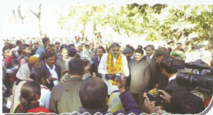
Hon'ble Executive Chairman interacting with common people