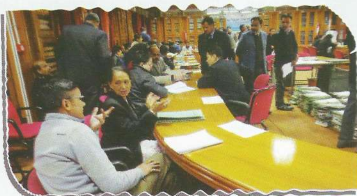
Proceedings of NLA at Hon'ble High Court

In the said National Lok Adalat, total number of 26,766 cases were listed and out of them 5,860 cases were settled amicably. Amount to the tune of Rs. 15,72,39,042/- was also settled.