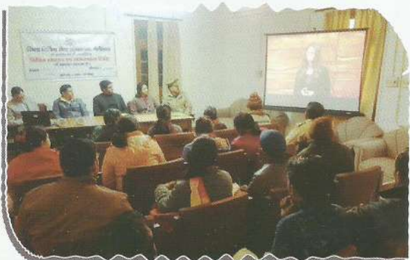
Secretary, DLSA, Nainital during training programme