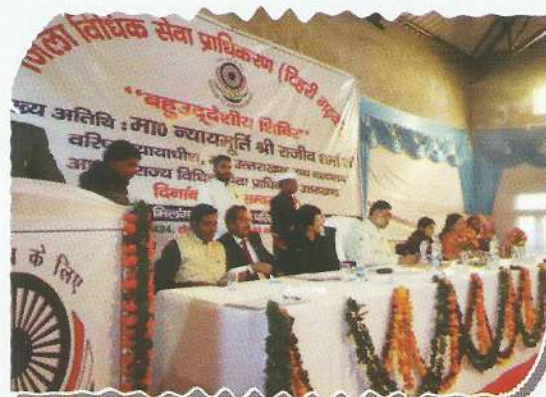
Hon'ble Executive Chairman during Mega Camp at Tehri Garhwal

the Aadhar cards, disability certificate, pension certificates to the Widows and Old age Persons. The medical check-up was done on the spot and medical equipments were also distributed to the needy people. The mega camps are also proposed to be organized in the remaining districts of the State in near future.