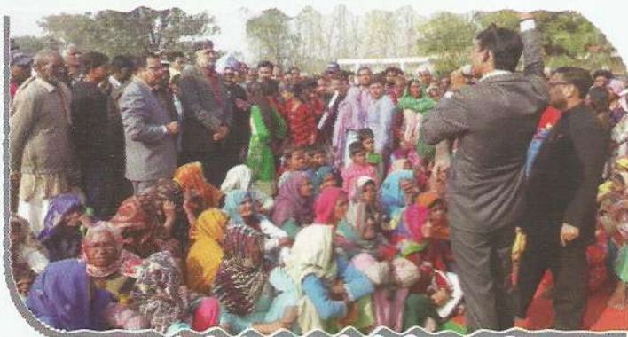
Hon'ble Executive Chairman between the common people