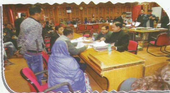
Registrars of the Hon'ble High Court trying amicable settlement