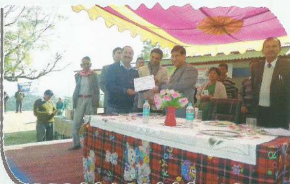
Chairperson, DLSA, Pithoragarh issuing certificate during the mega camp