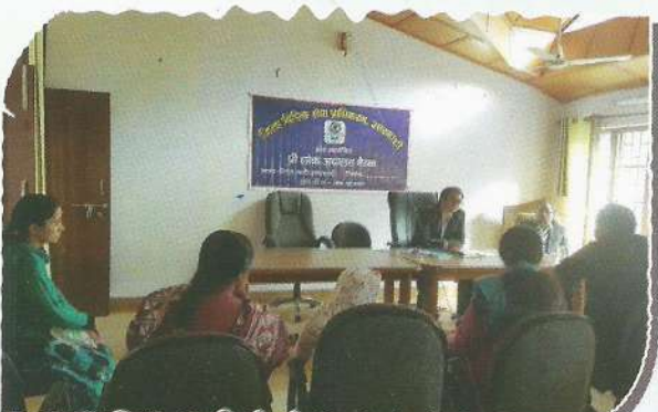
Secretary, DLSA, Uttarkashi holding Pre-Lok Adalat meeting