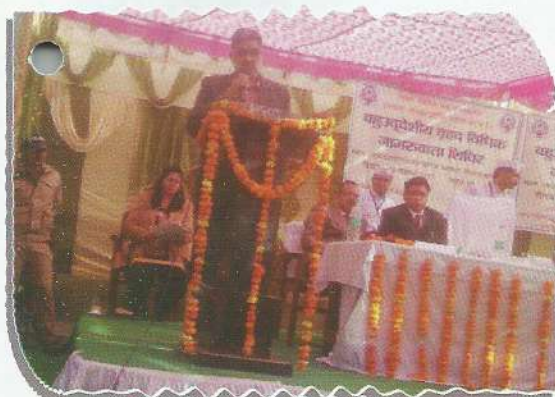
Hon'ble Executive Chairman sensitiizing the common people

the Aadhar cards, disability certificate, pension certificates to the Widows and Old age Persons. The medical check-up was done on the spot and medical equipments were also distributed to the needy people. The mega camps are also proposed to be organized in the remaining districts of the State in near future.