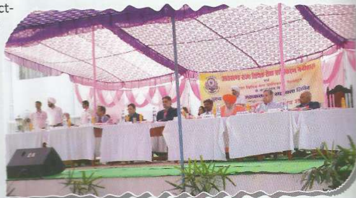
Hon'ble Executive Chairman, UKSLSA during Mega Camp at Dehradun

In order to propagate legal awareness among the common people about their legal rights, Government welfare schemes available to them and the legal activities being run by the legal services institutions, the Uttarakhand State Legal Services Authority first identified common places in District-Almora (Manila), District-Bageshwar (Pharsali), District-Chamoli (Kulsari), District-Dehradun (Rishikesh), District-Haridwar (Niranjanpur), District-Tehri Garhwal (Ghansali) and District-Udham Singh Nagar (Mohammadpur Bhudiya) and then organized Mega Legal Literacy and Awareness Camps thereon in coordination with more than 30 Government Departments. These camps were presided by the Hon'ble Executive Chairman, Uttarakhand SLSA and various authorities from different department sensitized the common people about their legal rights and also redressed their grievances at the spot. In these mega camps, District Administration also issued