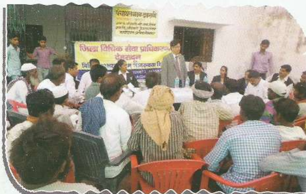
Secretary, DLSA, Dehradun during awareness camp