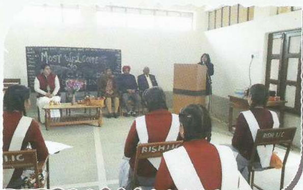
Secretary, DLSA, Haridwar making students aware about child rights