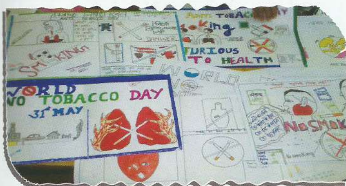
Celebration of Anti Tobacco Day by the students

Between the months of April, 2017 to June, 2017, the Labour Day, Anti Tobacco Day, Environment Day, World Day against Child Labour and International Day against Drug Abuse and Illicit Trafficking were observed throughout the State. During these occasions, 205 special legal literacy and awareness camps were organized wherein 13826 people got benefited.