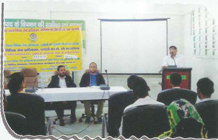
Secretary, DLSA, Chamoli sensitizing the gathering about Labour laws