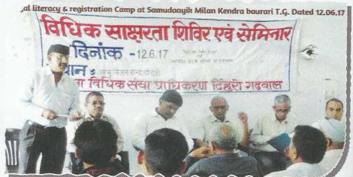
Secretary, DLSA, Tehri Garhwal during World Day against Child Labour

Apart from above, by organizing legal awareness camps, programmes, seminars etc. throughout the State on regular basis, the various Government welfare schemes were given wide publicity under the purview of ten schemes made by NALSA for proper implementation.