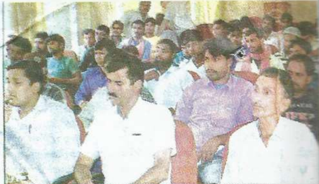
श्रीनगर में कानूनी जागरूकता शिविर में मौजूद अधिवक्ता एवं मजदूर।