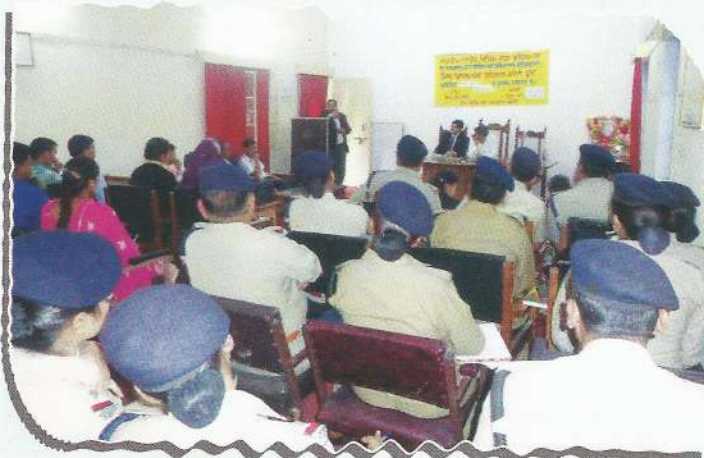
Refresher training programme of CWC