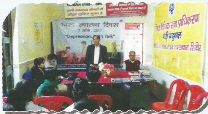
Special camp on World Health Day at Pauri Garhwal