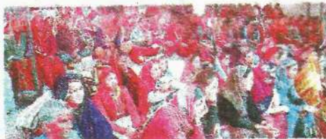
मण्डल में आयोजित महिला सम्मेलन में उपस्थित महिलाएं • जगदहन