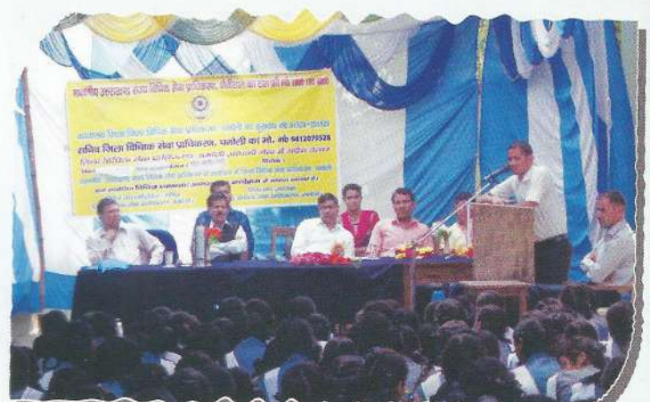
Sensitization camp on child rights at GIC Sabarisein, District-Chamoli