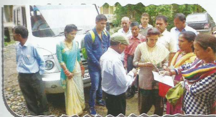
People showing interest during mobile van awareness