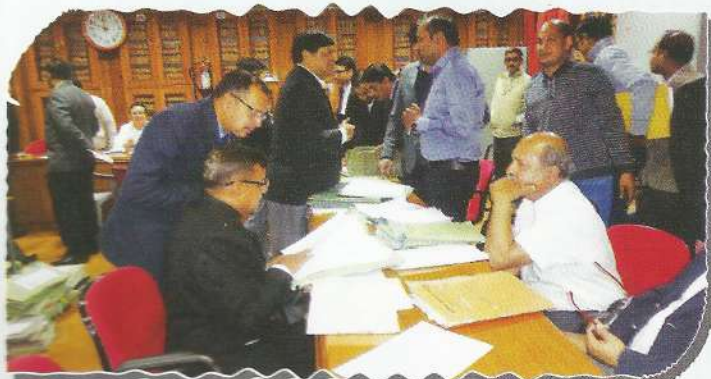
Proceedings of National Lok Adalat