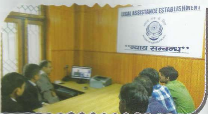
Video conference session at LAE