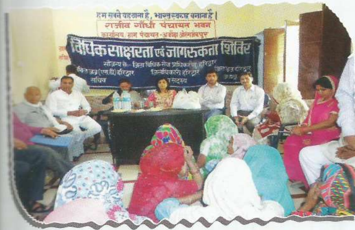
Secretary, DLSA, Haridwar sensitizing the people