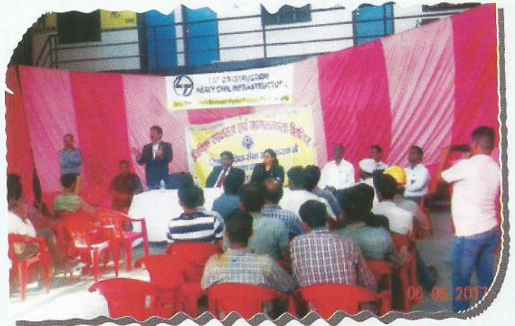
Legal awareness camp on labour rights at Rudraprayag