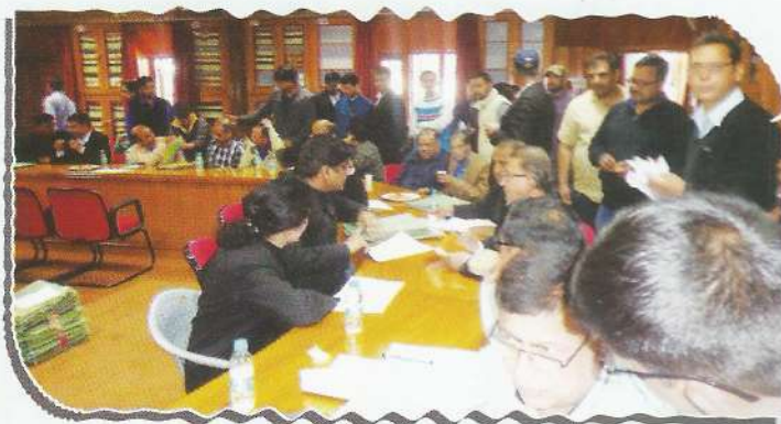
Advocates and litigants during NLA