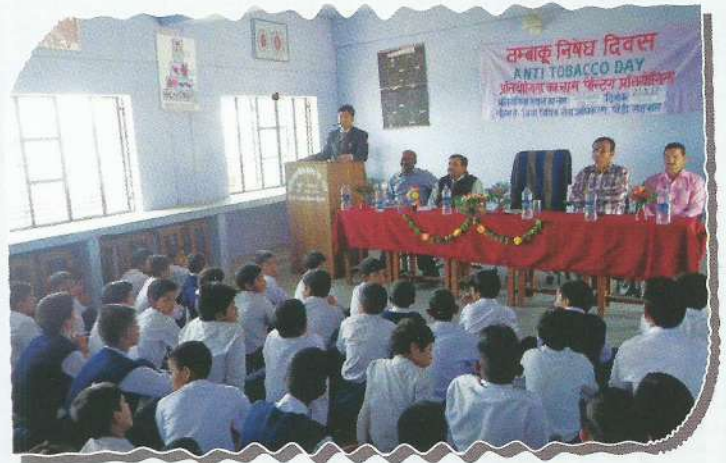
Awareness camp on Anti Tobacco Day at Pauri Garhwal