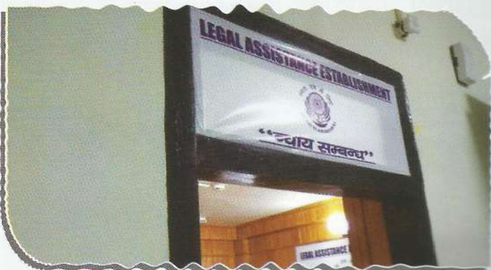
Legal Assistance Establishment 'Nyay Sambandh' Centre

In order to provide information about status of cases pending in different Courts and to extend necessary legal aid and assistance to the needy persons, the Legal Assistance Establishment has been established in the premises of Uttarakhand State Legal Services Authority with facility of video conference. On the occasion of the inauguration of Legal Assistance Establishment, video conference sessions were also held between the Member Secretary, UKSLSA, Advocates, Jail Authorities and the prisoners detained in the jails so as to know as to whether the prisoners are being represented by the legal aid counsels and they are getting the necessary legal aid/advice. The response received from Jail Authorities and prisoners was satisfactory.