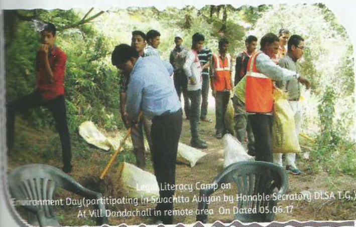
Legal Literacy Camp on Environment Day (participating in Swachhta Aaiyan by Honable Secretary DLSA T.G.) At Vill Dandachall in remote area. On Dated 05.06.17