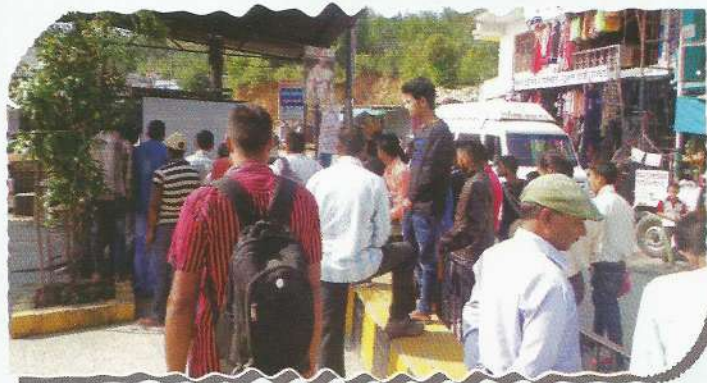
Public watching documentary film