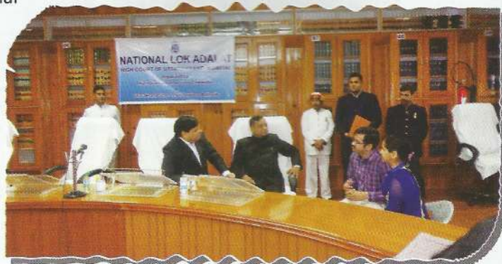
Hon'ble Mr. Justice Sudhansu Dhulia (Left) & Hon'ble Mr. Justice Servesh Kumar Gupta (Right) interacting with parties

A total number of 11685 cases were taken up in the National Lok Adalat. Out of the said cases, 1436 cases were disposed of through amicable settlement. Amount to the tune of ₹5,68,96,166/- was also settled.