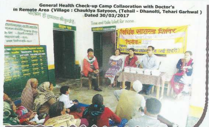
General Health Check-up Camp Collaboration with Doctor's in Remote Area (Village : Chaukiya Satyoon, (Tehsil - Dhanolti, Tehari Garhwal ) Dated 30/03/2017