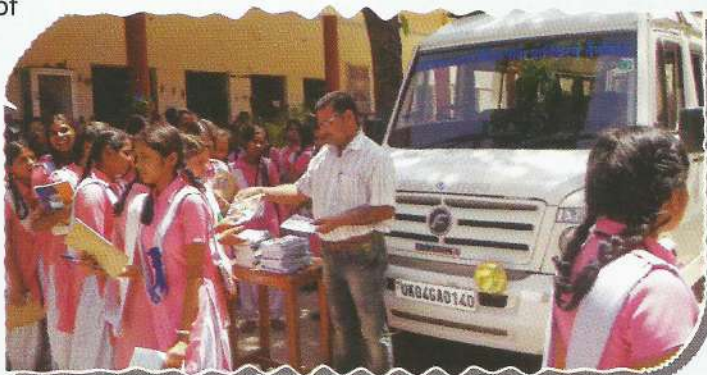
Students getting legal informative booklets

In the said camps documentary films on the subjects of mediation, lok adalat and legal aid prepared by National Legal Services Authority and State Legal Services Authority were displayed. The queries raised by the villagers were also resolved on the spot. The applications were also received for legal aid which were either disposed of at the level of State Authority or were sent to the authorities concerned for appropriate and necessary action. Also, a Mobile Lok Adalat was conducted in district-Dehradun wherein 31 cases were taken up.