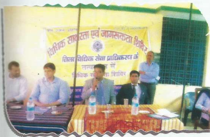
Secretary, DLSA, Rudraprayag sensitizing on poverty alleviation