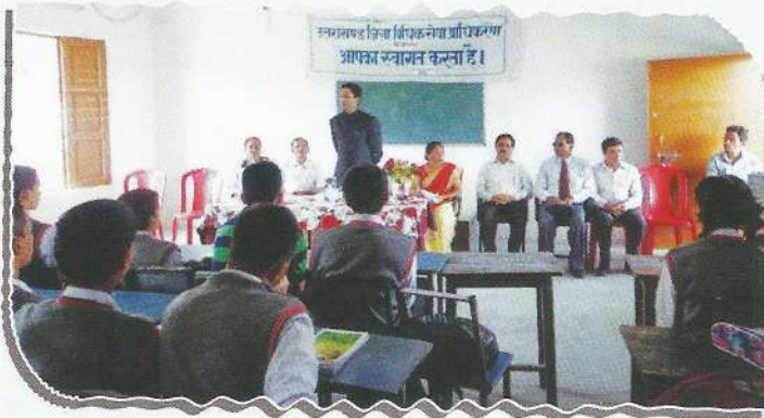
Sensitization camp on the occasion of Environment Day at Pithoragarh