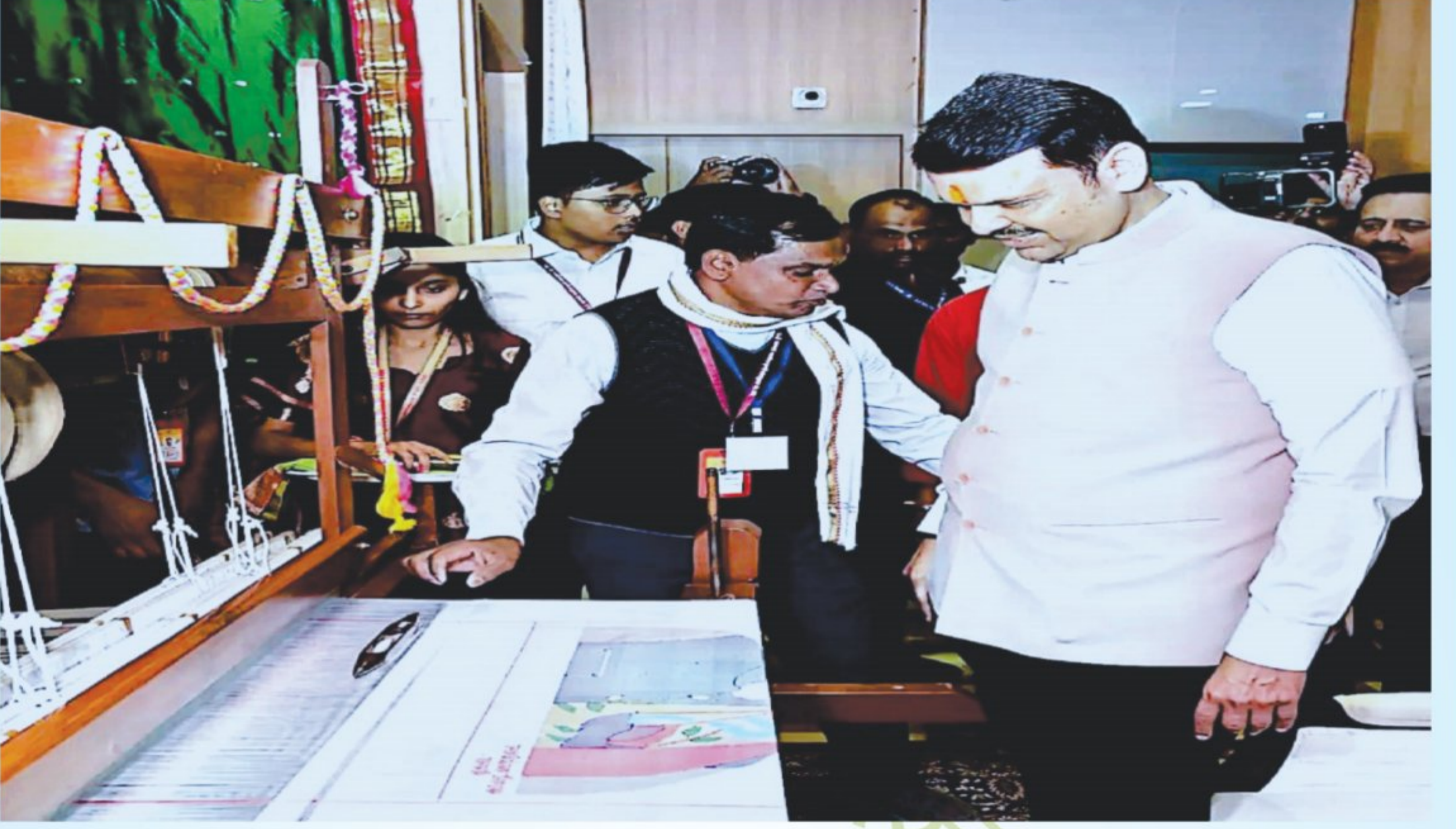
मा. ना.श्री. देवेन्द्र फडणवीस मुख्यमंत्री महाराष्ट्र राज्य यांची कापसे पैठणी येवला नाशीक येथे रेशीम पैठणी व्यवसायास भेट