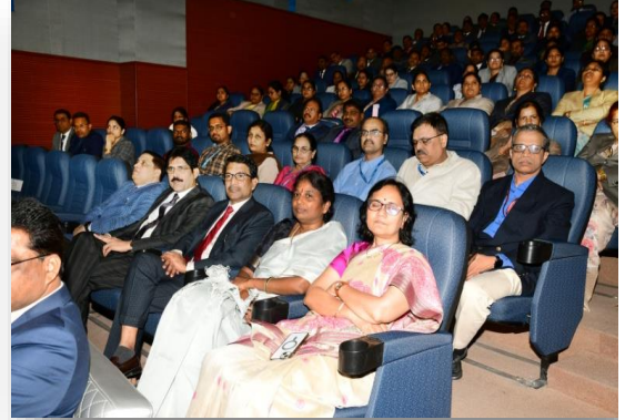
कार्यक्रम में एनआईसी के अधिकारीगण