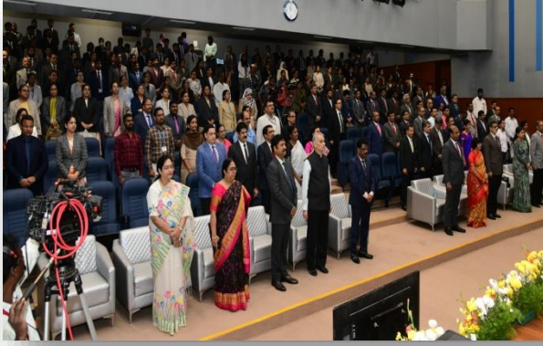
दर्शकों में एनआईसी टीम के साथ न्यायिक बिरादरी