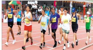
नवभारत व्यूरो। रायपुर।

अखिल भारतीय वन खेलकूद प्रतियोगिता में 71 पदक जीतकर छत्तीसगढ़ पहले स्थान पर