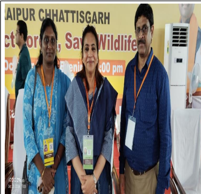
एनआईसी टीम के साथ-साथ नियंत्रण केंद्र के सहायक टीम के सदस्य