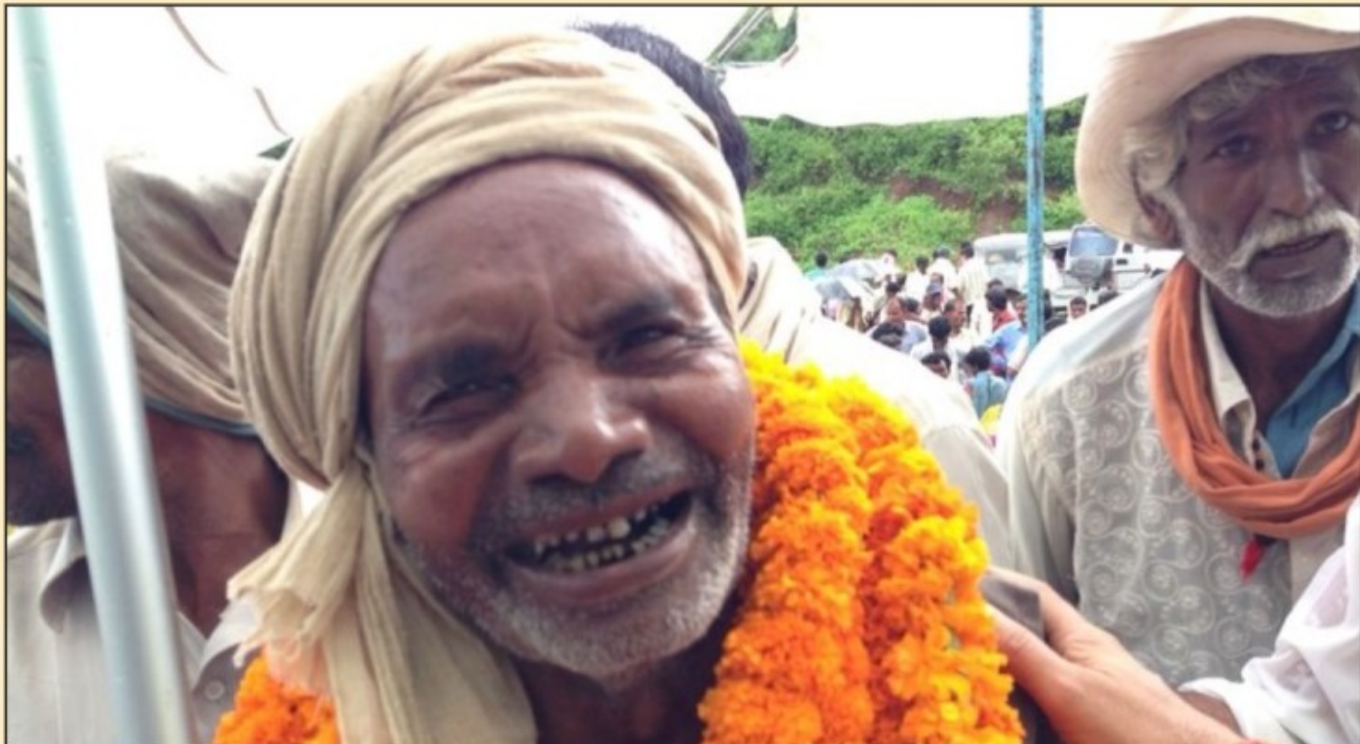
A beneficiary in the Mega Literacy & Awareness Programme, Rewa