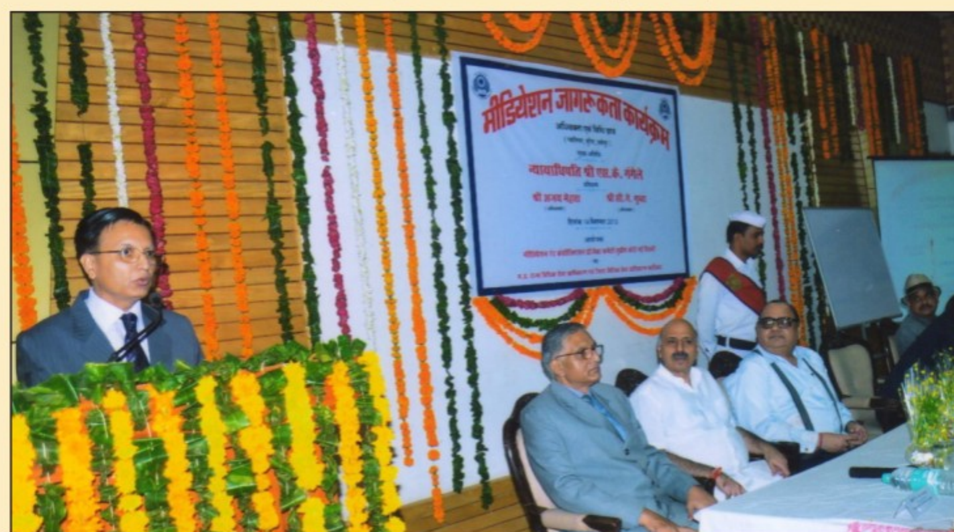
Hon'ble Shri Justice S.K. Gangele, Judge, M.P. High Court and co-chairman, HCLSC Bench, Gwalior enlightening the gathering, Mediation Awareness Programme, Gwalior

"An ounce of mediation is worth a pound of arbitration and a ton of litigation!" Joseph Grynbaum