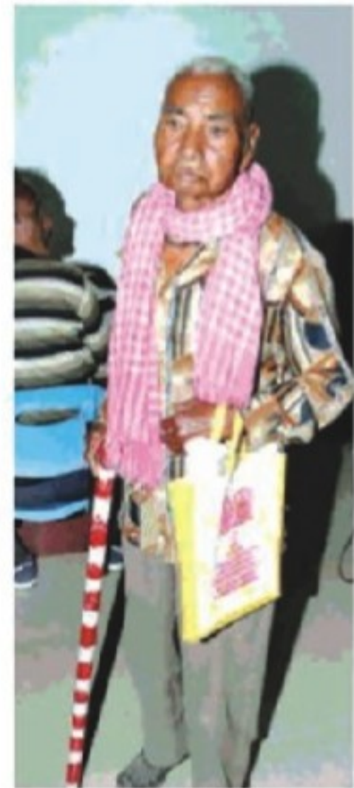
जगर निगम के महा जेन में पदम प्रहारा

नगर निगम में 1140 करदाताओं के टैक्स संबंधी मामलों का निपटारा किया गया। निगम मुख्यालय और 13 क्षेत्रीय कार्यालयों में करदाताओं ने 90 लाख से अधिक जमा किए। निगमावृत्त वेस्टका ने बताया कि लोक अदालत में सम्पत्ति कर के 821, जलकर के 117, धन्य नामांतरण के 70, कर आपत्ति के 80, नल कनेक्शन के दो और अन्य सुविधाओं के 50 मामले सुलझाए गए। करदाताओं को अधिपार से छूट का लाभ भी दिया गया।