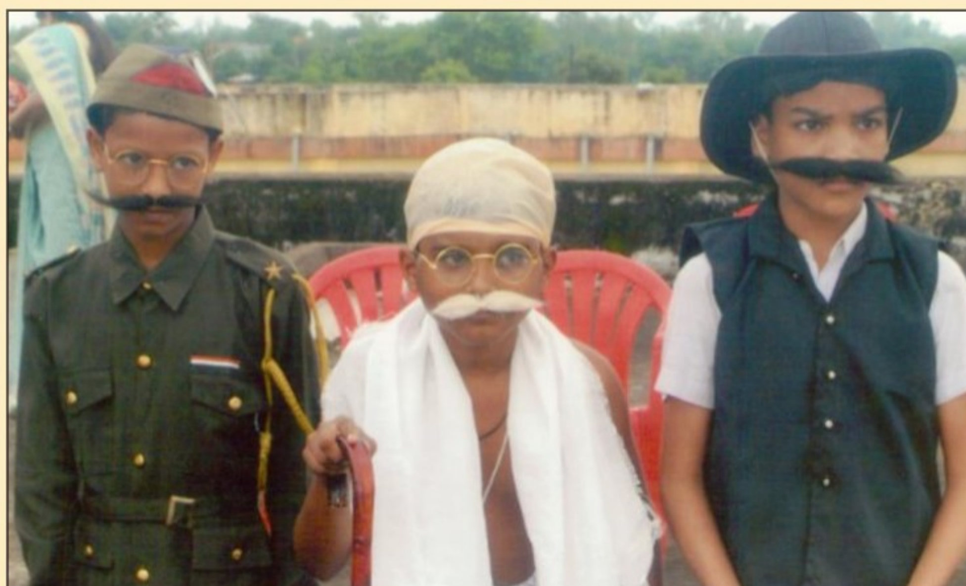
Children in need of care and Protection enacting a role play of our Venerable Leaders, Balghar, Gokulpur, Jabalpur