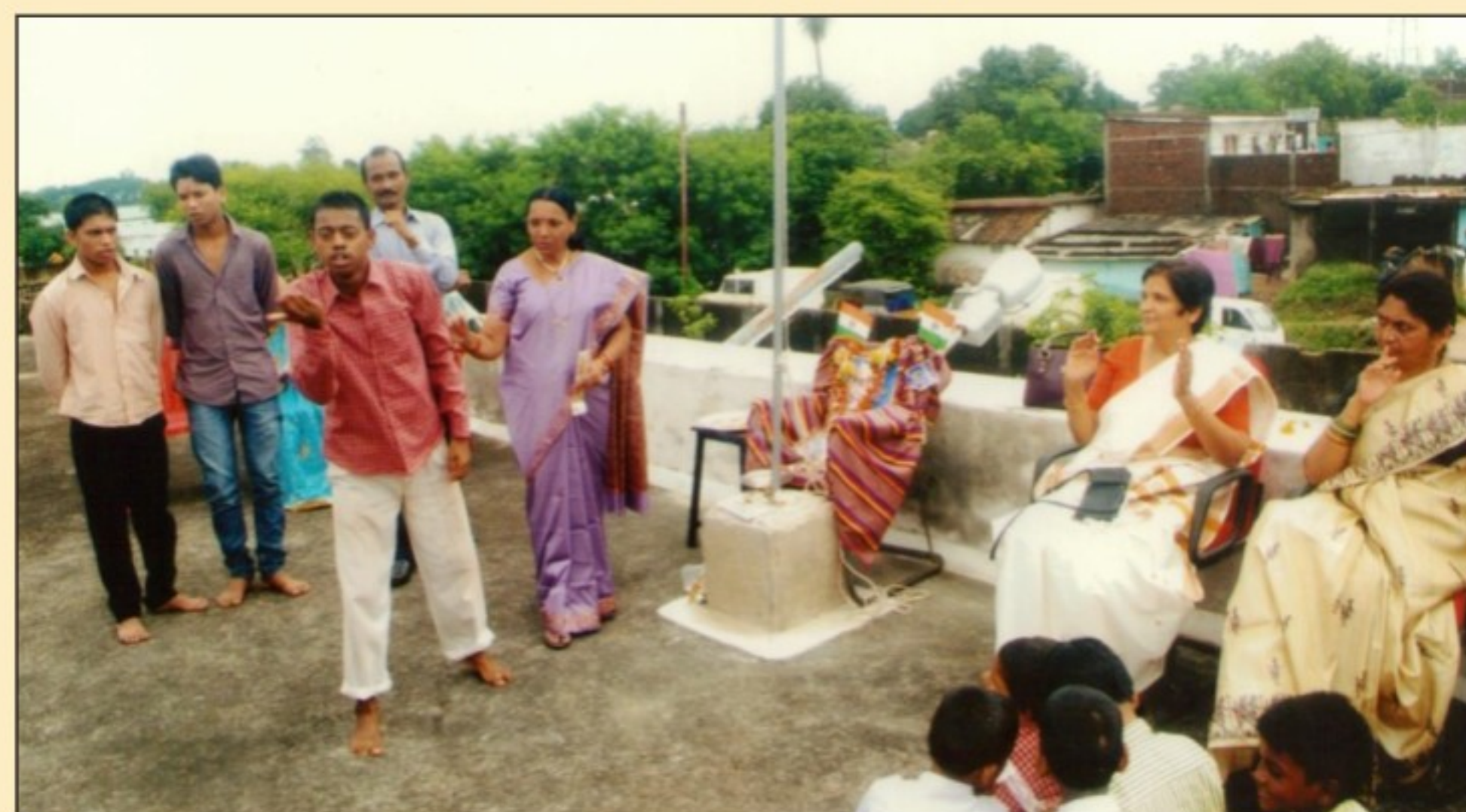
Celebrating Republic day with the Children at 'Balghar', Jabalpur.

If a child lives with encouragement he learns to be confident!