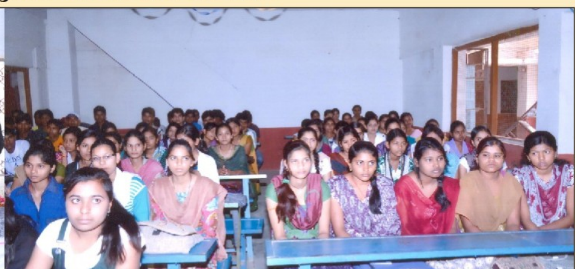
जिला विधिक सेवा प्राधिकरण पन्ना द्वारा आयोजित जागरूकता शिविर -नारी शक्ति