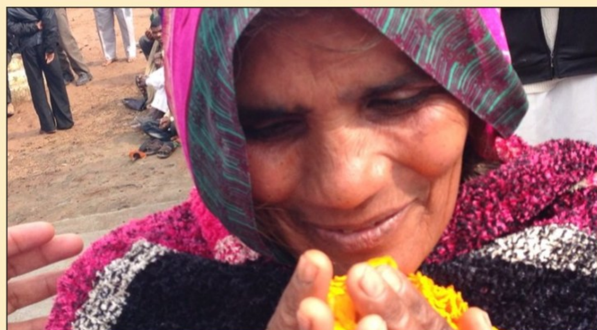
A Beneficiary in one of the Legal Aid Camps