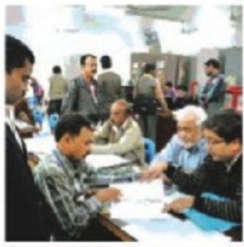
1,140 टैक्स मामले सुलझे

नगर निगम में 1140 करदाताओं के टैक्स संबंधी मामलों का निपटारा किया गया। निगम मुख्यालय और 13 क्षेत्रीय कार्यालयों में करदाताओं ने 90 लाख से अधिक जमा किए। निगमावृत्त वेस्टका ने बताया कि लोक अदालत में सम्पत्ति कर के 821, जलकर के 117, धन्य नामांतरण के 70, कर आपत्ति के 80, नल कनेक्शन के दो और अन्य सुविधाओं के 50 मामले सुलझाए गए। करदाताओं को अधिपार से छूट का लाभ भी दिया गया।