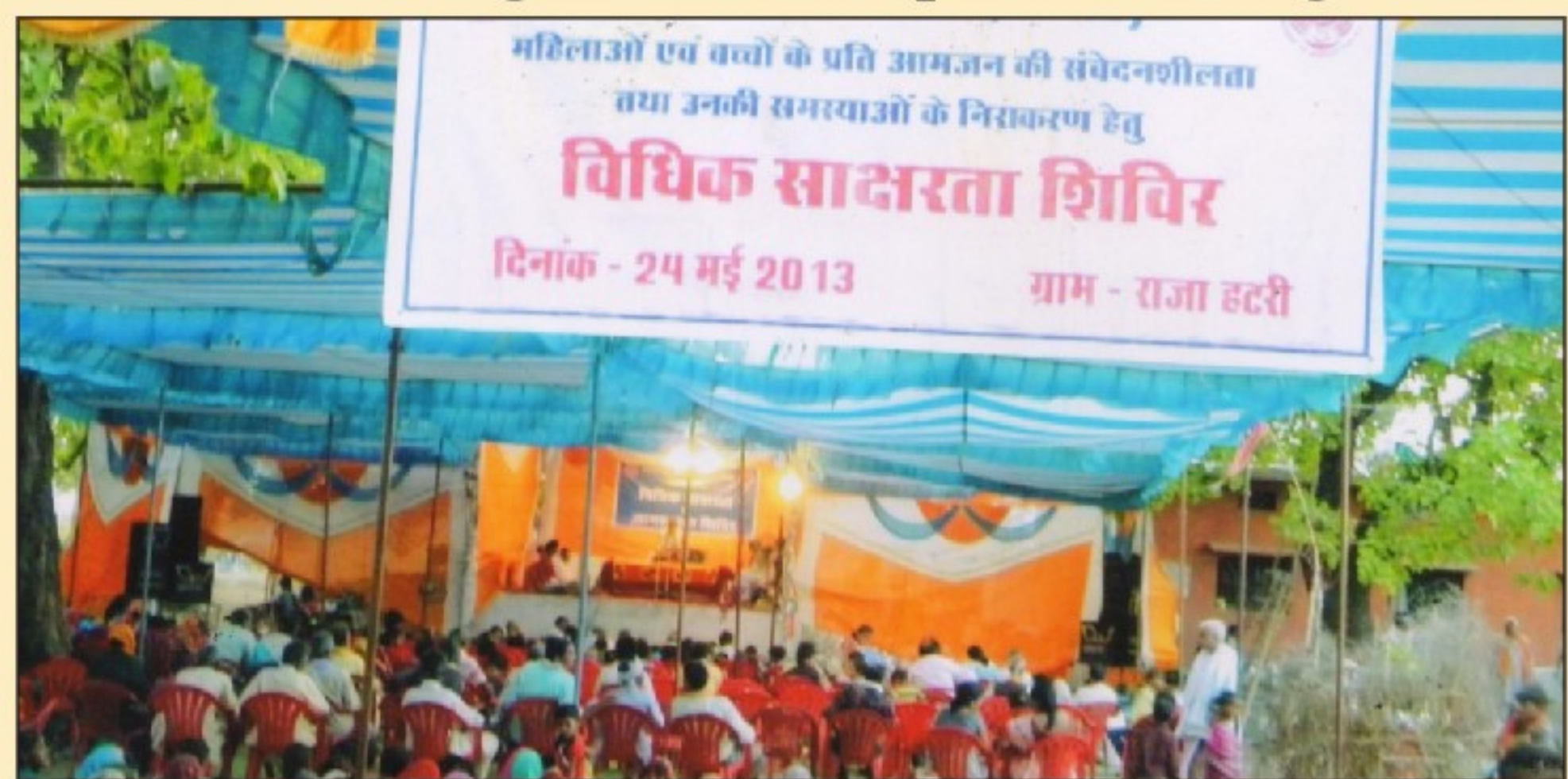
Legal Literacy and Awareness Camp at District Damoh in all its magnitude and splendor!

जन-जन की यही पुकार-सुलभ न्याय हमारा अधिकार