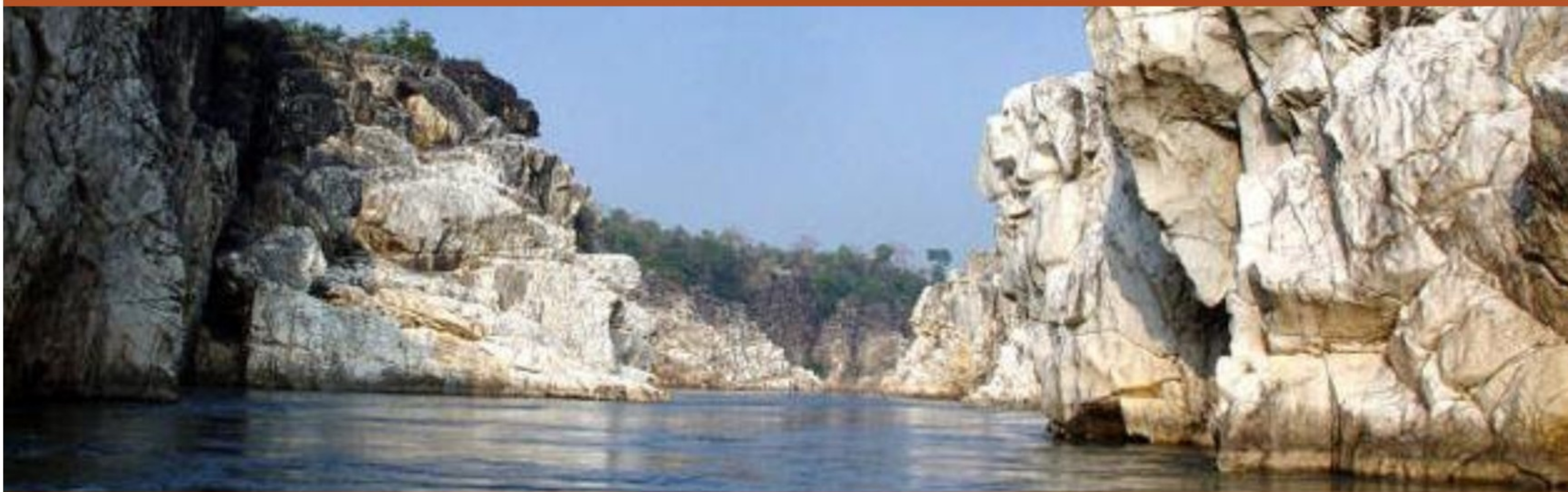
Serenity, Sanctity and Sagacity-----River Narmada flowing between the Marble Rocks, Bhedaghat, Jabalpur