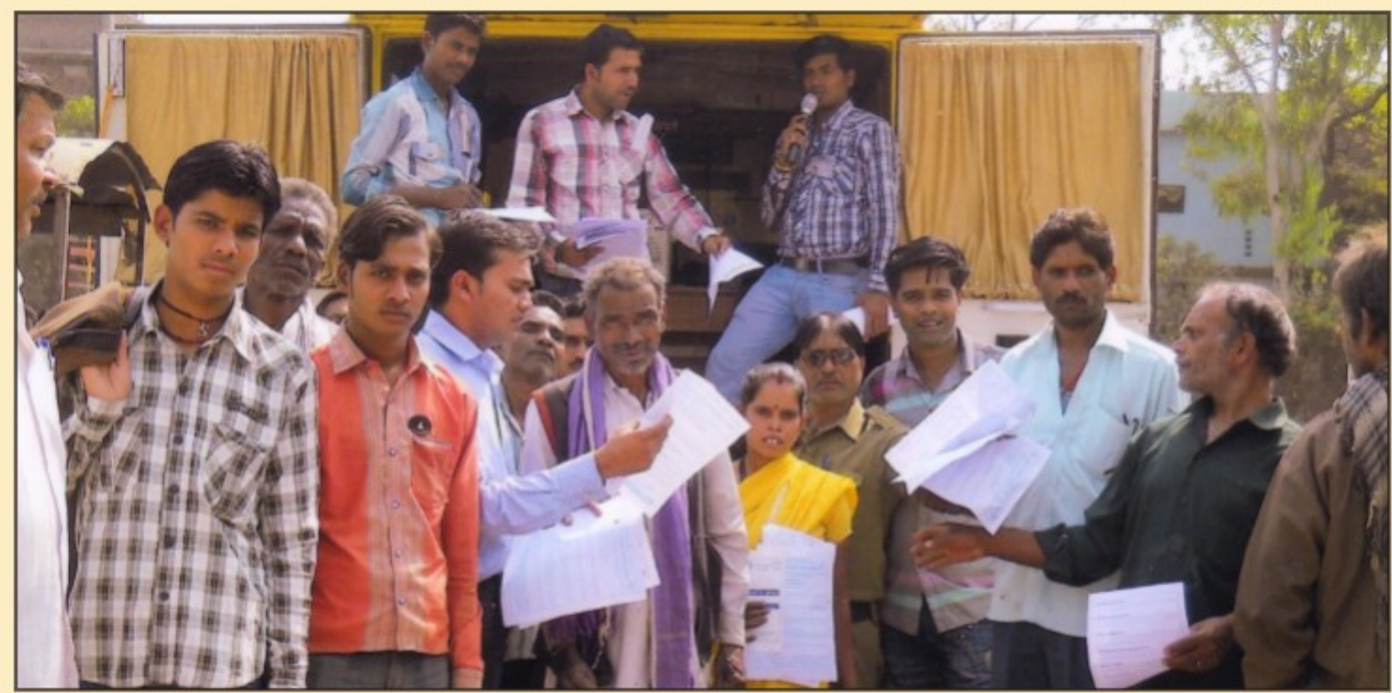
सचल विधिक सेवा वाहन द्वारा विधिक ज्ञान का प्रचार-प्रसार

Keep listening, you are bound to understand!