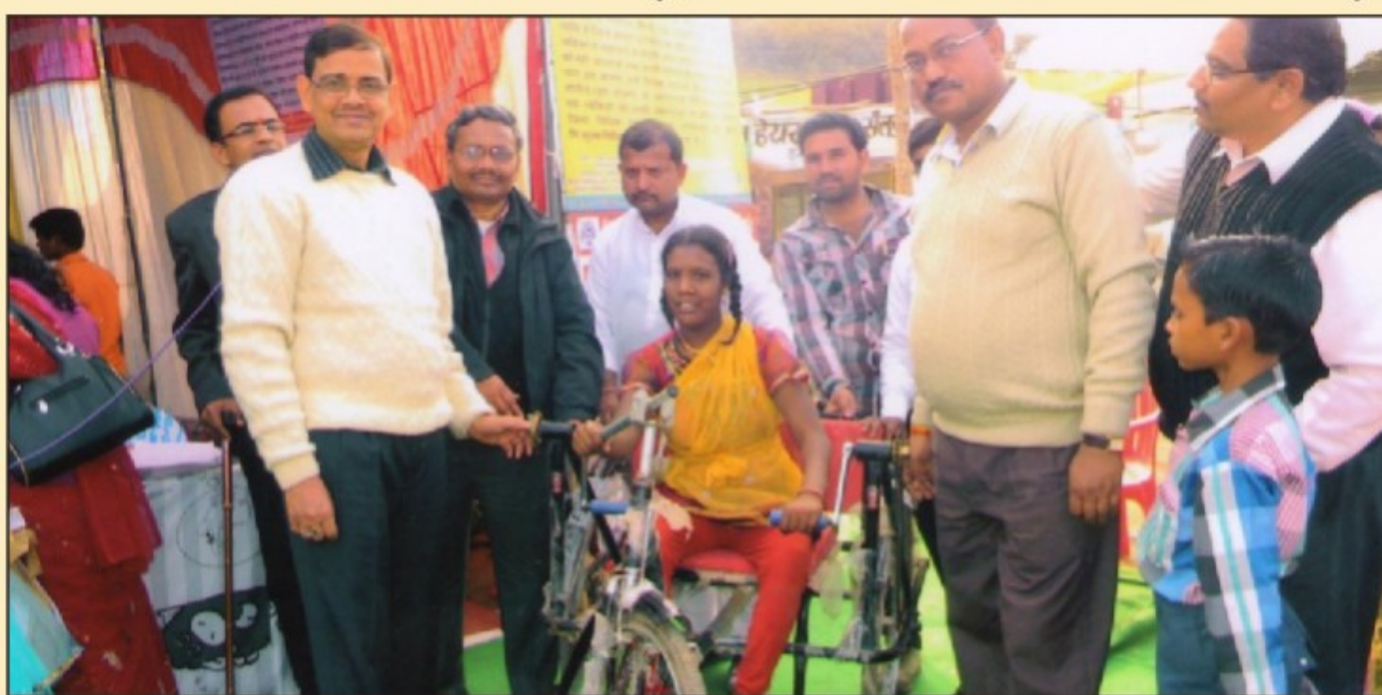
AMAZING GRACE- Translating Disability into Ability; handing over a Tri-Cycle to a handicapped girl, Legal Aid Camp, Barman, Narsinghpur