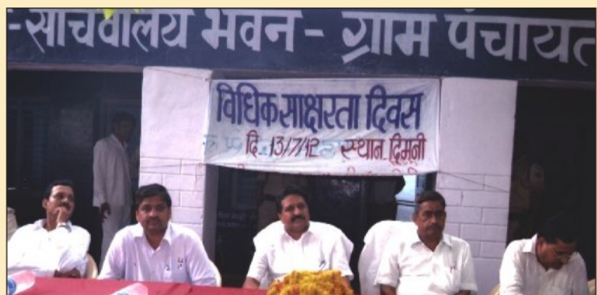
Legal Aid Camp District Morena

I don't have a dis-ability, I have a different-ability