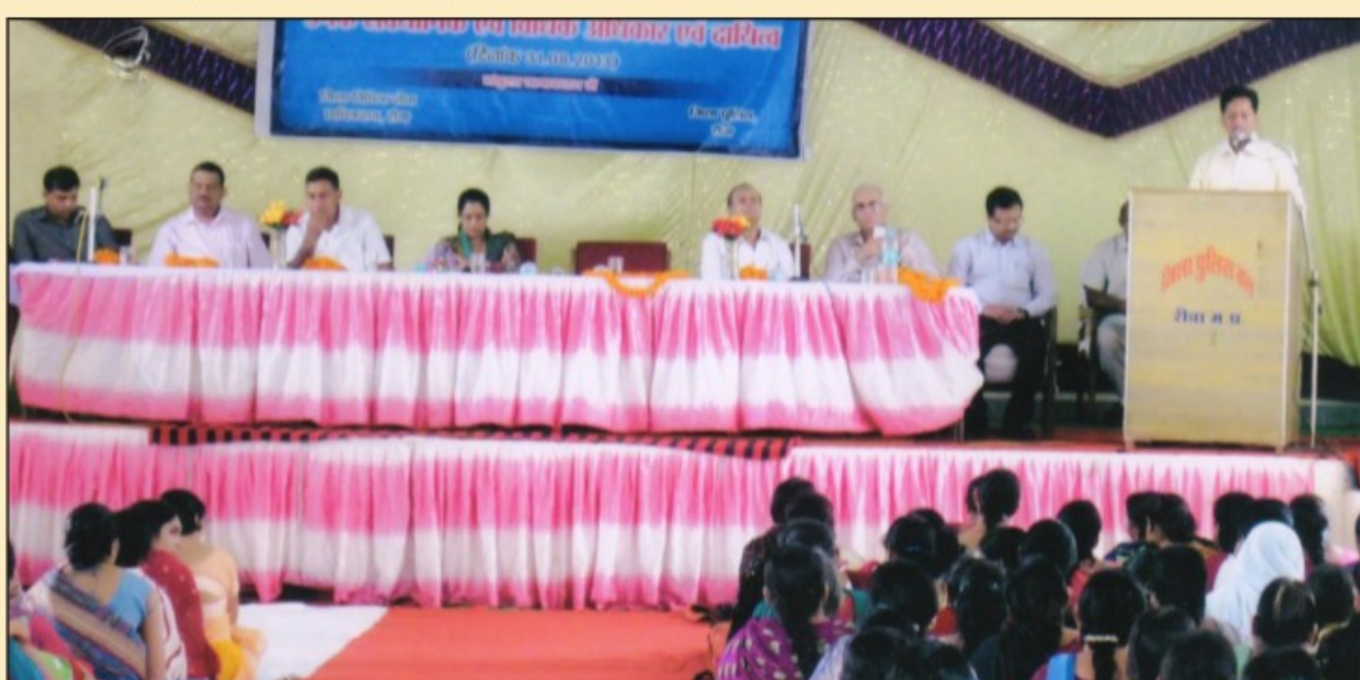
Workshop in collaboration with IG Police (Women Cell) & DLSA Rewa, Police Community Hall, District, Rewa

I don't have a dis-ability, I have a different-ability