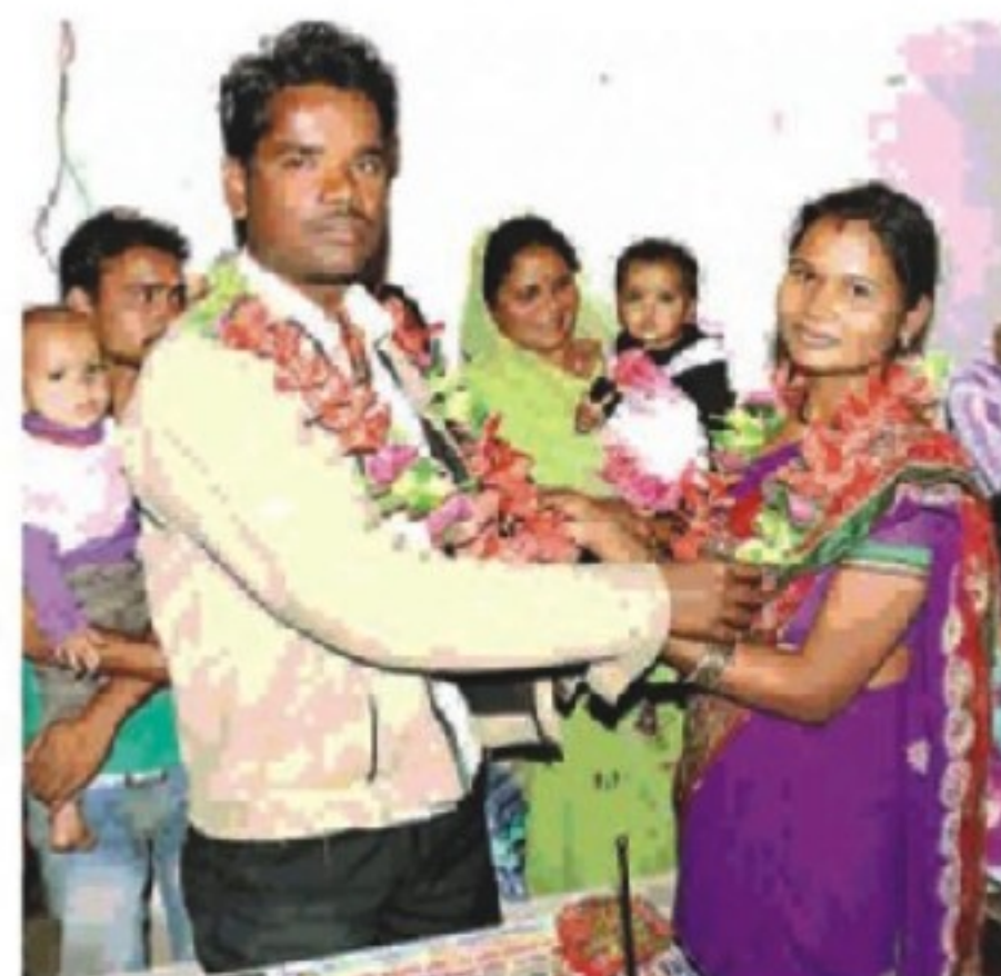
परिवार परामर्श केंद्र में आयोजित मेगा लोक अदालत में एक-दूजे के दमकला पटवर्ध और खुशी-खुशी रवाना हुए।

परिवार परामर्श केंद्र में आयोजित मेगा लोक अदालत में हुआ समझौता, 300 मामलों की हुई सुनवाई