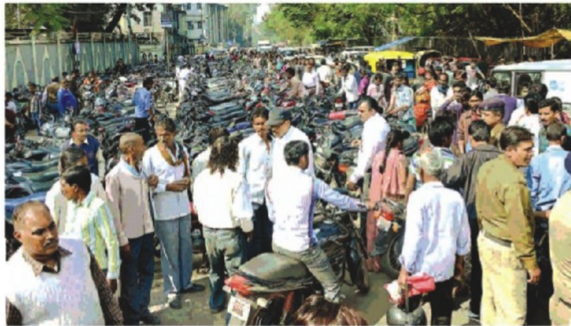
जिला अदालत में उमड़े प्रकरणों के कारण रविवार को भी ठहरा।

सि होय सं आ एक मामले में पति-पत्नी का रिश्ता सख्त के चलते टूटने के कगार पर पहुंच गया था। पत्नी को शिक्का न था कि शराबी के अठ साल बाद भी पति उसका खयाल नहीं रखता। वह हर वकत शराब के नशे में रहता है। इससे परेशान पत्नी दो साल से मायके में रह रही थी। समझौते के तहत पति ने शराब छोड़ने की कसम ली और पत्नी को बरमाला पहनकर साथ ले गया।