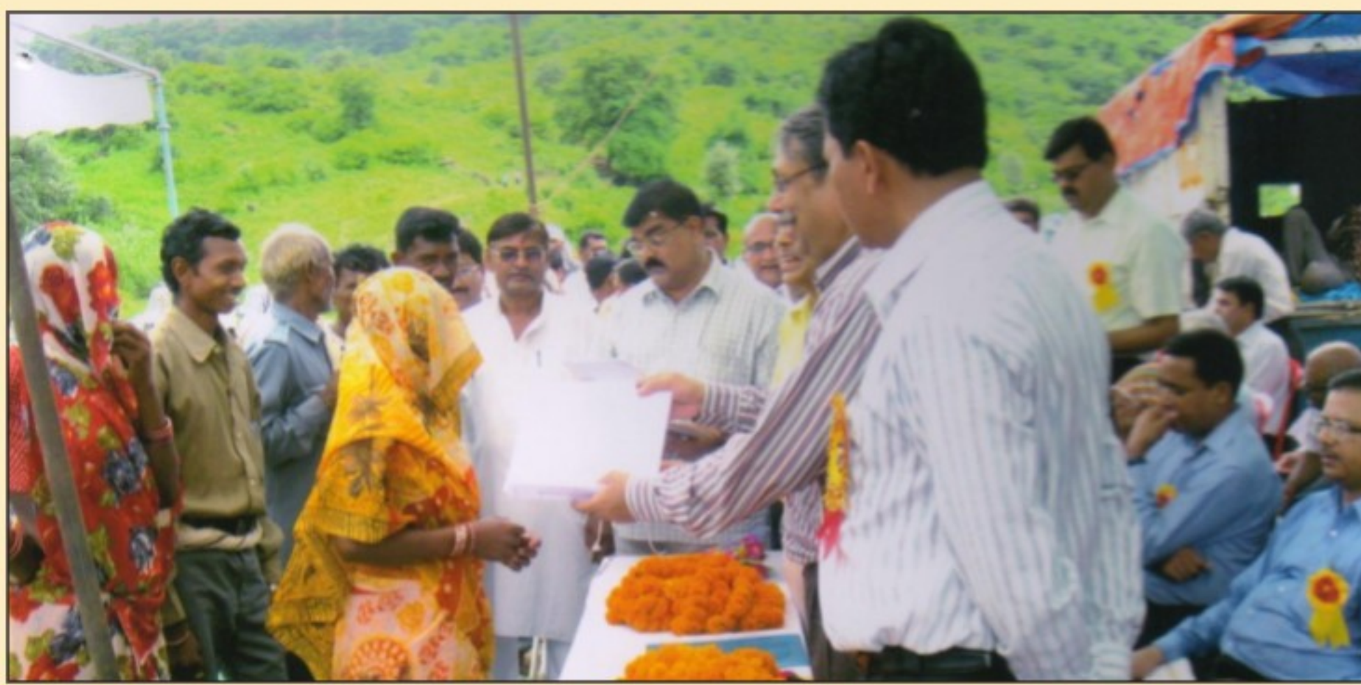
District Rewa again - A Legal Literacy Camp where the beneficiaries were village folk awaiting redressal of their grievances

Keep listening, you are bound to understand!