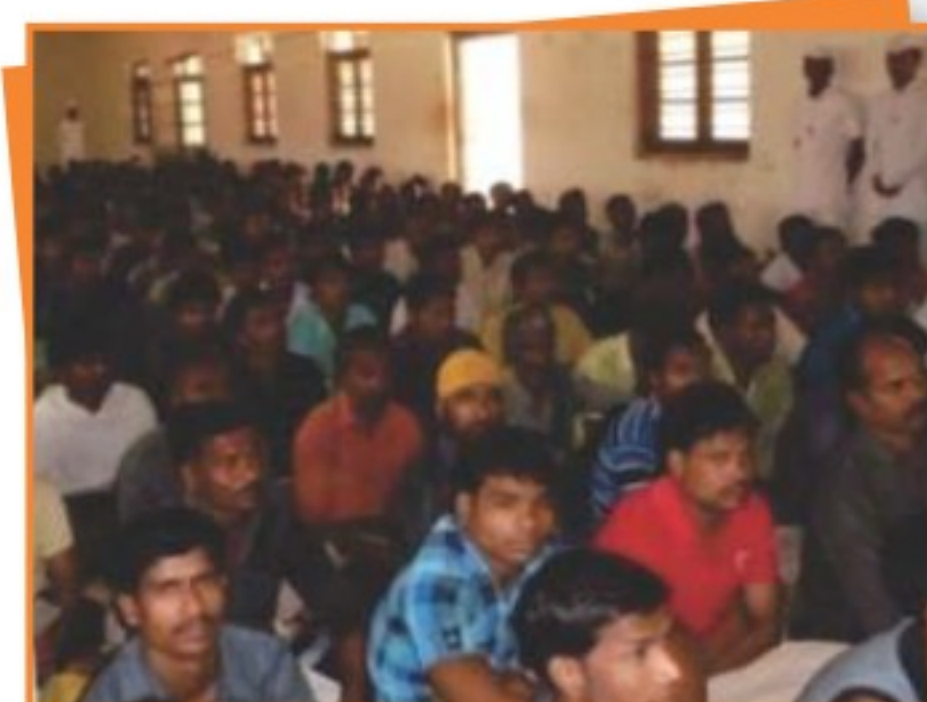
जिला जेल छिंदवाड़ा में बंदियों के अधिकारों के संरक्षण हेतु आयोजित विधिक साक्षरता शिविर