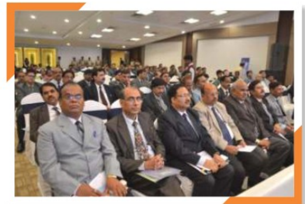
Guests and Participants from the Indore Zone