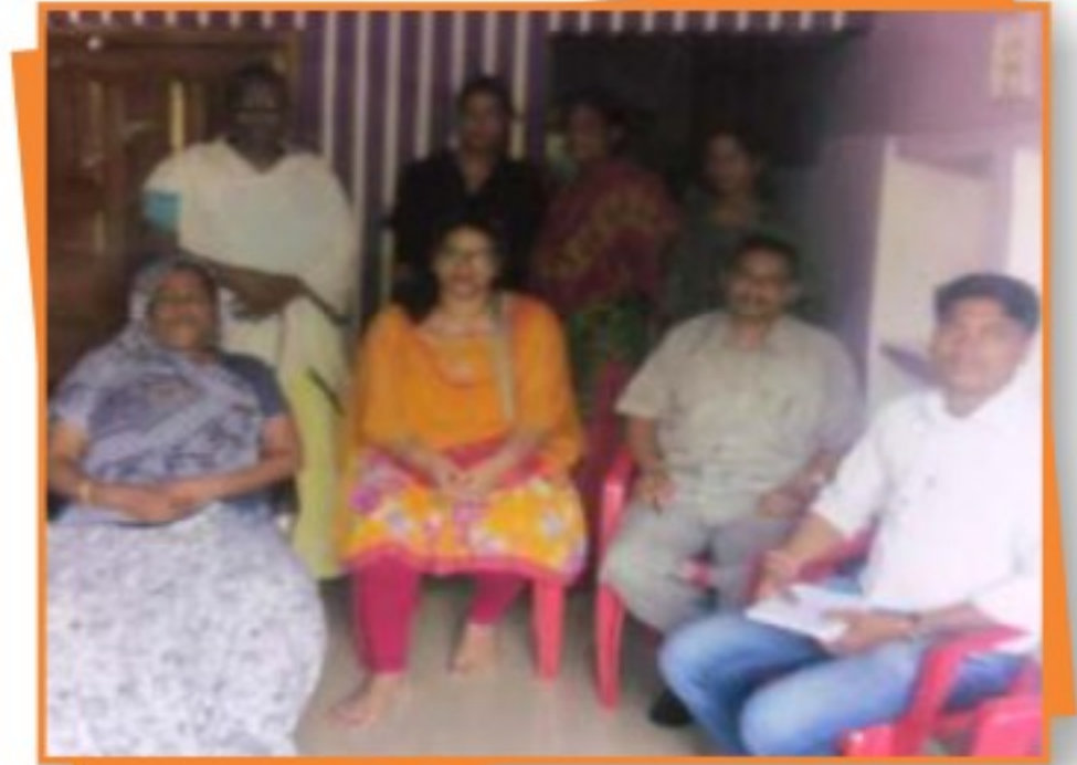
डिण्डौरी जिले में किन्नर समुदाय के कल्याणार्थ आयोजित शिविर