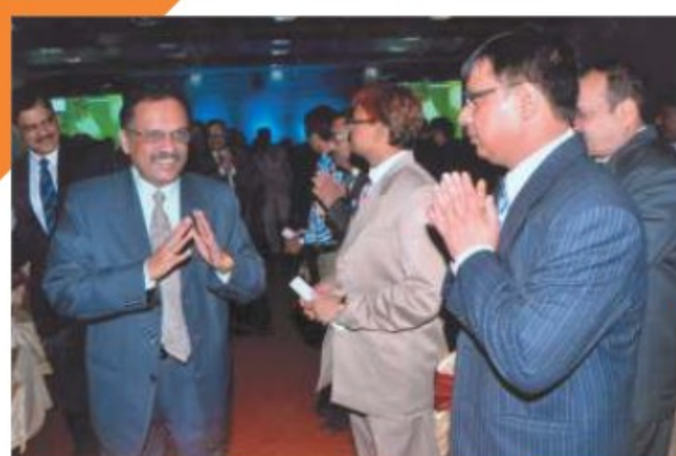
Guests and Participants from the Indore Zone