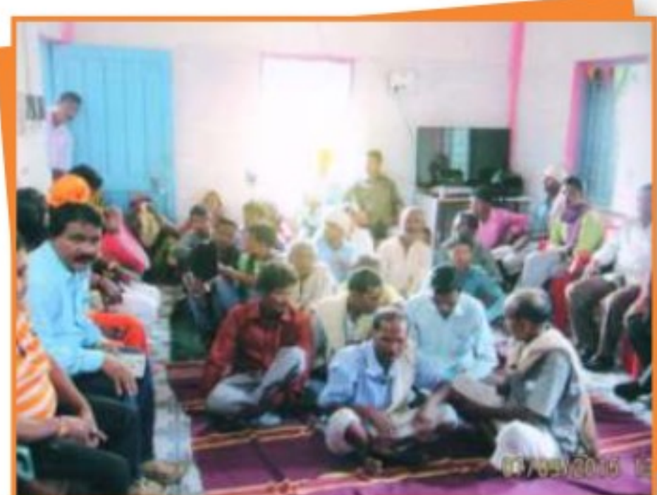
जिला मण्डला में आयोजित मोबाइल लोक अदालत में प्रकरणों का निराकरण करते हुये न्यायाधीश।