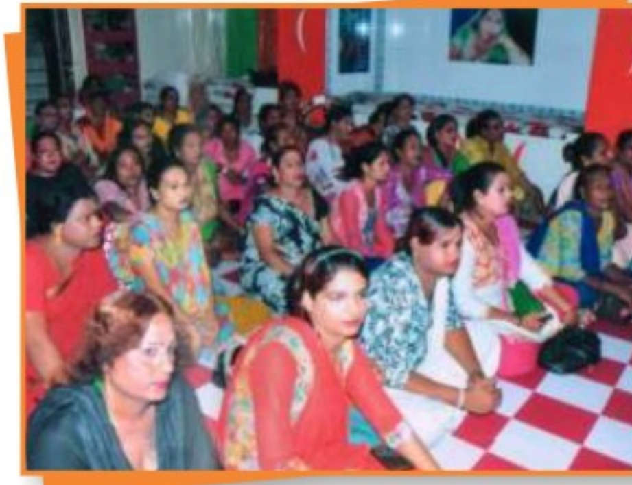
भोपाल जिले में किन्नर समुदाय के कल्याणार्थ आयोजित शिविर।