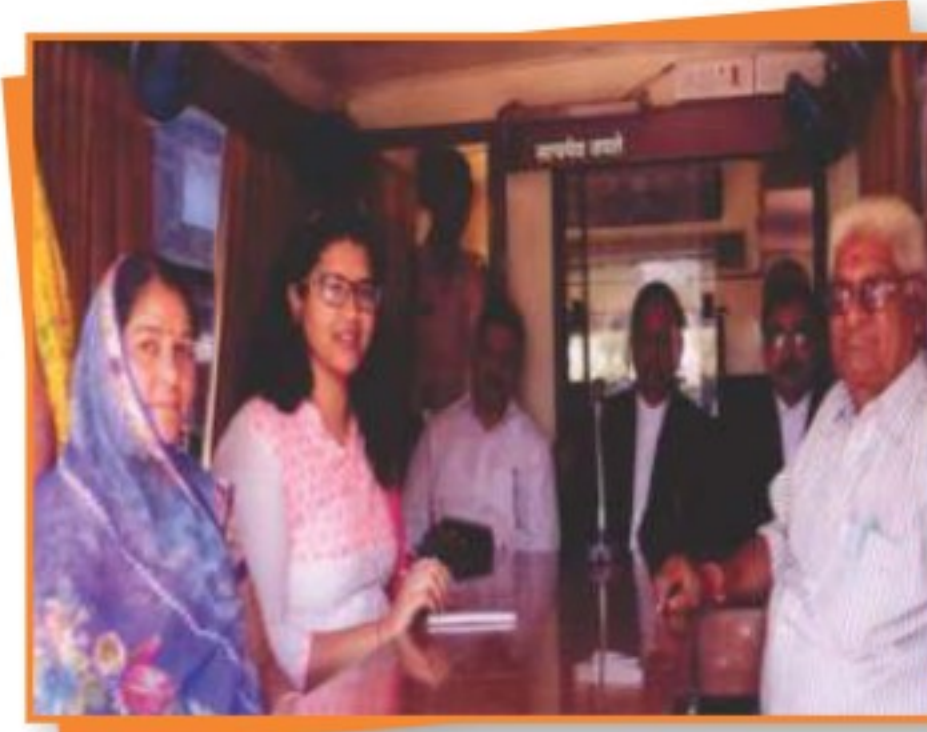
डिण्डौरी जिले में आयोजित मोबाइल लोक अदालत एवं विधिक साक्षरता शिविर