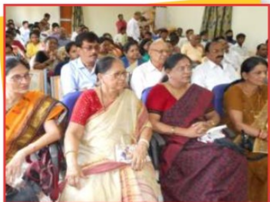
बालाघाट जिले में आयोजित मध्यस्थता जागरूकता कार्यक्रम में भाग लेते हुये प्रतिभागीगण।