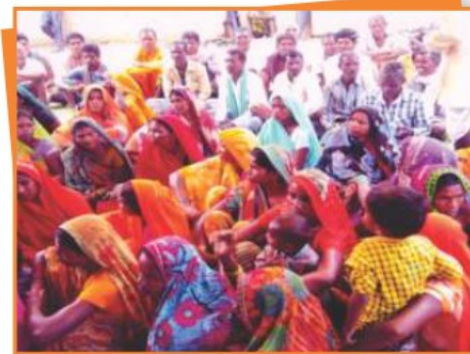
डिण्डौरी जिले में आयोजित विधिक साक्षरता शिविर