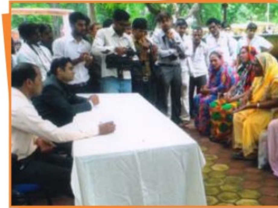
बुरहानपुर जिले में किन्नर समुदाय के कल्याणार्थ आयोजित शिविर