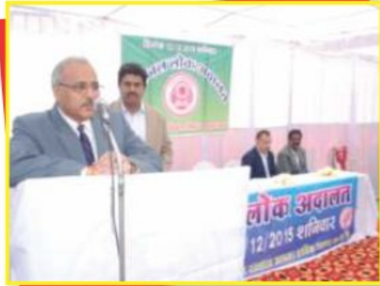
लोक अदालत का शुभारंभ करते हुये माननीय जिला एवं सत्र न्यायाधीश