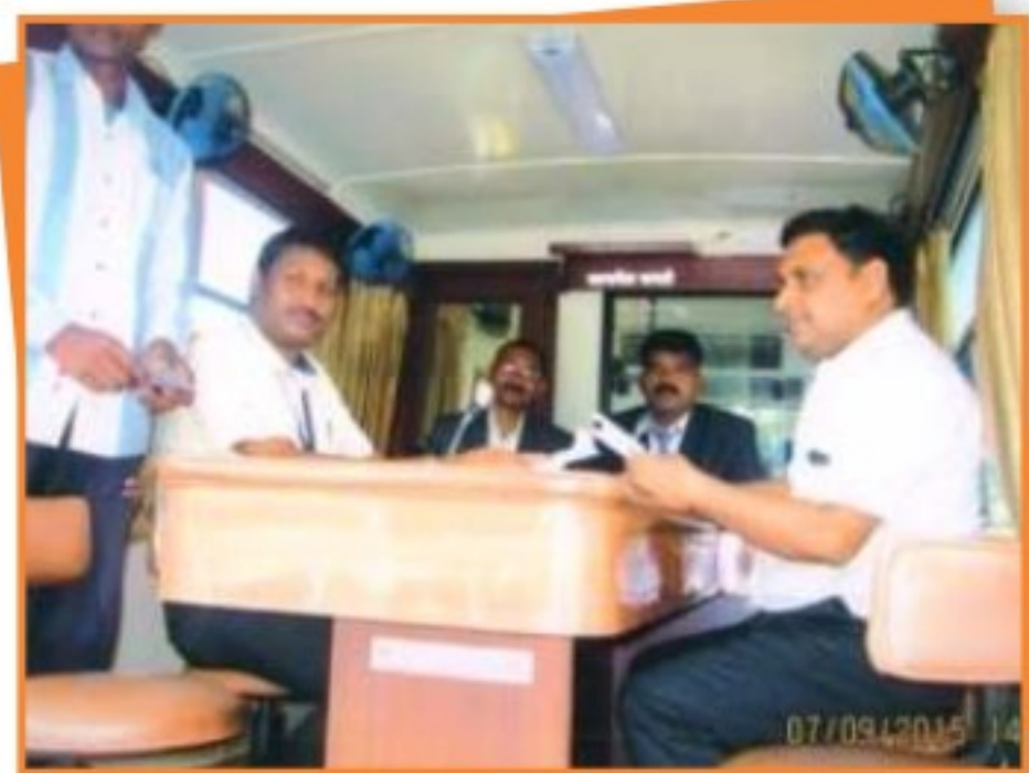
जिला मण्डला में आयोजित मोबाइल लोक अदालत में प्रकरणों का निराकरण करते हुये न्यायाधीश।