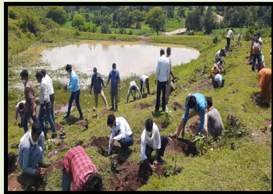
Tree plantation by DLSA Seoni