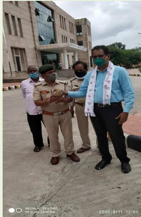
An injured Owl was handed over to the Forest Department by the Secretary, DLSA Jabalpur