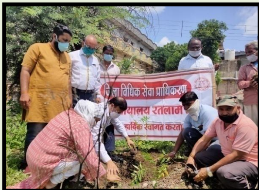
Tree plantation by DLSA Ratlam