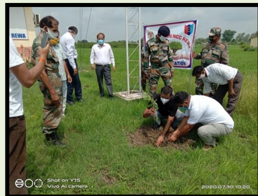
Tree plantation by DLSA Rewa