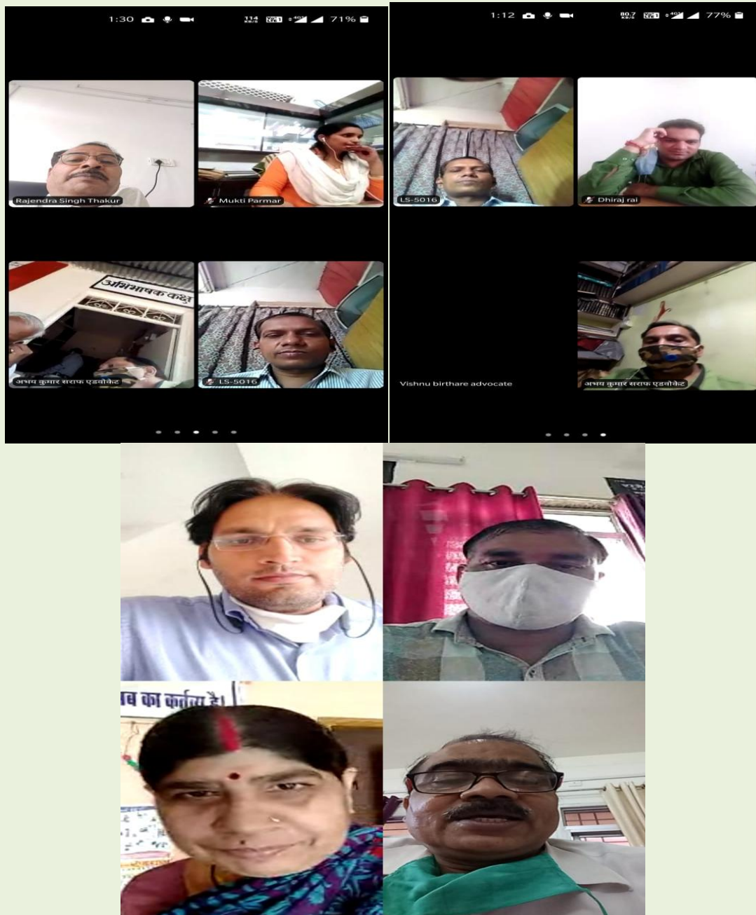
Online Training of PLVs by Secretary DLSA, Datia