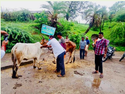
Vaccination by DLSA Jhabua with the coordination of Animal Husbandry Department

The concept of 'Panch Ja' i.e. Jal (Water), Jungle (Forest), Jameen (Land), Jan (People) and Jaanwar (Animals) was revisited keeping in view relevant schemes of NALSA are (Effective implementation of Poverty alleviation) Scheme 2015 & NALSA (Protection & Enforcement of Tribal Rights) Scheme 2015. Madhya Pradesh has a largely tribal and agrarian population. This has been addressed by Legal Services Institutions at two levels (a) needs of those persons whose livelihood is dependent on the environment. & (b) preserving, protecting and rejuvenating the environment essential to maintain the ecosystem. Apart from organized tree plantation programmes in coordination with Officers and Officials of the government, DLSAs have taken on the responsibility to prepare monthly reports on activities while spreading the message of Consume less, compost food waste, choose reusable over single-use and creatively re-cycle.