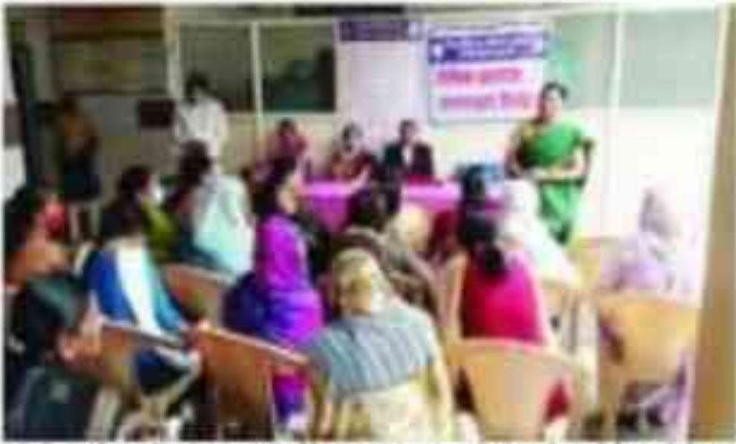
कार्यशाला में महिलाओं को उनके अधिकारों के बारे में बताया गया।

बुरहानपुर (वि.प्र.) न्यायाधीश एवं अध्यक्ष जिला विधिक सेवा प्राधिकरण जबरपुर के निदेशानुसार जबरपुर जिला विधिक सेवा प्राधिकरण द्वारा आयोजित विधिक साक्षरता कार्यशाला में महिलाओं को उनके अधिकारों के बारे में बताया गया।