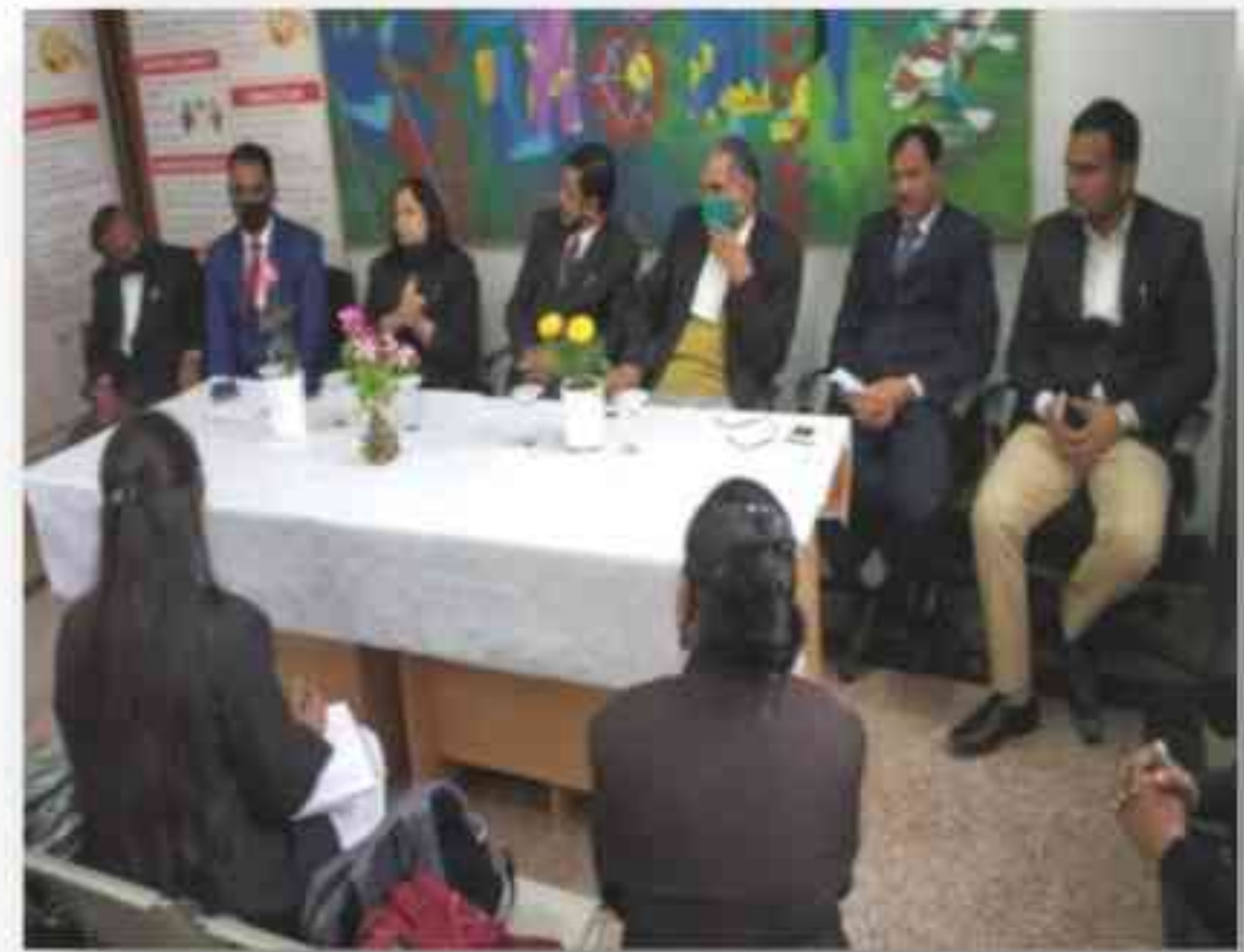
Trained mediators addressing to law students

litigation and Mediation in Court annexed matters. Apart from above the questions raised by the students were answered by Secretary DLSA.