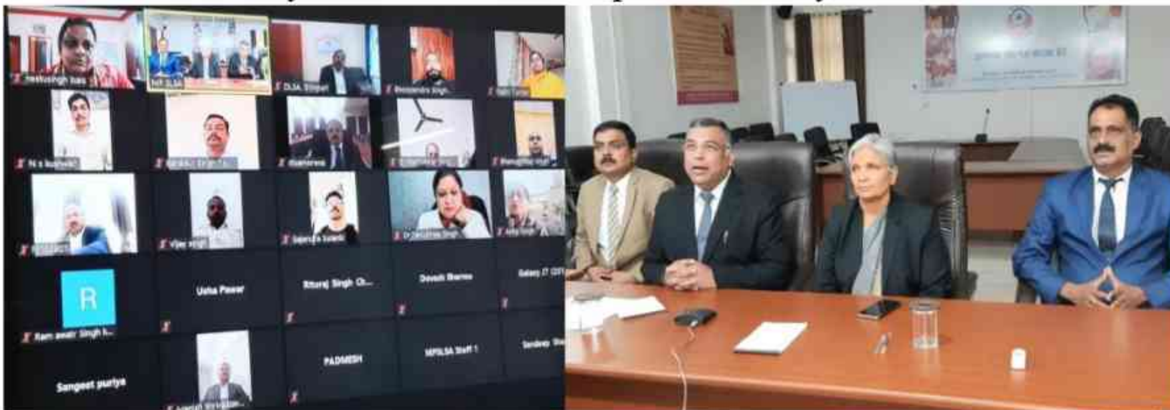
Online Training to Members of Kshatriya Community

The valedictory session was attended by the Secretaries of DLSA who shall be responsible for extending logistic support & assistance apart from monitoring activities of these centres. The trained volunteers of the community shall set up Community Mediation Centres at the community level and resolve disputes amicably.