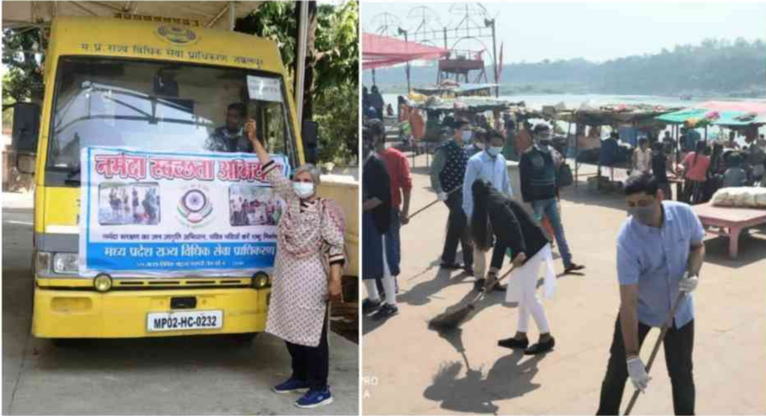
Member-Secretary flagging of the River Cleanliness Campaign

The Legal Services Authorities across the M.P. will review the campaign by regular monitoring of Narmada cleanliness after this campaign with help of college students from Legal Aid Clinics.