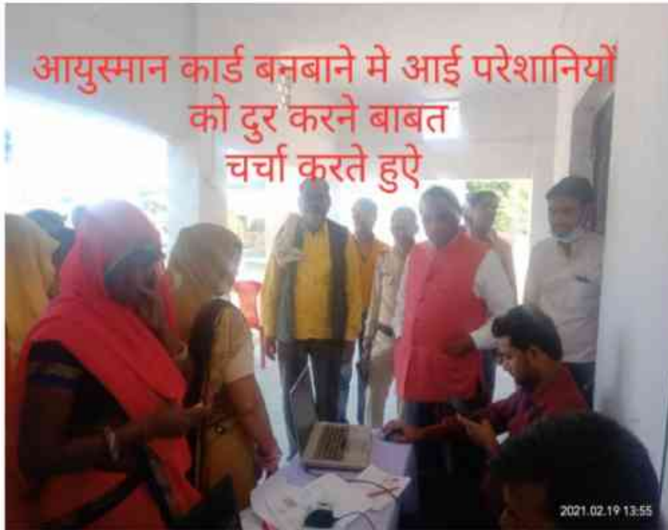
आयुष्मान कार्ड बनवाने में आई परेशानियों को दूर करने बाबत चर्चा करते हुए