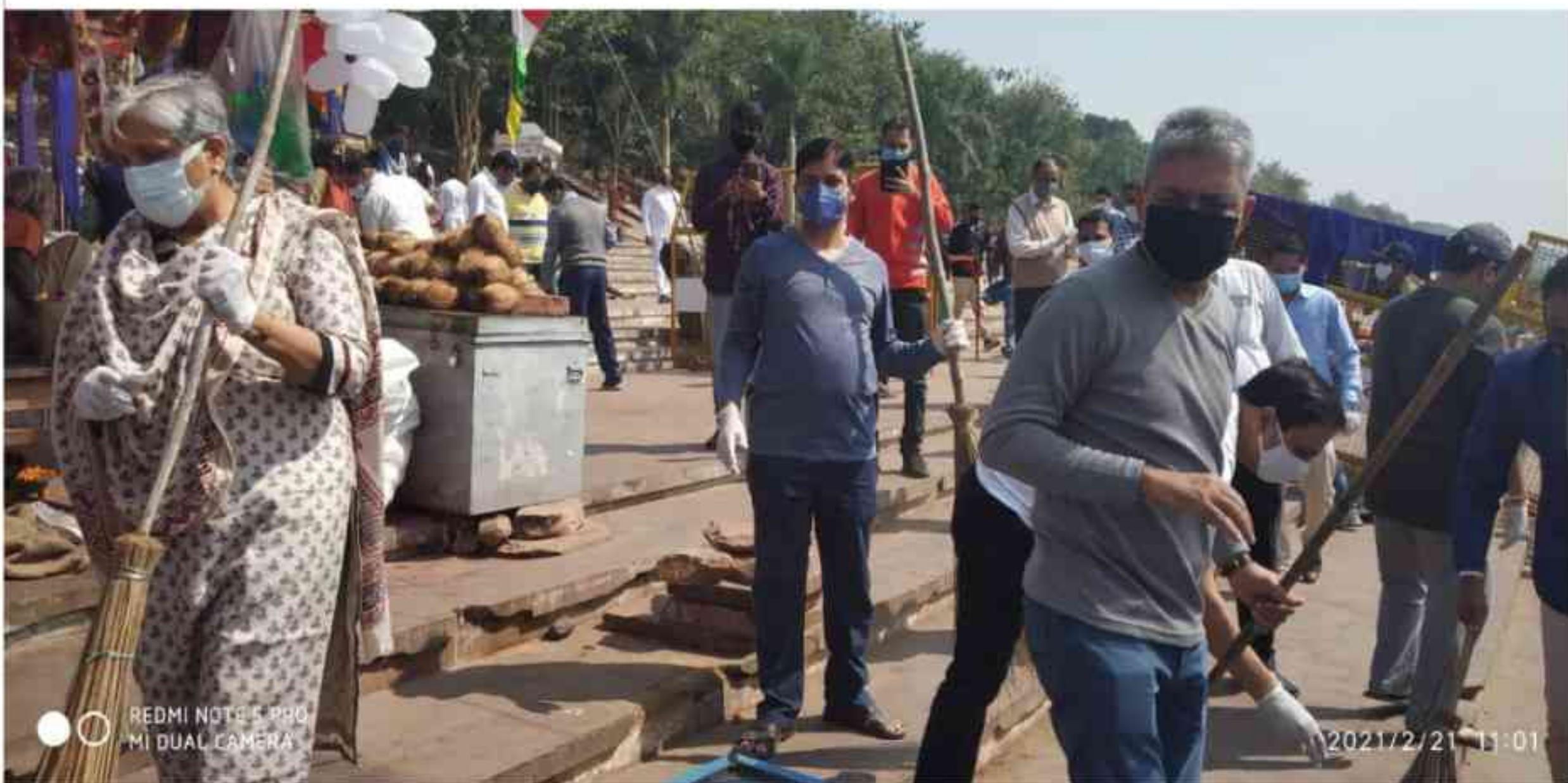
Member-Secretary SLSA along with Chairman DLSA Jabalpur and other officials cleaning Gwari Ghat Jabalpur