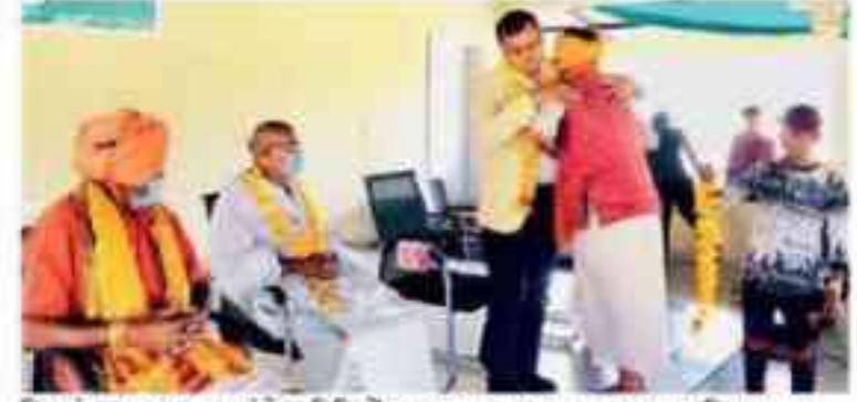
शिवगंगा आश्रम पर पहुंचे अधिकारियों का पुष्पमाला पहनाकर स्वागत किया गया।

पंच-ज अभियान के अंतर्गत जिला विधिक सेवा प्राधिकरण झाबुआ द्वारा जल, जंगल, जमीन, जन और जानवर के संतुलित पर्यावरणीय विकास की अवधारणा के आधार पर प्रकृति संरक्षण के लिए कार्य किया जा रहा है। जिसमें वृक्षारोपण, नदीयों एवं तालाबों की साफ-सफाई एवं जल संरक्षण, वाटर हार्वेस्टिंग, पशु-पक्षियों की सुरक्षा एवं उनके तथा उनकी बीमारियों के लिए टीकाकरण/उपचार आदि प्रकृति संरक्षण के कार्यों के संबंध में शिविरों के माध्यम से आम नागरिकों को जागरूक किया जा रहा है। शिविर को संबोधित करते हुए अपर