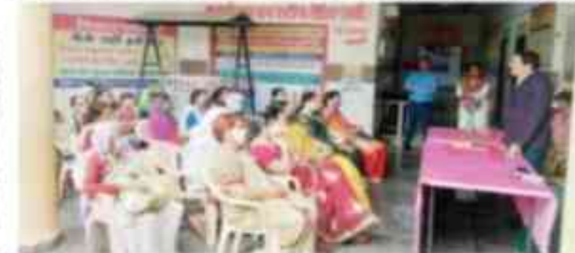
कार्यशाला में महिलाओं को उनके अधिकारों के बारे में बताया गया।

मध्य प्रदेश राज्य सेवा विधिक सेवा प्राधिकरण जबरपुर के निदेशानुसार वन स्टाप सेंटर पर वन स्टाप सेंटर में विधिक साक्षरता कार्यशाला आयोजित की गई।