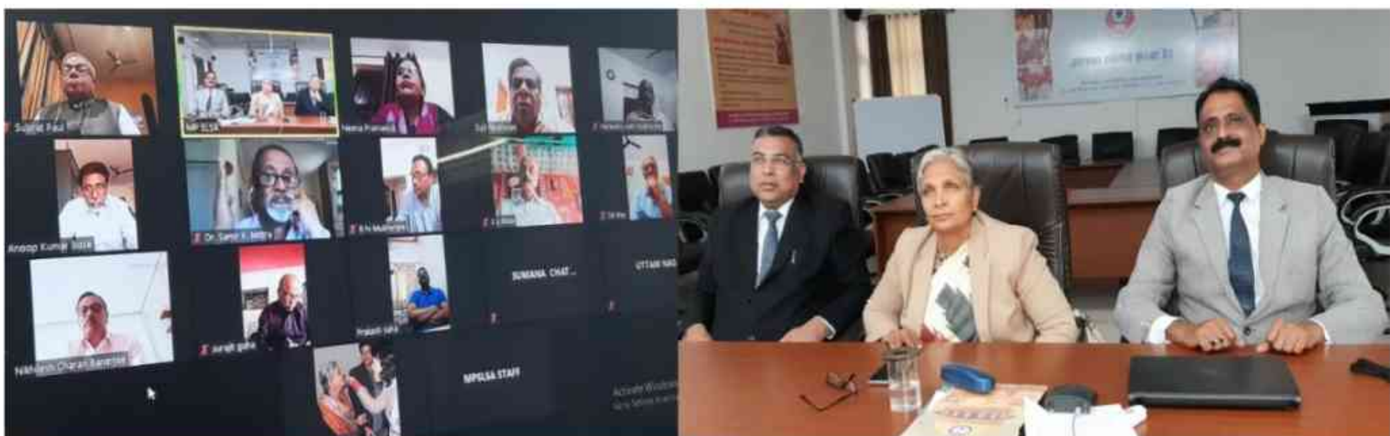
Online Training to Members of Bengali Community