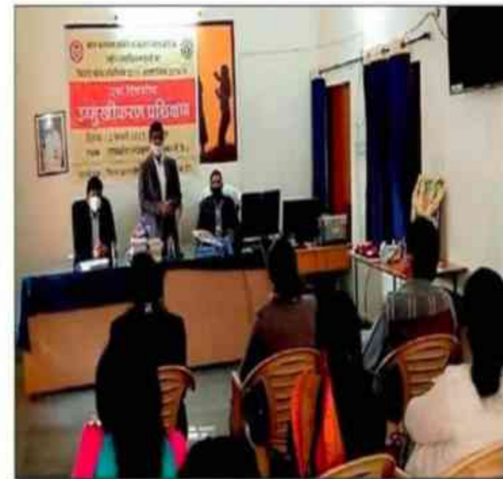
प्रशिक्षण में उपस्थित सदस्यगण