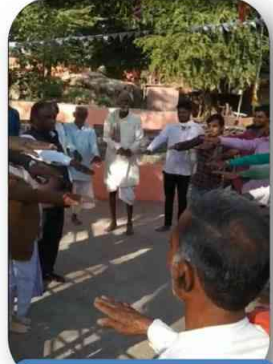
ग्रामीणों को शपथ दिलाते हुए जिला प्राधिकरण के सचिव

जिला प्राधिकरण श्योपुर द्वारा नालसा (नशा पीड़ितों को विधिक सेवाएं एवं नशा उन्मूलन के लिए विधिक सेवाएं) योजना, 2015 के अंतर्गत नशा मुक्ति हेतु एक अनूठी पहल प्रारंभ करते हुए ग्राम नारायणपुरा, जिला श्योपुर में निवासरत व्यक्तियों को नशा से उन्मुक्त कराये जाने हेतु दिनांक 22.01.2021 को विधिक जागरूकता कार्यक्रम का आयोजन किया गया, जिसमें नशा करने वाले व्यक्तियों को नशे के दुष्प्रभाव बताते हुए शपथ दिलाकर नशा छोड़ने के लिये प्रेरित किया। जिला प्राधिकरण श्योपुर के पी.एल.व्ही. की एक टीम एवं ग्राम पंचायत के सचिव के द्वारा नशा करने वाले लोगों को सायं 7 बजे इकट्ठा कर मंदिर लाया जा रहा है, तथा ग्राम के वरिष्ठ नागरिकों द्वारा श्री रामचरित मानस का पाठ सुनाया जायेगा ताकि वे लोग नशा करने की उस समयावधि में नशा न कर सकें। जिला प्राधिकरण श्योपुर द्वारा प्रारंभ की गई पहल निश्चित ही समाज के विकास में सहायक होकर प्रेरणादायक है। मध्यप्रदेश राज्य विधिक सेवा प्राधिकरण द्वारा समस्त जिला विधिक सेवा प्राधिकरणों को उनके जिले में उक्त कार्य को नालसा (नशा पीड़ितों को विधिक सेवाएं एवं नशा उन्मूलन के लिए विधिक सेवाएं) योजना, 2015 के अंतर्गत अभियान के रूप में प्रारंभ करने हेतु निर्देशित भी किया गया है।