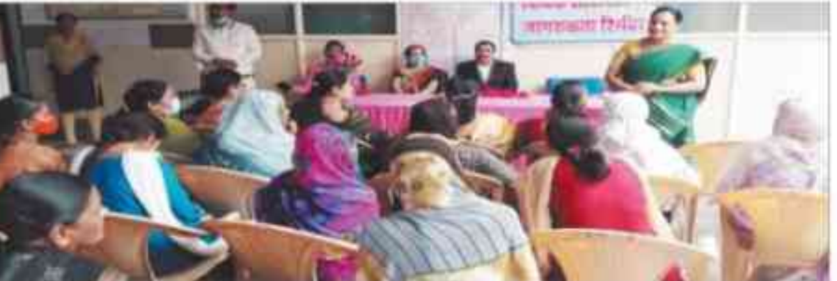
कार्यशाला में महिलाओं को उनके अधिकारों के बारे में बताया गया।