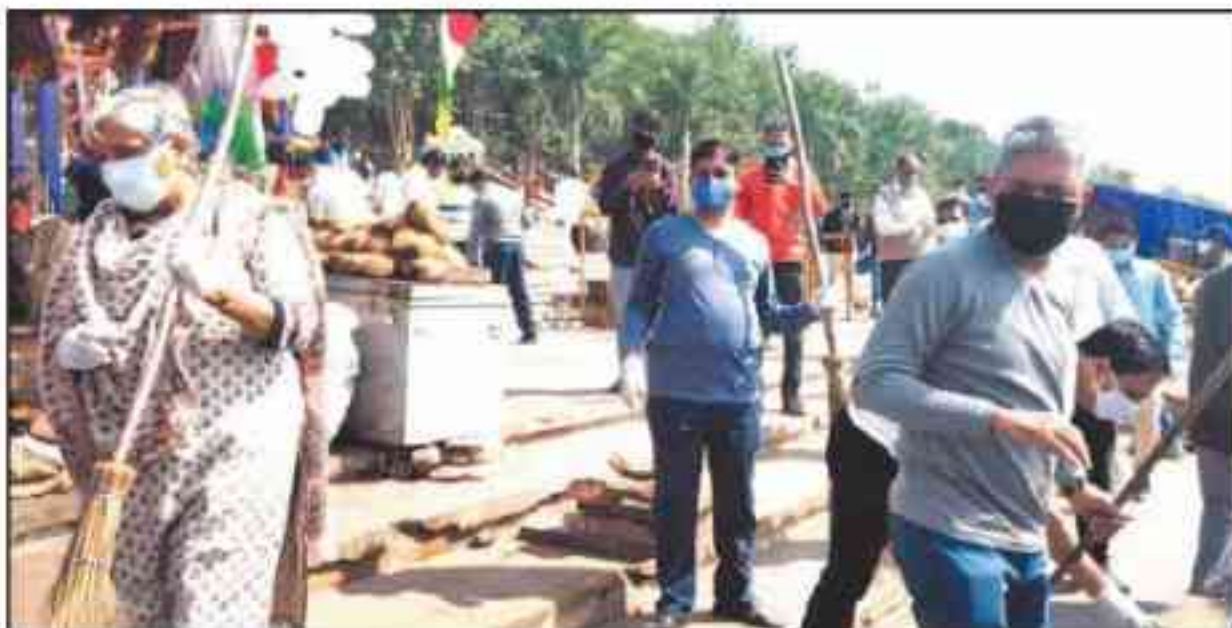
Judges and members of MPSLSA conducting cleanliness drive at the bank of river Narmada in Gwahat.

MPSLSA office bearers said to ensure participation of legal fra-