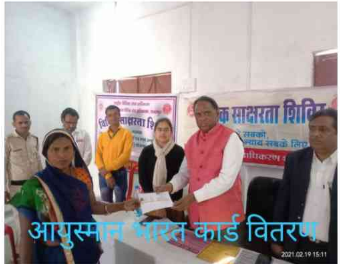
आयुष्मान भारत कार्ड वितरण