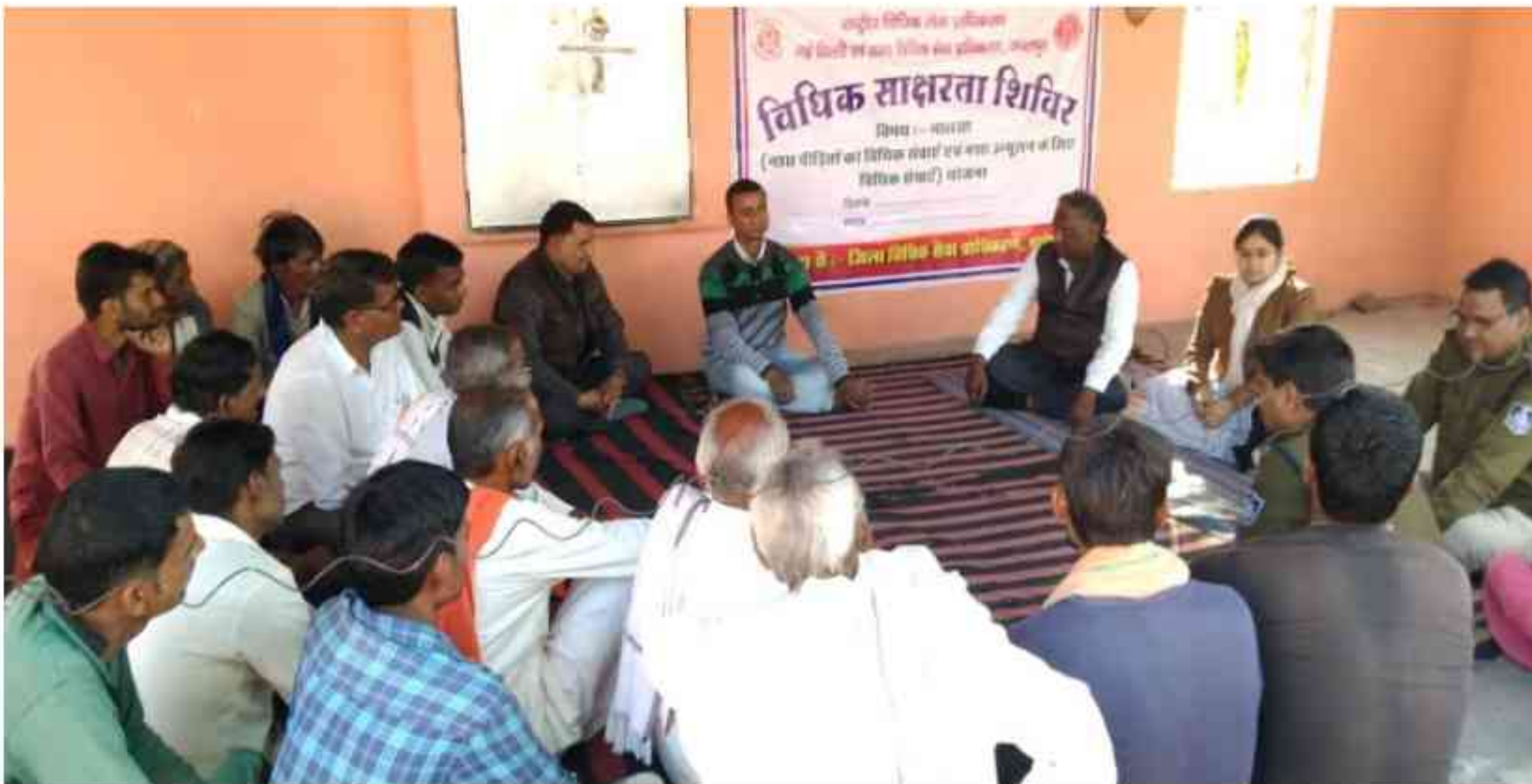
ग्राम नारायण पुरा श्योपुर के ग्रामीणों से नशा मुक्त ग्राम किये जाने हेतु चर्चा