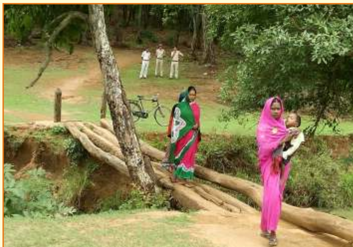
Temporary Bridge at Dindori