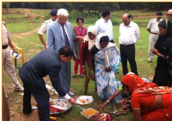
Bhumi Poojan of New Bridge by Hon'ble Justice K.K. Trivedi at Dindori