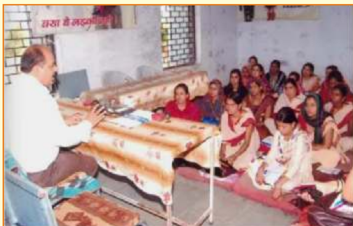
जिला विधिक सेवा प्राधिकरण – शिवपुरी