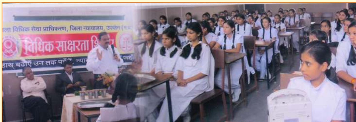
जिला विधिक सेवा प्राधिकरण – उज्जैन द्वारा स्कूली छात्राओं के मूल कर्तव्यों पर आयोजित साक्षरता शिविर