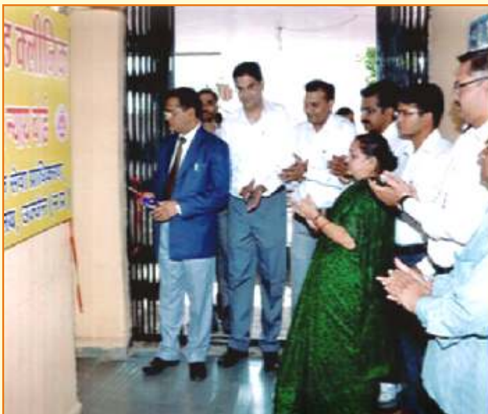
जिला विधिक सेवा प्राधिकरण –उज्जैन किशोर न्याय बोर्ड में लीगल एड क्लीनिक

बूढ़ी आंखों में अभी न्याय की उम्मीद बाकी है