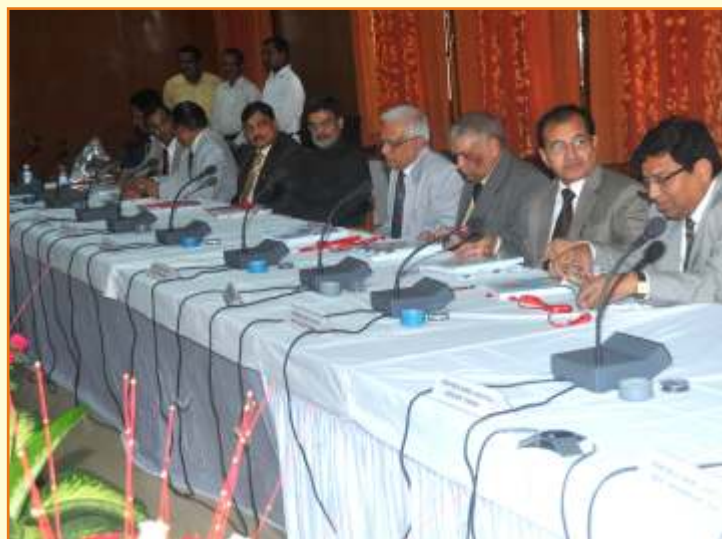
Hon'ble Judges present on the occasion - 19 July 2014