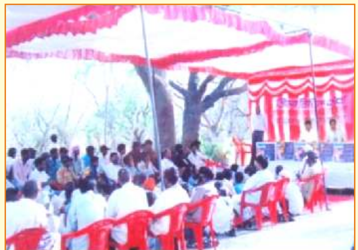
1 मई श्रमिक दिवस जिला विधिक सेवा प्राधिकरण—ग्वालियर