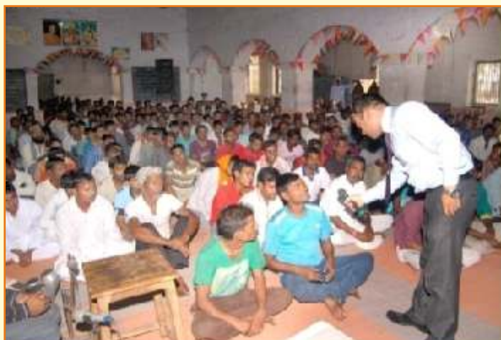
जिला जेल ग्वालियर में आयोजित शिविर

हैं। इन निर्देशों के परिपालन में प्रदेश के समस्त जिला विधिक सेवा प्राधिकरणों द्वारा जेलों का नियमित रूप से दौरा करें बंदी महिलाओं के साथ रहने वाले बच्चों के हितों के संरक्षण एवं समाज की मुख्य धारा में शामिल करने के विशेष प्रयास भी सम्मिलित हैं।