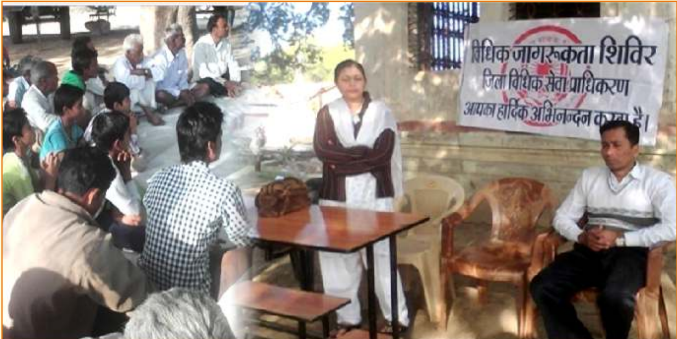
जिला विधिक सेवा प्राधिकरण – रतलाम