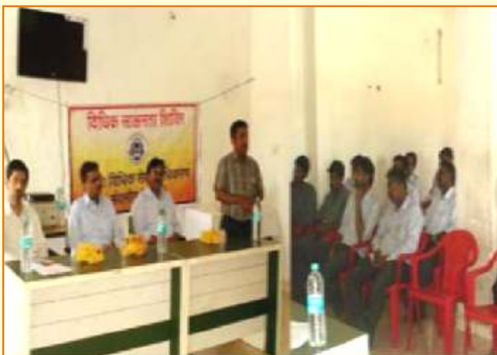
1 मई श्रमिक दिवस जिला विधिक सेवा प्राधिकरण – शिवपुरी

द्वारा समस्त जिला प्राधिकरणों में “श्रमिकों के विरुद्ध अपराध प्रकोष्ठ योजना” जिला न्यायाधीश की अध्यक्षता में चला कर उन्हें न्याय दिलाया जा रहा है।