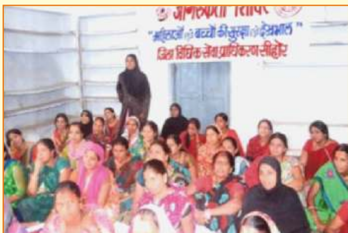
जिला विधिक सेवा प्राधिकरण - सीहोर

राज्य प्राधिकरण द्वारा महिलाओं के हितों के संरक्षण के लिए शिविर आयोजन के साथ-साथ प्रत्येक जिला प्राधिकरण में महिला अपराध प्रकोष्ठ स्थापित है। जिला न्यायाधीश की अध्यक्षता में गठित यह प्रकोष्ठ महिलाओं को त्वरित न्याय दिलाने में सहायता करता है।