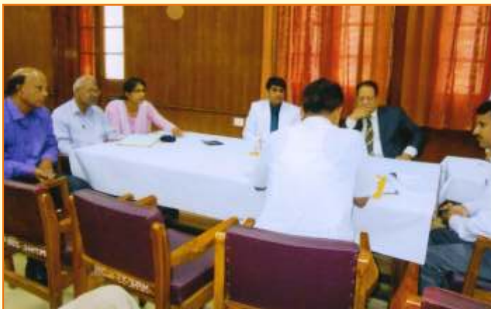
हाईकोर्ट लीगल सर्विसेज कमेटी - जबलपुर में आयोजित लोक अदालत