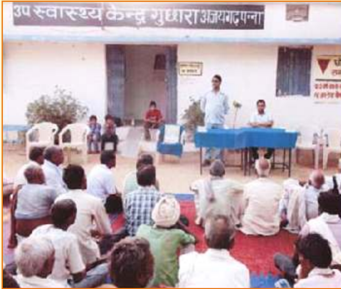
जिला विधिक सेवा प्राधिकरण –पन्ना स्वास्थ्य केंद्र