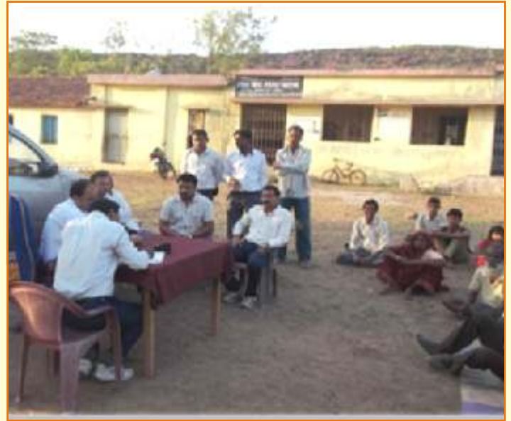
जिला विधिक सेवा प्राधिकरण –सागर शासकीय विद्यालय