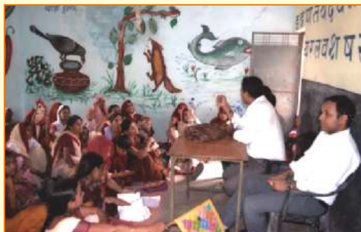
जिला प्राधिकरण द्वारा आयोजित शिविर