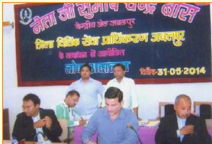
केंद्रीय जेल जबलपुर में आयोजित लोक अदालत