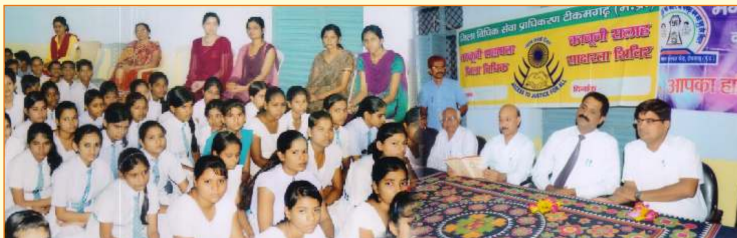
जिला विधिक सेवा प्राधिकरण – टीकमगढ़ द्वारा स्कूल में छात्राओं के मूल कर्तव्यों पर आयोजित साक्षरता शिविर