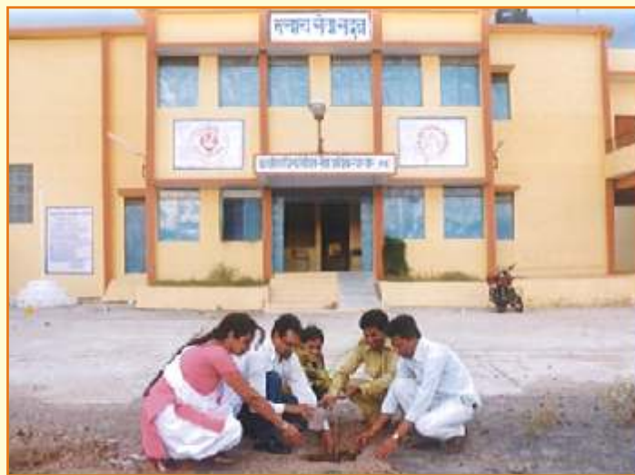
वृक्षारोपण न्याय सेवा सदन, जिला विधिक सेवा प्राधिकरण –धार