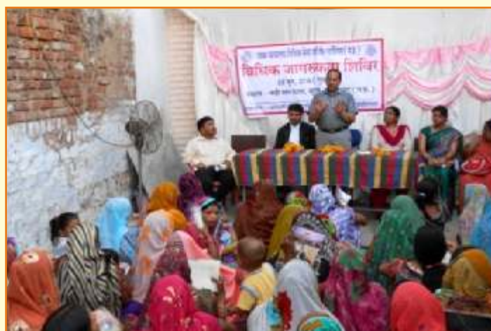
जिला विधिक सेवा प्राधिकरण - ग्वालियर