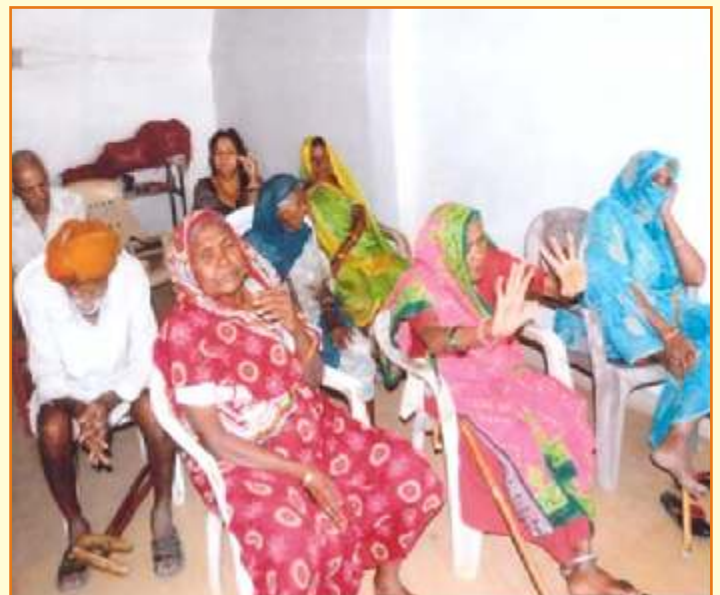
जिला विधिक सेवा प्राधिकरण–सीहोर वृद्धाश्रम

बूढ़ी आंखों में अभी न्याय की उम्मीद बाकी है