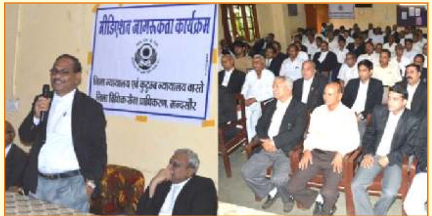
जिला विधिक सेवा प्राधिकरण मंदसौर