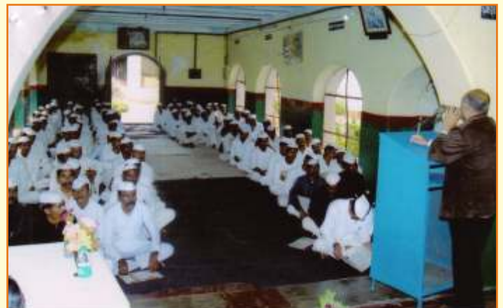
जिला जेल नरसिंहपुर बंदियों के विधिक अधिकार पर आयोजित जागरूकता शिविर