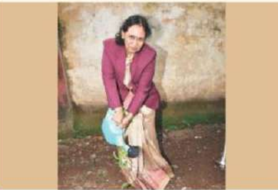
Hon'ble Smt Justice Sunita Yadav