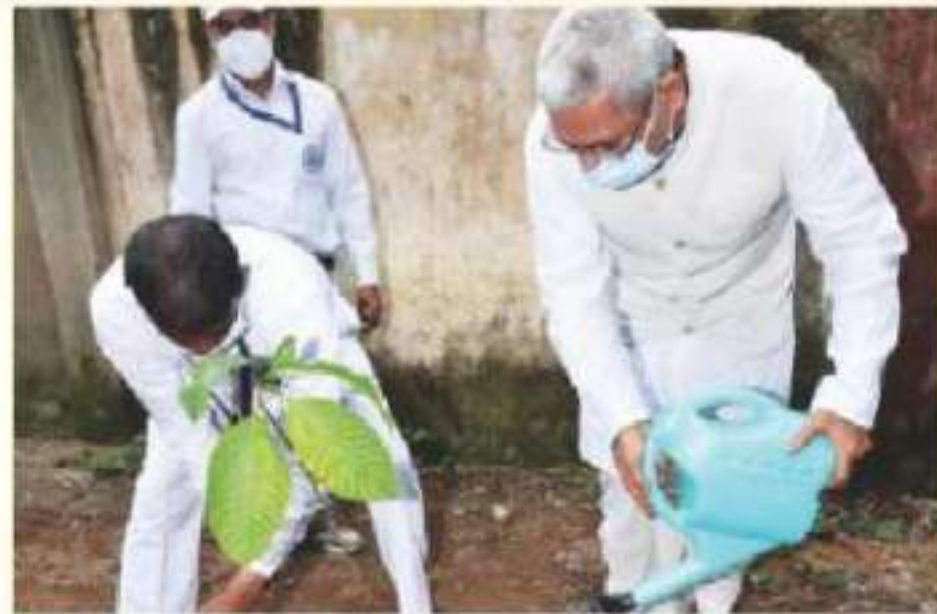
Hon'ble Shri Justice Vishal Dhagat