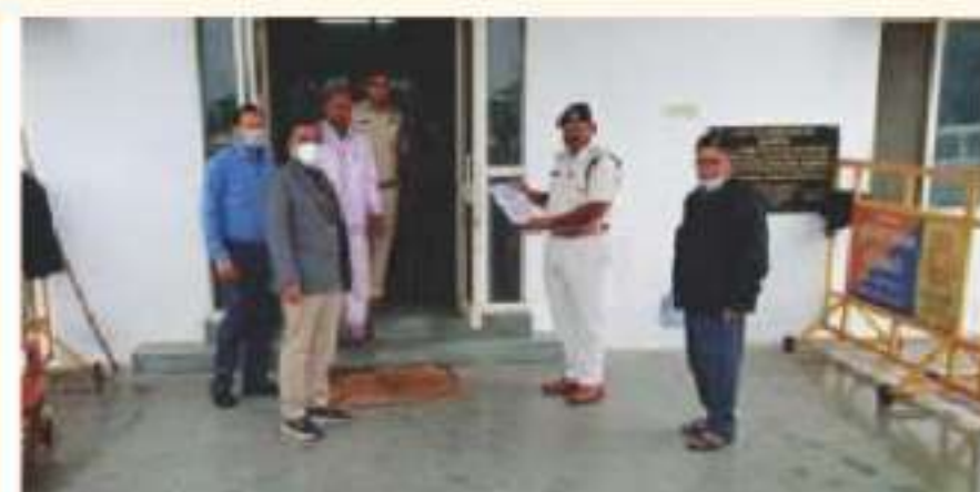
Secretary DLSA MANDSAUR