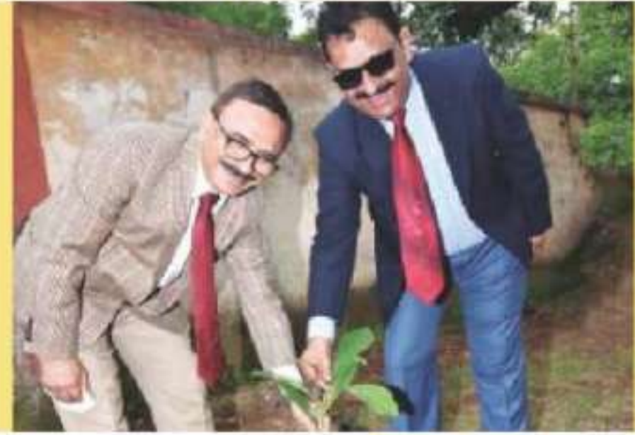
Hon'ble Shri Justice Virender Singh & Hon'ble Shri Justice Sanjay Dwivedi