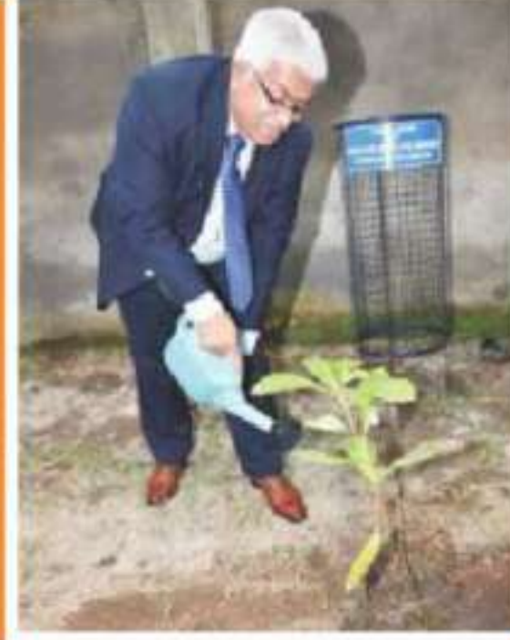
Hon'ble Shri Justice Atul Sreedharan