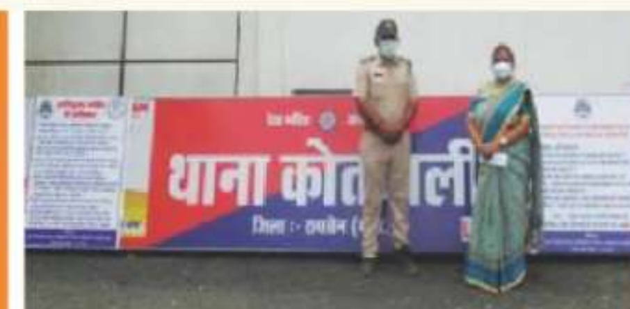
Secretary DLSA RAISEN