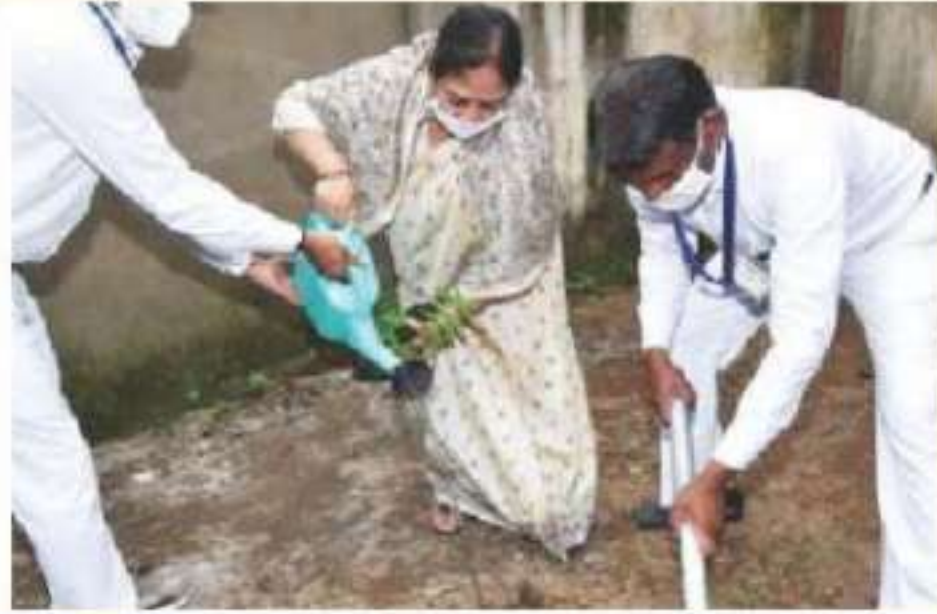
Hon'ble Smt Justice Anjali Palo