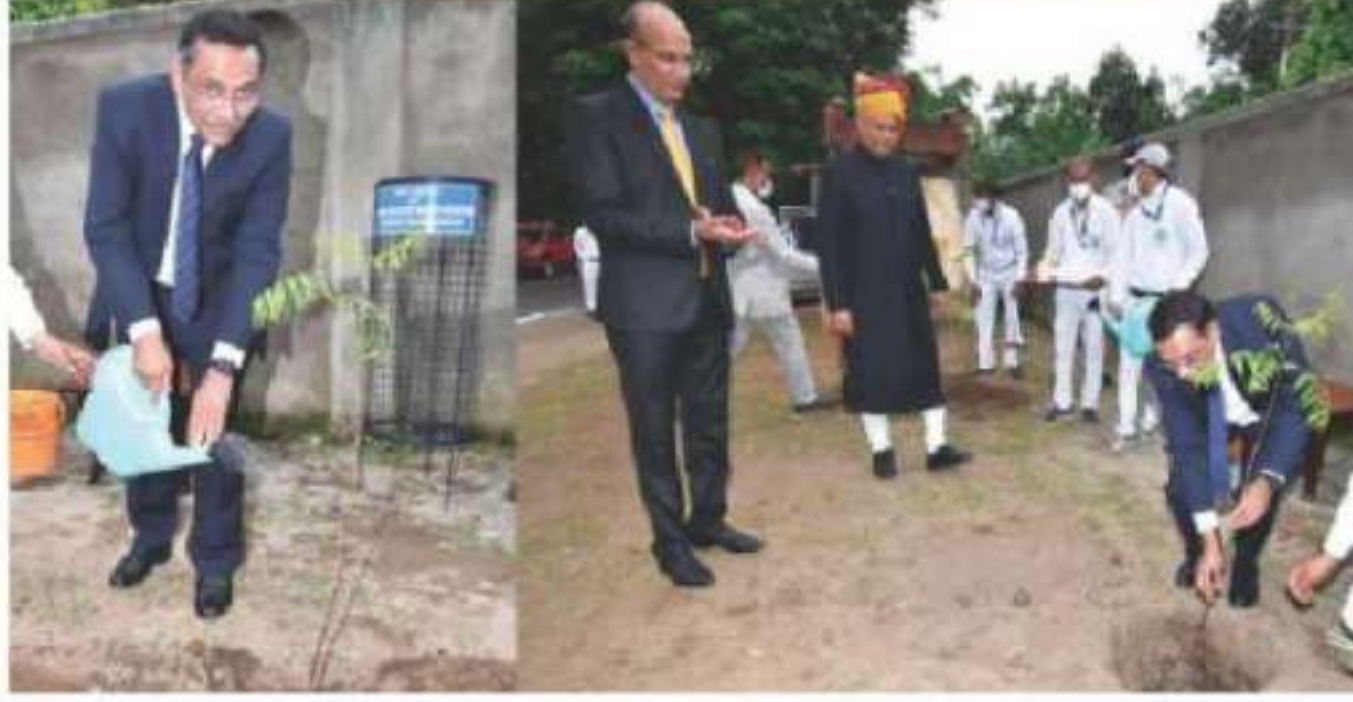
Hon'ble Shri Justice Prakash Shrivastava