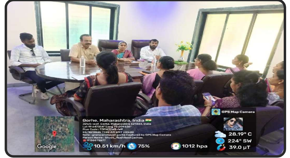
उत्पन्न वाढीकरीता व वसुलीचे उदीष्टपुर्तीकरीता बैठकीचे आयोजन