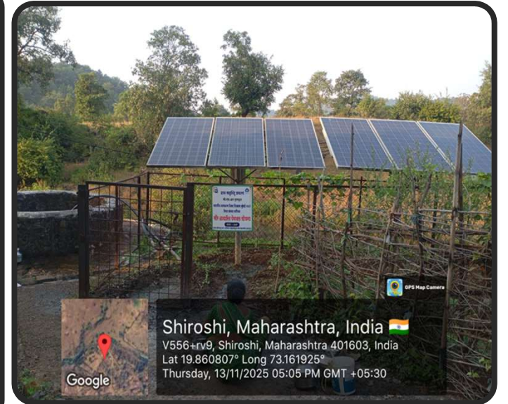
वीज पंप यांवर अपारंपारिक उर्जा व सौर उर्जा यांचा वापर