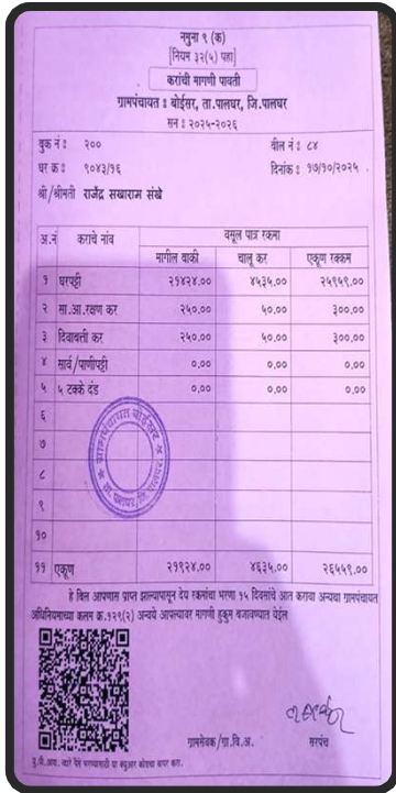
ग्रामपंचायती मध्ये QR Code चा वापर