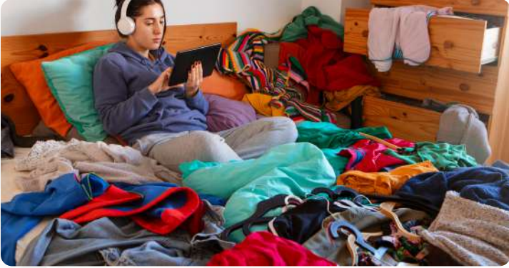
वस्त्रोद्योग आणि कपड्यांसाठी ग्राहकांची मागणी वाढत आहे

वस्त्रोद्योग आणि कपडे हा एक असा उद्योग आहे जो त्याच्या अत्यंत प्रदूषणकारी उत्पादन प्रक्रियेसाठी तसेच वाढती लोकसंख्या आणि ग्राहकांच्या मागणीमुळे वाढलेल्या कचऱ्यासाठी कुप्रसिद्ध आहे.