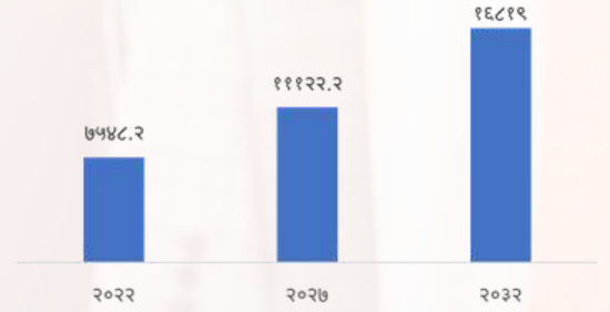
जागतिक नैतिक फॅशन बाजारपेठेची वाढ दशलक्ष अमेरिकी डॉलरमध्ये

नैतिक फॅशन हा एक उद्योगाचा कल आहे जो लिफाफ्याला शाश्वततेच्या पलीकडे ढकलतो. नैतिक फॅशनचा उद्देश पर्यावरण आणि समाजावरील परिणाम मोजण्यासाठी जबाबदारी सुनिश्चित करणे हा आहे आणि त्यात न्याय्य व्यापार, क्रूरता-मुक्त, पर्यावरण-स्नेही आणि धर्मादाय यासारख्या उप-विभागांचा समावेश आहे. उत्पादने सेंट्रिय, पुनरुत्पादित, पुनर्नवीनीकरण किंवा नैसर्गिक असू शकतात. नैतिक फॅशन बाजार २०२२ मध्ये ७ कोटी अमेरिकी डॉलरवरून २०३२ मध्ये ८.६ टक्के सी. ए. जी. आर. सह १६ कोटी अमेरिकी डॉलरपर्यंत वाढण्याची अपेक्षा आहे.