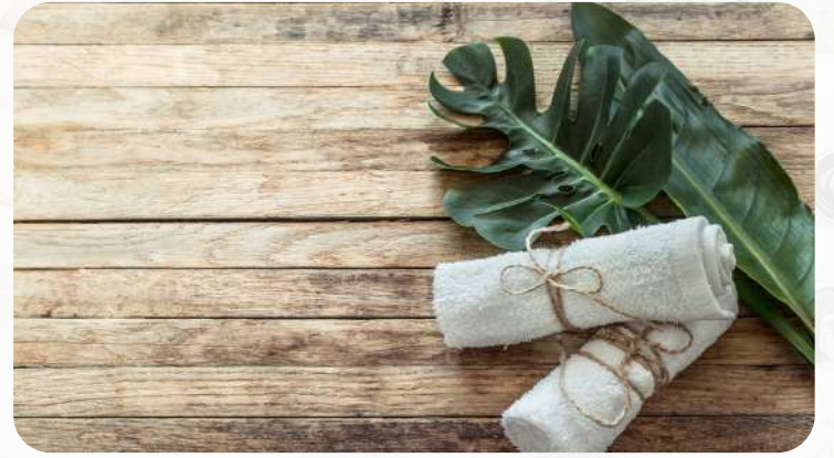
बांबूचे टॉवेल हा एक शाश्वत पर्याय आहे

त्यामुळे, वापरलेल्या कच्च्या मालाचे मूल्यांकन करण्यापासून, त्या किमान संसाधनांचा वापर करून पिकवल्या जात आहेत आणि टाकून दिल्यावरही त्यांचा पर्यावरणावर कोणताही प्रतिकूल परिणाम होणार नाही याची खात्री करून घेण्यापासून शाश्वततेकडे वाटचाल सुरू होते. केळी, बांबू, मका आणि काथ्यासारखे अपारंपरिक आणि जैव-आधारित तंतू तसेच पुनर्नवीनीकरण केलेले तंतू हळूहळू लोकप्रिय होत आहेत आणि त्यांना एक उद्योग म्हणून अधिक चालना मिळणे आवश्यक आहे