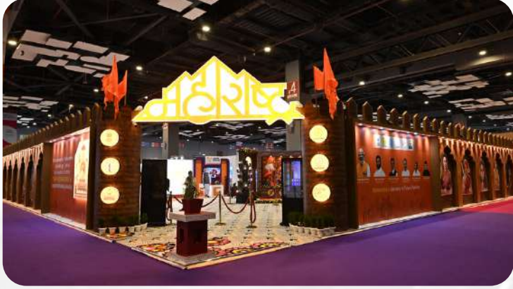
भारत मंडपम येथील महाराष्ट्र मंडप

फार्म ते फायबर ते फॅक्टरी ते फॅशन ते फॉरेन या कापड उद्योगासाठी भारताच्या ५ एफ दृष्टिकोनाचे प्रतिनिधित्व करत, नवी दिल्लीतील प्रगती मैदानातील भारत मंडपम आणि द्वारका येथील यशोभूमी या दोन ठिकाणी २६ ते २९ फेब्रुवारी २०२४ या कालावधीत १४०० चौरस मीटरपेक्षा जास्त क्षेत्रावर महाराष्ट्र मंडप उभारण्यात आले. या कार्यक्रमाचे उद्घाटन माननीय पंतप्रधान श्री. नरेंद्र मोदी.