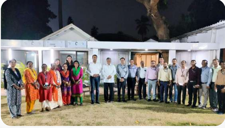
या भेटीला उपस्थित असलेले वस्त्रोद्योग विभागाचे अधिकारी