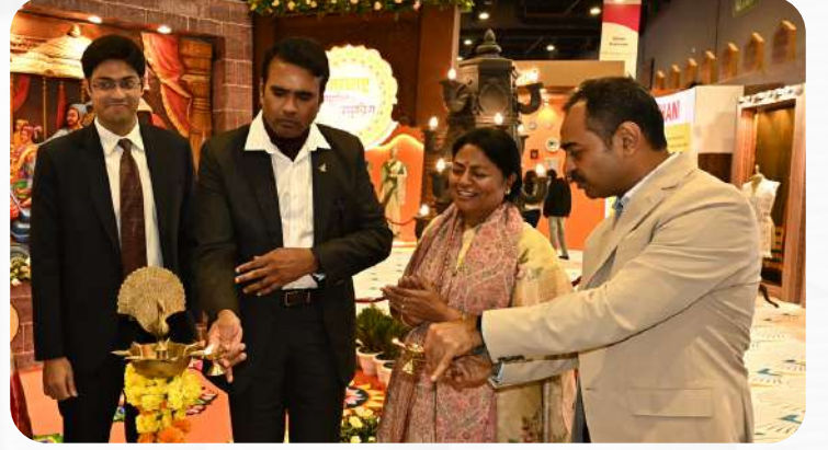
पॅव्हिलियनचे उद्घाटन करण्यासाठी मान्यवर औपचारिक दीपप्रज्वलन करतात