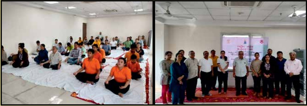
(राष्ट्रीय न्यास परिसर में योगदिवस का आयोजन)

(iii) अंतर्राष्ट्रीय योग दिवस-2024: राष्ट्रीय न्यास में दिनांक 21.06.2024 को अंतर्राष्ट्रीय योग दिवस-2024 का आयोजन किया गया। पंजीकृत संगठन दिल्ली के दिव्यांगजनों और राष्ट्रीय न्यास के पदाधिकारियों ने योग सत्र में भाग लिया।