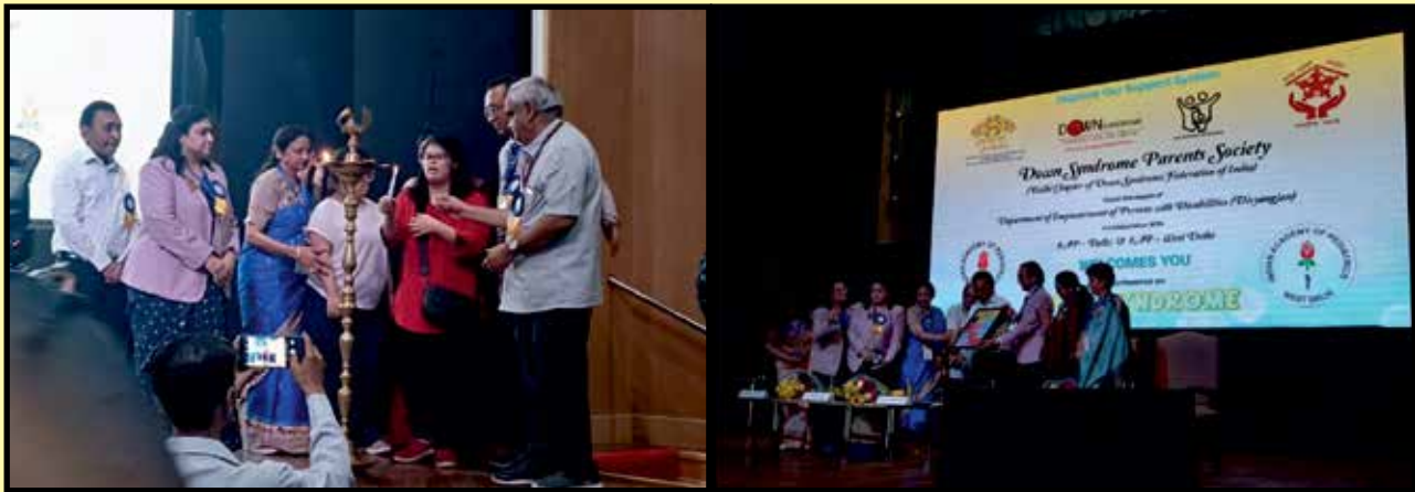
डाउन सिंड्रोम दिवस पर राष्ट्रीय न्यास द्वारा आयोजित कार्यक्रम में दीप प्रज्ज्वलन एवं पेशेवरों का सम्मान।