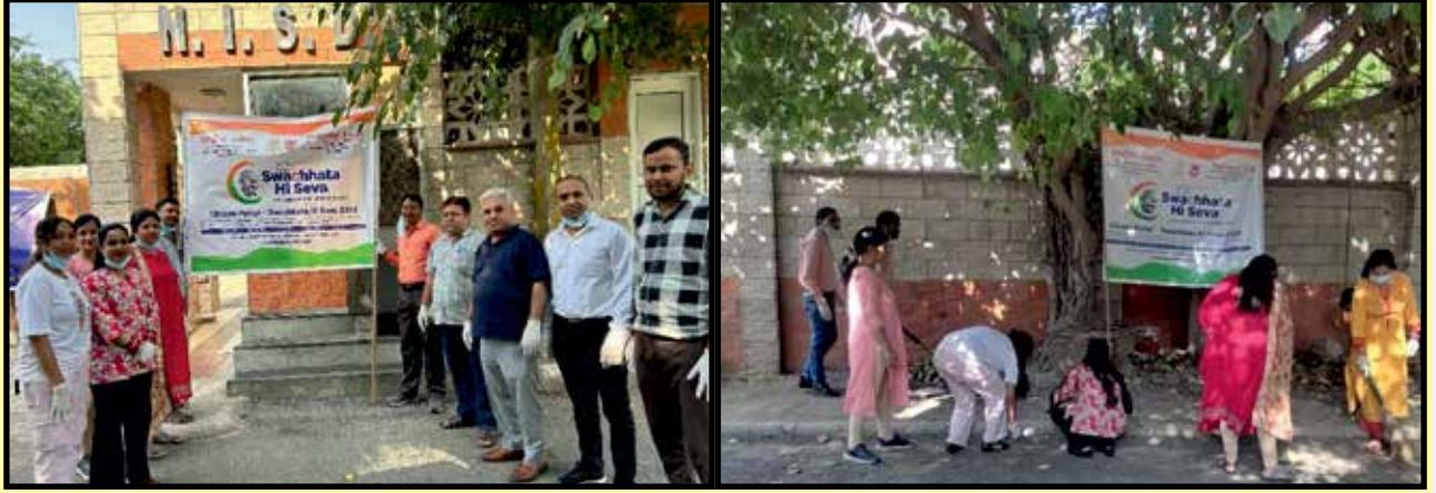
राष्ट्रीय न्यास के कर्मचारियों द्वारा स्वच्छता अभियान

viii) विश्व सेरेब्रल पाल्सी दिवस पर राष्ट्रीय बैठक: 6 अक्टूबर 2024 को विश्व सेरेब्रल पाल्सी दिवस पर वर्चुअल आधार पर राष्ट्रीय बैठक आयोजित की गई। सेरेब्रल पाल्सी के क्षेत्र के प्रख्यात और पेशेवर विशेषज्ञ के रूप में शामिल हुए। राष्ट्रीय न्यास के संयुक्त सचिव और मुख्य कार्यकारी अधिकारी, श्री के.आर. वैधेश्वरन ने अपने उद्घाटन भाषण में सेरेब्रल पाल्सी के क्षेत्र में नवाचार की आवश्यकता पर जोर दिया ताकि सेरेब्रल पाल्सी से प्रभावित व्यक्ति मुख्यधारा में शामिल हो सकें। इस वर्चुअल बैठक में 130 से अधिक प्रतिभागियों ने भाग लिया, जिनमें राष्ट्रीय न्यास के बोर्ड सदस्य, सरकारी अधिकारी, संगठन और सेरेब्रल पाल्सी के श्रेणी में आने वाले दिव्यांगजनों के लिए काम करने वाले पेशेवर आदि शामिल हुए।