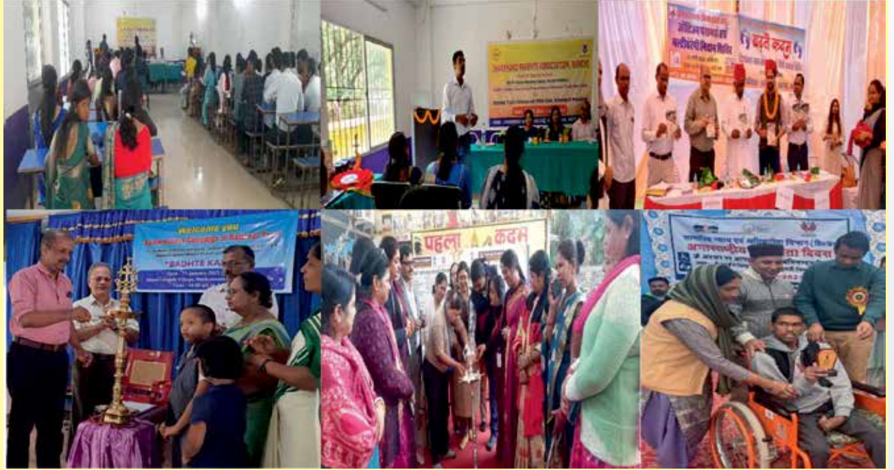
बढ़ते कदम जागरूकता कार्यक्रम की झलकियां