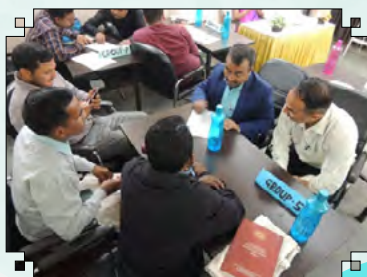
Induction Course of Headmasters at ZIET Bhubaneswar