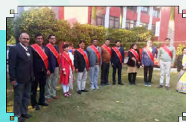
Induction Course of Vice Principals at ZIET Gwalior & ZIET Chandigarh