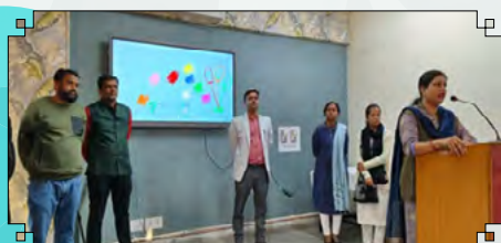
Training of Balvatika Teachers at ZIET Chandigarh