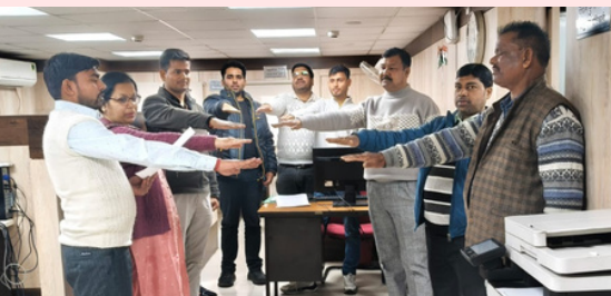
एन.आई.सी. यूपी एडमिन टीम

स्वच्छता पखवाड़ा 2026 के दौरान राष्ट्रीय सूचना विज्ञान केंद्र (एनआईसी), उत्तर प्रदेश के जिला इकाइयों ने भी बढ़-चढ़कर उत्साह एवं प्रतिबद्धता के साथ सहभागिता की। विभिन्न जिलों के अधिकारियों एवं कर्मचारियों ने स्वच्छता से संबंधित गतिविधियों में सक्रिय रूप से भाग लिया, जिससे स्वच्छ एवं स्वस्थ वातावरण बनाए रखने की उनकी सामूहिक जिम्मेदारी स्पष्ट रूप से परिलक्षित हुई।