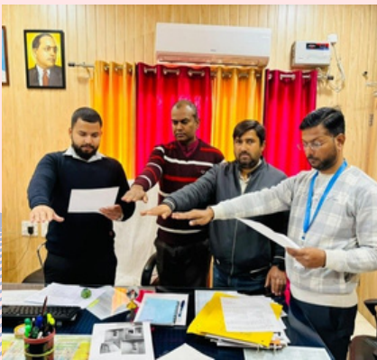
NIC Balrampur District Center / एन.आई.सी. बलरामपुर जिला केंद्र