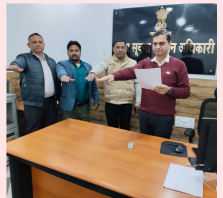
NIC Deoria District Center / एन.आई.सी. देवरिया जिला केंद्र