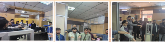
राजस्व परिषद - एन.आई.सी. टीम