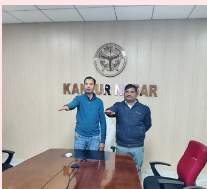
NIC Kanpur Nagar District Center / एन.आई.सी. कानपुर नगर जिला केंद्र