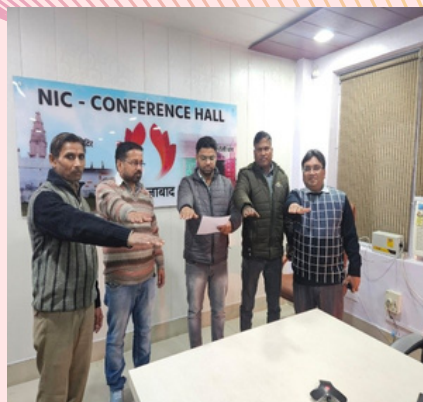
NIC Firozabad District Center / एन.आई.सी. फिरोजाबाद जिला केंद्र