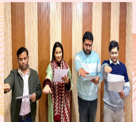
NIC Gautambuddha Nagar District Center / एन.आई.सी. गौतमबुद्ध नगर जिला केंद्र