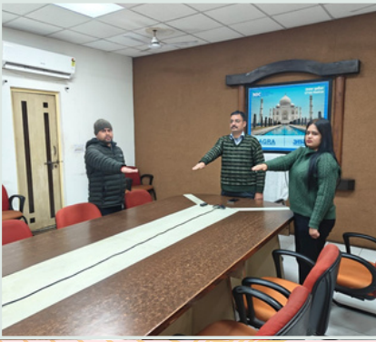
NIC Agra District Centre / एन.आई.सी. आगरा जिला केंद्र