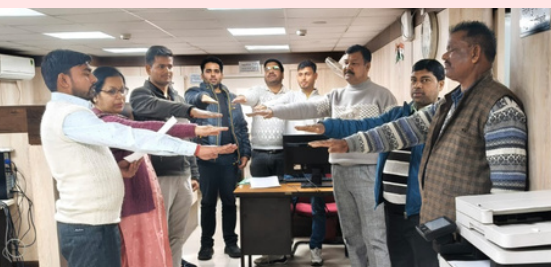
NIC UP Admin Team