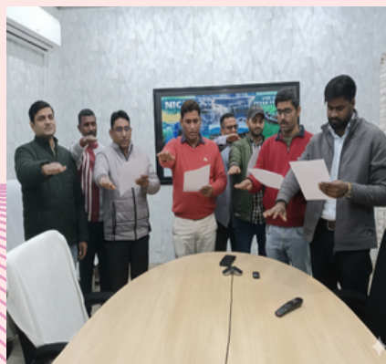
NIC Chandauli District Center / एन.आई.सी. चंदौली जिला केंद्र