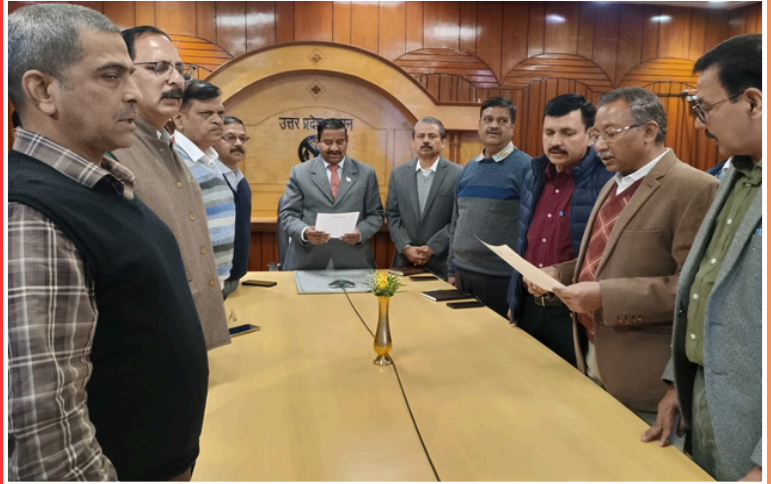
SIO UP along with Senior Officers of UP

During the program, all officers & staff members took the Swachhta Pakhwada pledge , committing themselves to maintaining cleanliness in their workplace and surrounding areas, spreading awareness about cleanliness, & promoting the objectives of the Swachh Bharat Mission among the public.