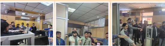
BOR NIC Team