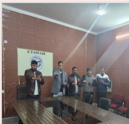
NIC Etawah District Centre / एन.आई.सी. इटावा जिला केंद्र