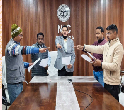
NIC Auraiya District Center / एन.आई.सी. औरैया जिला केंद्र