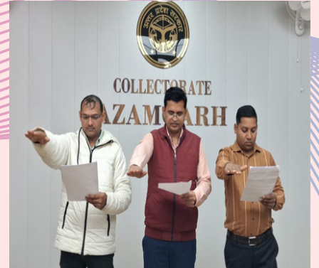
NIC Azamgarh District Center / एन.आई.सी. आजमगढ़ जिला केंद्र