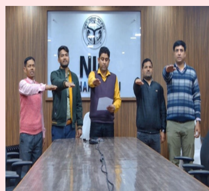
NIC Maharajganj District Center / एन.आई.सी. महाराजगंज जिला केंद्र