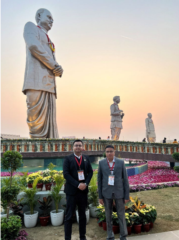
Image 9: कार्यक्रम की सफल समाप्ति एवं माननीय प्रधानमंत्री जी के प्रस्थान उपरान्त राष्ट्र प्रेरणा स्थल, बसंत कुंज योजना, लखनऊ में डी०आई०ओ० (दाएँ) एवं ए०डी०आई०ओ० (बाएँ); पृष्ठभूमि में पूर्व राष्ट्रीय नेताओं की प्रतिमाएँ दृष्टिगोचर हैं।

माननीय प्रधानमंत्री की इस यात्रा के दौरान आई०सी०टी० सेवाओं का सुचारु संचालन, वी०वी०आई०पी० एवं राष्ट्रीय स्तर के कार्यक्रमों के लिए एन०आई०सी० लखनऊ को एक विश्वसनीय एवं सक्षम तकनीकी भागीदार के रूप में पुनः स्थापित करता है, जो सीमित समय में सुरक्षित, सुदृढ़ एवं मिशन-क्रिटिकल आईसीटी सेवाएँ प्रदान करने में सक्षम है।