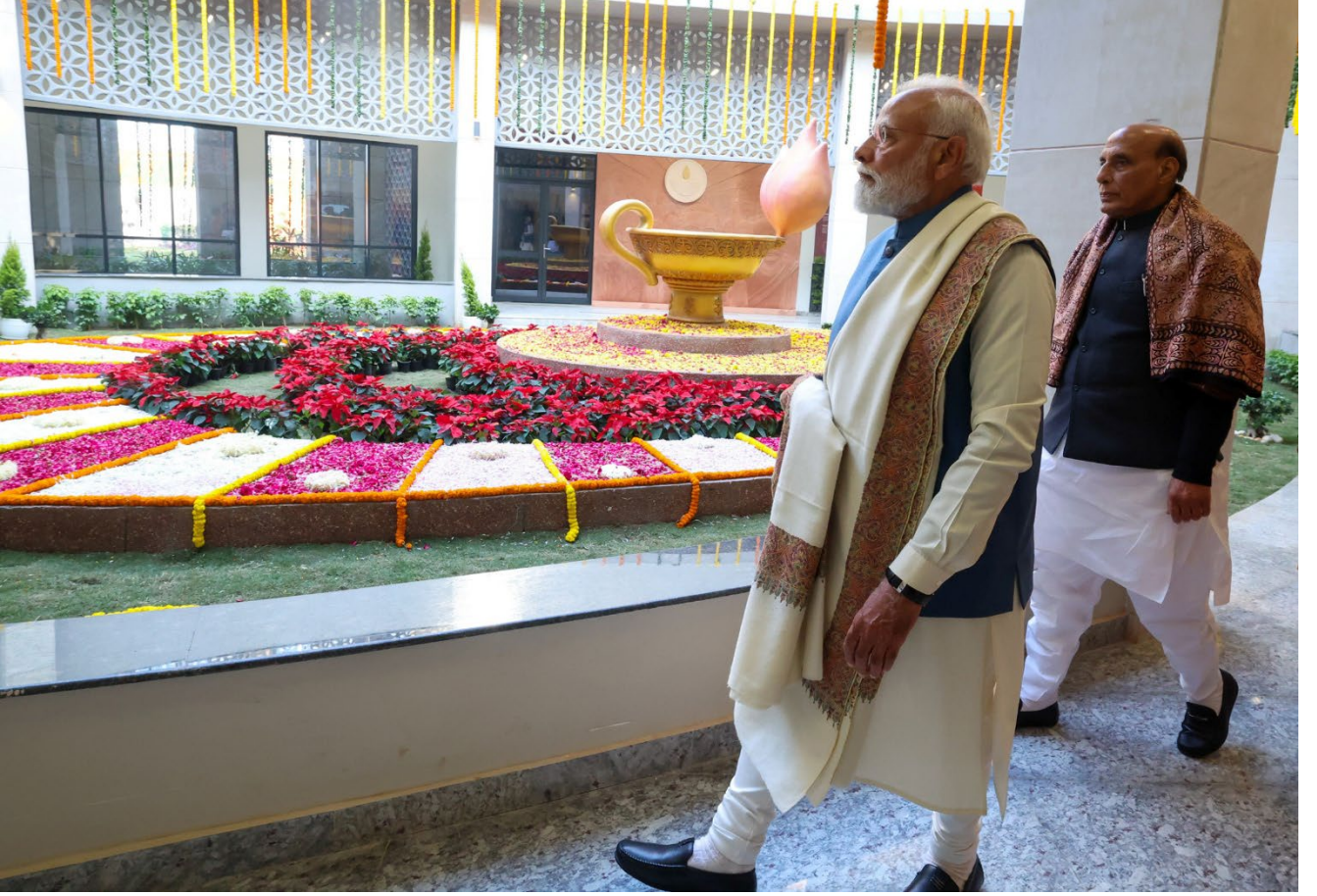
Image 11: 25 दिसंबर 2025 को उद्घाटन के पश्चात माननीय प्रधानमंत्री श्री नरेंद्र मोदी जी, केंद्रीय मंत्री श्री राजनाथ सिंह जी के साथ, राष्ट्र प्रेरणा स्थल, बसंत कुंज योजना, लखनऊ की गैलरी एवं विभिन्न अनुभागों का अवलोकन करते हुए।