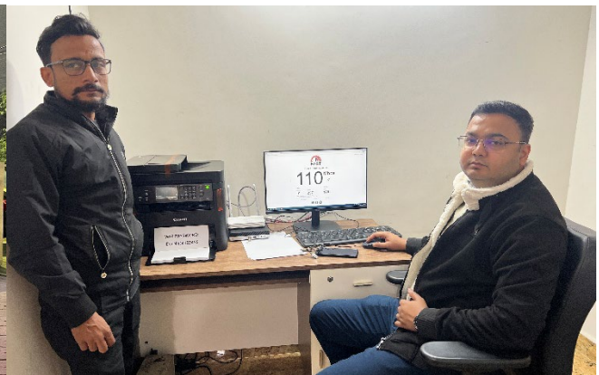
Image 6: ADIO (right) and DRM (left) during inspection of ICT arrangements at the SPG Camp Office established at VVIP Guest House "Saket", Lucknow on 23 December 2025.

NIC Lucknow further ensured round-the-clock internet connectivity and continuous ICT support at all SPG offices and VVIP Guest Houses. Close coordination with BSNL and other service providers was maintained to proactively address any technical contingencies. Multiple inspections and site visits were conducted starting from 23 December 2025 , covering the main venue as well as all associated locations, followed by comprehensive testing and trial runs to ensure complete technical preparedness.