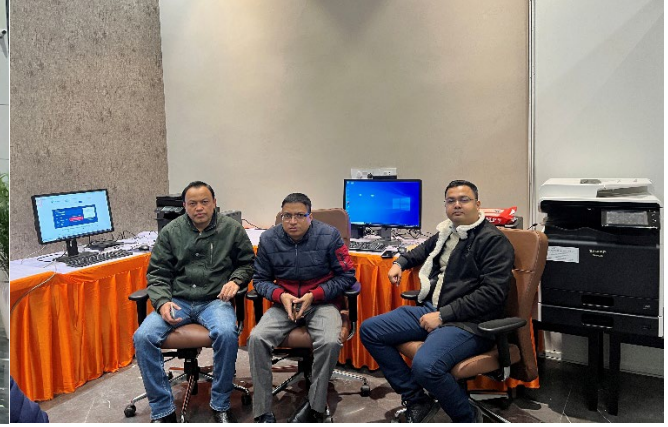
Image 4: NIC team during late-night final inspection of the Prime Minister's Office (PMO) setup at Rashtr Prerna Sthal, Basant Kunj Yojana, Lucknow, on 24 December 2025.

NIC Lucknow acted as the primary nodal ICT agency for the programme and played a central role in coordinating and facilitating communication between the Prime Minister's Office (PMO) and various stakeholder departments, including SPG, BSNL, Awas Vikas Parishad , and the Aabkari Department . NIC Lucknow ensured seamless inter-departmental cooperation to meet the stringent ICT, security, and protocol requirements associated with a VVIP event of national importance.