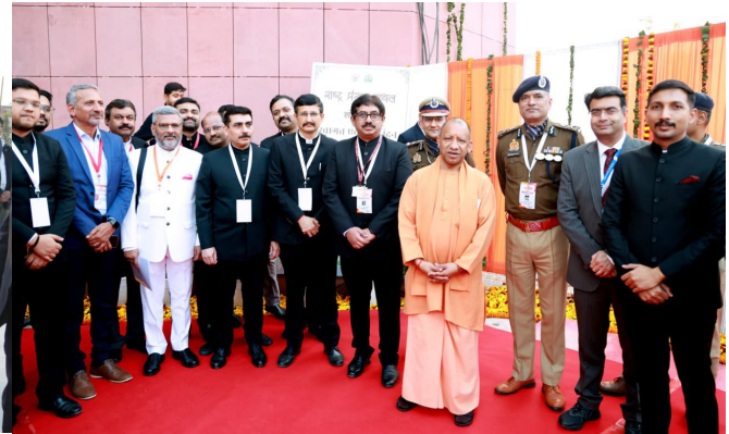
Image 2: Hon'ble Chief Minister of Uttar Pradesh with the District Magistrate, Commissioner and senior officers during the inauguration of Rashtr Prerna Sthal, Basant Kunj Yojana, Lucknow.

The inauguration ceremony was graced by the august presence of the Hon'ble Governor of Uttar Pradesh, Smt. Anandiben Patel , and the Hon'ble Chief Minister of Uttar Pradesh, Shri Yogi Adityanath . The event was also attended by Union Ministers Shri Rajnath Singh and Shri Pankaj Chaudhary . Among other distinguished dignitaries, the Hon'ble Deputy Chief Ministers of Uttar Pradesh, Shri Keshav Prasad Maurya and Shri Brajesh Pathak , were present, along with several other Hon'ble Ministers of the Government of Uttar Pradesh . The programme was further supported by the active involvement of the district administration under the leadership of Shri Vishak G, IAS, District Magistrate, Lucknow , whose supervision ensured smooth coordination and flawless execution of all arrangements.