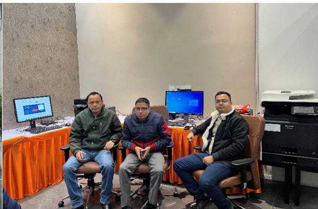
Image 3: 24 दिसंबर 2025 को राष्ट्र प्रेरणा स्थल, लखनऊ में प्रधानमंत्री कार्यालय (PMO) की व्यवस्थाओं हेतु देर रात्रि आई०सी०टी० सेटअप एवं अंतिम परीक्षण के दौरान डी०आई०ओ० (मध्य), ए०डी०आई०ओ० (दाएँ) एवं डी०आर०एम० (बाएँ)।