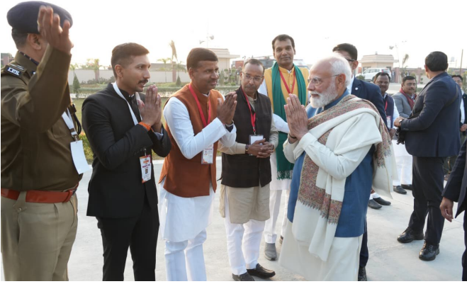
Image 1: राष्ट्र प्रेरणा स्थल, बसंत कुंज योजना, लखनऊ में माननीय प्रधानमंत्री जी का आगमन पर जिलाधिकारी, लखनऊ द्वारा स्वागत।

राष्ट्रीय सूचना विज्ञान केंद्र (एनआईसी), लखनऊ जिला केंद्र द्वारा 25 दिसंबर 2025 को लखनऊ में आयोजित राष्ट्र प्रेरणा स्थल, बसंत कुंज योजना, लखनऊ के उद्घाटन अवसर पर भारत के माननीय प्रधानमंत्री श्री नरेंद्र मोदी की यात्रा के दौरान व्यापक एवं मिशन-क्रिटिकल आई०सी०टी० सहयोग प्रदान किया गया।