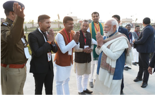
Image 1: Hon'ble Prime Minister of India being welcomed by the District Magistrate, Lucknow, at Rashtr Prerna Sthal, Basant Kunj Yojana, Lucknow.

National Informatics Centre (NIC), Lucknow District Centre, provided extensive and mission-critical ICT support during the visit of the Hon'ble Prime Minister of India, Shri. Narendra Modi , to Lucknow for the inauguration of Rashtr Prerna Sthal, Basant Kunj Yojana, Lucknow , held on 25 December 2025 .