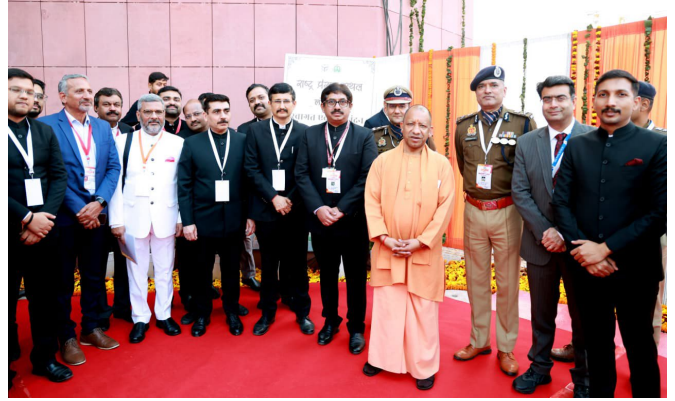
Image 2: राष्ट्र प्रेरणा स्थल, बसंत कुंज योजना, लखनऊ के उद्घाटन अवसर पर उत्तर प्रदेश के माननीय मुख्यमंत्री जी, जिलाधिकारी, आयुक्त एवं वरिष्ठ अधिकारियों के साथ।

उद्घाटन समारोह में उत्तर प्रदेश की माननीय राज्यपाल श्रीमती आनंदीबेन पटेल एवं उत्तर प्रदेश के माननीय मुख्यमंत्री श्री योगी आदित्यनाथ की गरिमामयी उपस्थिति रही। इस अवसर पर केंद्रीय मंत्री श्री राजनाथ सिंह एवं श्री पंकज चौधरी भी उपस्थित रहे। अन्य विशिष्ट अतिथियों में उत्तर प्रदेश के माननीय उपमुख्यमंत्री श्री केशव प्रसाद मौर्य एवं श्री ब्रजेश पाठक सहित उत्तर प्रदेश सरकार के कई अन्य माननीय मंत्रीगण उपस्थित रहे।