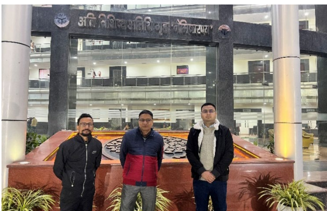
Image 7: 23 दिसंबर 2025 को लखनऊ स्थित वी०वी०आई०पी० अतिथि गृह "नैमिषारण्य" में स्थापित एस०पी०जी० कैंप कार्यालय में आई०सी०टी० व्यवस्थाओं के निरीक्षण के दौरान डी०आई०ओ० (मध्य), ए०डी०आई०ओ० (दाएँ) एवं डी०आर०एम० (बाएँ)।

उद्घाटन कार्यक्रम की ऑन-साइट व्यवस्थाओं के अतिरिक्त, एन०आई०सी० लखनऊ को सांसद खेल महोत्सव की वीडियो कॉन्फ्रेंस के समन्वय, परीक्षण एवं सफल संचालन की जिम्मेदारी भी सौंपी गई, जिसकी अध्यक्षता नई दिल्ली से माननीय प्रधानमंत्री द्वारा की गई। इसके लिए एन०आई०सी० लखनऊ द्वारा सिटी मॉन्टेसरी स्कूल (सी०एम०एस०), कानपुर रोड, लखनऊ में एक समर्पित तकनीकी टीम तैनात की गई, जहाँ वी०सी० सेट-अप की स्थापना, परीक्षण एवं निरंतर निगरानी कर निर्बाध सहभागिता सुनिश्चित की गई।