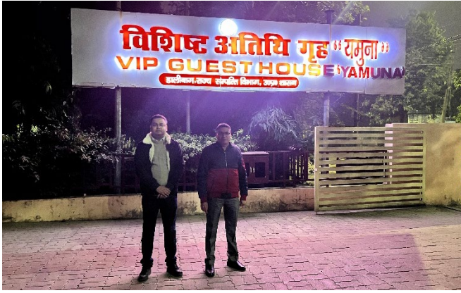
Image 5: 23 दिसंबर 2025 को लखनऊ स्थित वी०आई०पी० अतिथि गृह "यमुना" में स्थापित एस०पी०जी० कैंप कार्यालय में आई०सी०टी० व्यवस्थाओं की स्थापना एवं निरीक्षण के दौरान डी०आई०ओ० (दाएँ) एवं ए०डी०आई०ओ० (बाएँ)।