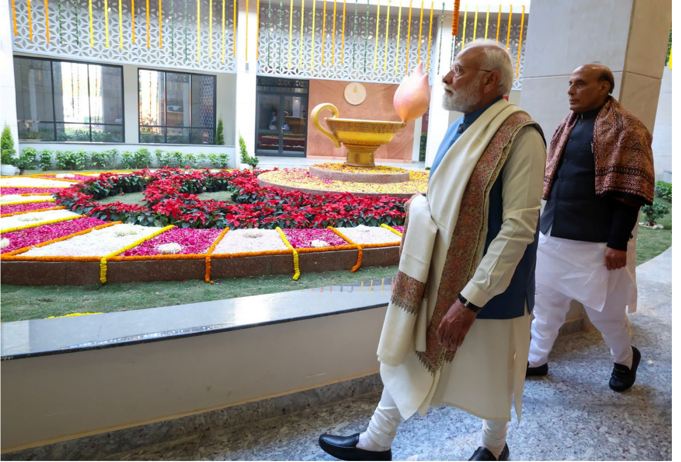
Image 11: Hon'ble Prime Minister Shri Narendra Modi, accompanied by Union Minister Shri Rajnath Singh, visiting the gallery and various sections of Rashtr Prerna Sthal, Basant Kunj Yojana, Lucknow, after the inauguration on 25 December 2025.