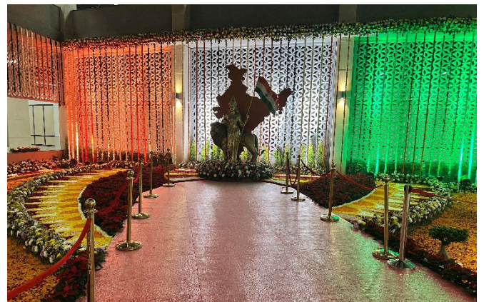
Image 8: उद्घाटन कार्यक्रम के अवसर पर सुसज्जित एवं प्रकाश से अलंकृत राष्ट्र प्रेरणा स्थल, बसंत कुंज योजना, लखनऊ में भारत माता (भारत के मानचित्र) की कलात्मक प्रस्तुति।

माननीय प्रधानमंत्री की संपूर्ण यात्रा अवधि के दौरान एन०आई०सी० लखनऊ की टीम सतत सक्रिय स्थिति में रही तथा सभी सहभागी विभागों के साथ वास्तविक