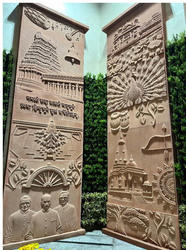
Image 10: Stone carvings depicting temples, cultural symbols and artistic motifs reflecting the rich and diverse cultural heritage of India at Rashtr Prerna Sthal, Lucknow.