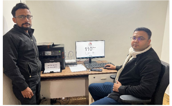
Image 6: 23 दिसंबर 2025 को लखनऊ स्थित वी०वी०आई०पी० अतिथि गृह "साकेत" में स्थापित एस०पी०जी० कैंप कार्यालय में आई०सी०टी० व्यवस्थाओं के निरीक्षण के दौरान ए०डी०आई०ओ० (दाएँ) एवं डी०आर०एम० (बाएँ)।

एन०आई०सी० लखनऊ द्वारा सभी एस०पी०जी० कार्यालयों एवं वी०वी०आई०पी० अतिथि गृहों पर चौबीसों घंटे इंटरनेट कनेक्टिविटी एवं सतत आई०सी०टी० सहयोग सुनिश्चित किया गया। बी०एस०एन०एल० एवं अन्य सेवा प्रदाताओं के साथ निकट समन्वय रखते हुए किसी भी संभावित तकनीकी समस्या का पूर्व-निवारण किया गया। 23 दिसंबर 2025 से मुख्य स्थल सहित सभी संबद्ध स्थलों पर अनेक निरीक्षण एवं साइट विज़िट की गईं, जिनके पश्चात व्यापक परीक्षण एवं ट्रायल रन के माध्यम से पूर्ण तकनीकी तैयारी सुनिश्चित की गई।