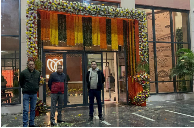
Image 3: DIO (center), ADIO (right) and DRM (left) during late-night ICT setup and final testing for PMO arrangements at Rashtr Prerna Sthal, Lucknow, on 24 December 2025.