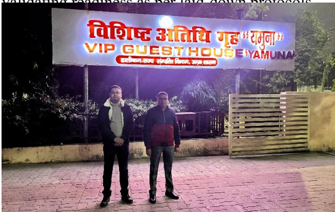
Image 5: DIO (right) and ADIO (left) during setup and inspection of ICT arrangements at the SPG Camp Office established at VIP Guest House "Yamuna", Lucknow on 23 December 2025.

As part of the preparatory activities, NIC Lucknow coordinated the establishment of the PMO setup at the main event site , Rashtr Prerna Sthal, Basant Kunj Yojana, Lucknow. Simultaneously, NIC Lucknow facilitated the setting up of SPG offices at multiple VVIP Guest Houses across Lucknow , ensuring provisioning of secure internet connectivity, ICT infrastructure, and communication facilities. NIC teams carried out physical verification of all SPG office setups , validating readiness as per laid down protocols.