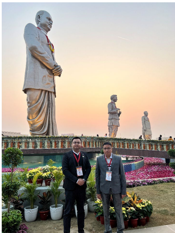
Image 9: DIO (right) and ADIO (left) Rashtr Prerna Sthal, Basant Kunj Yojana, Lucknow, after the successful completion of the programme and departure of the Hon’ble Prime Minister of India, with statues of former national leaders visible in the background.

The smooth conduct of ICT operations during the Hon’ble Prime Minister’s visit reaffirmed NIC’s role as a trusted and reliable technology partner for VVIP and national-level events , capable of delivering secure, robust, and mission-critical ICT services under demanding timelines.