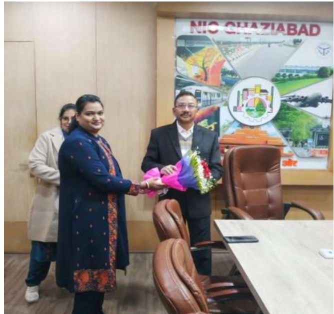
Welcome by D.I.O. and D.I.A.