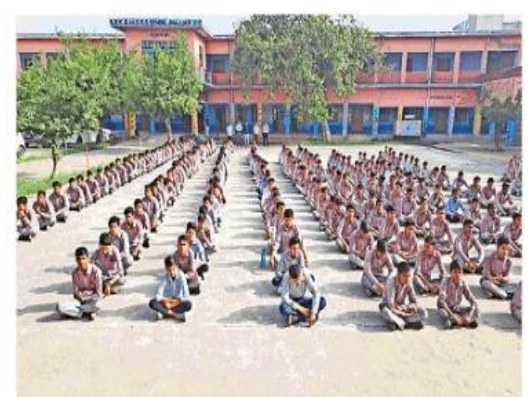
शेड्यूल के हिसाब से तय कार्यक्रम में वर्चुअल रुप से जुड़ते हुए विद्यार्थी । • डीपीआर

का ये पारंपरिक तरीका हैं । घर, मोहल्ले और स्कूल में पहले भी ऐसी पहेली बुझो जाती थी। इससे बच्चों की दिमागी कसरत होती है। डीसी ने शिक्षा विभाग के अधिकारियों से कहा कि स्कूल, खंड और जिला स्तर पर विवज बैंक की तर्ज पर पहेली बैंक भी तैयार करें ताकि यह कार्यक्रम गुणवत्ता के साथ आगे बढता रहे और छात्रों में रूचि पैदा हो ।